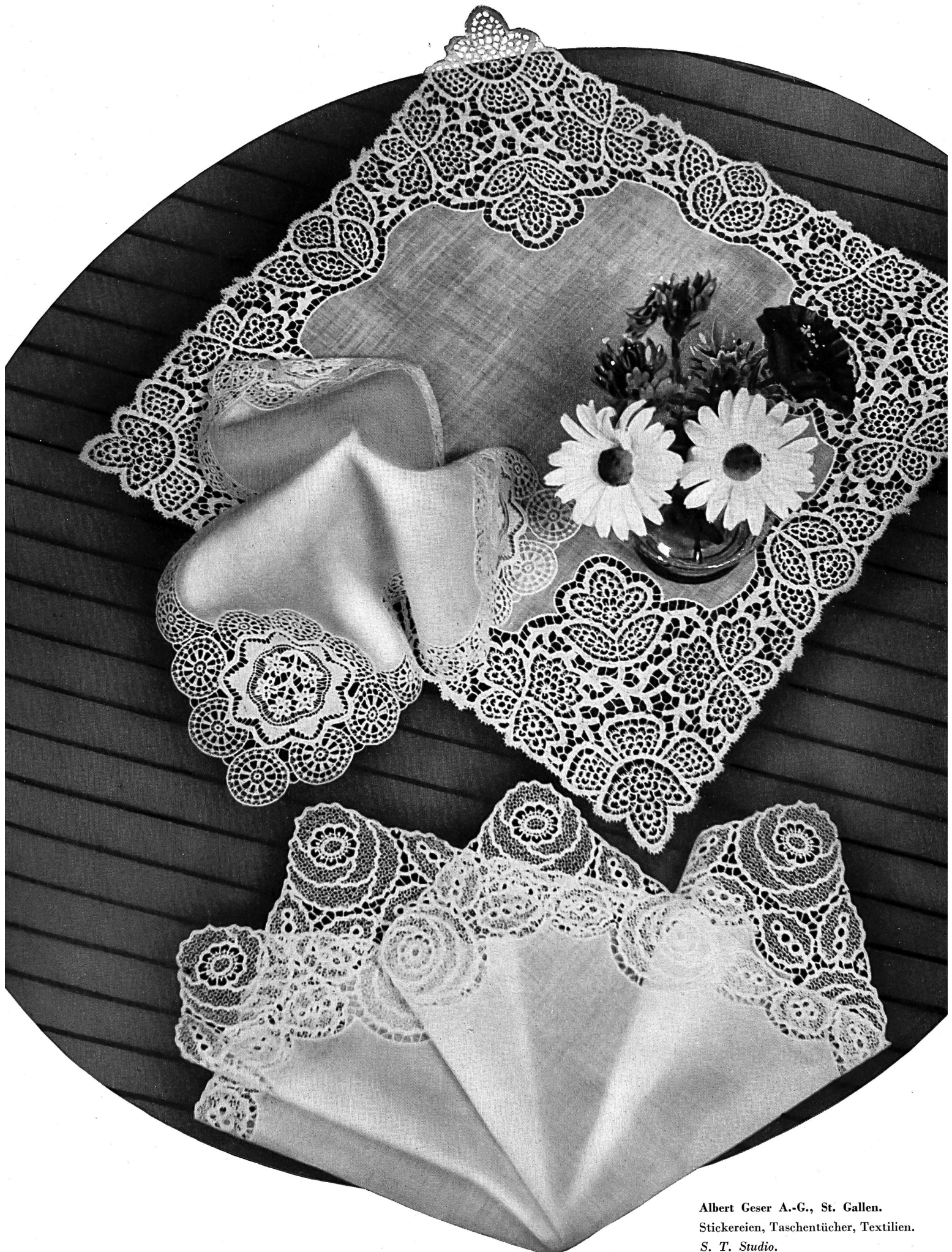
Albert Geser A.-G., St. Gallen. Stickereien, Taschentücher, Textilien. S. T. Studio.