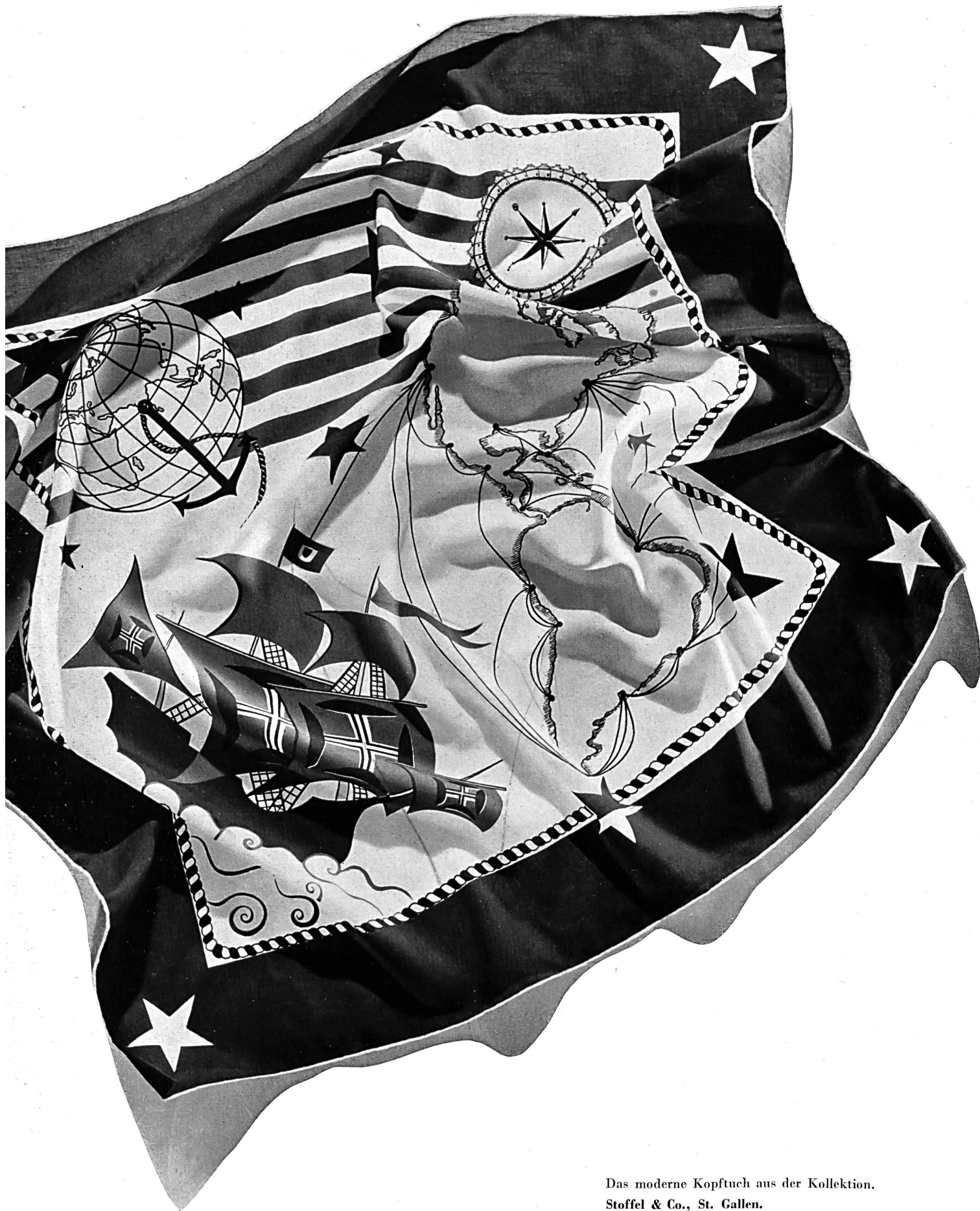
Das moderne Kopftuch aus der Kollektion. Stoffel & Co., St. Gallen.