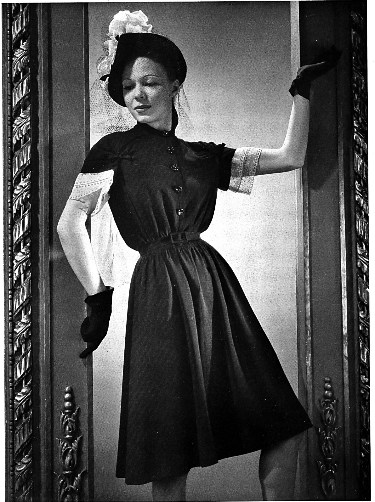
A. Naef & Co., Flawil. Kleid mit Aermeln aus besticktem Organdi. Modell Bruyère, Paris.