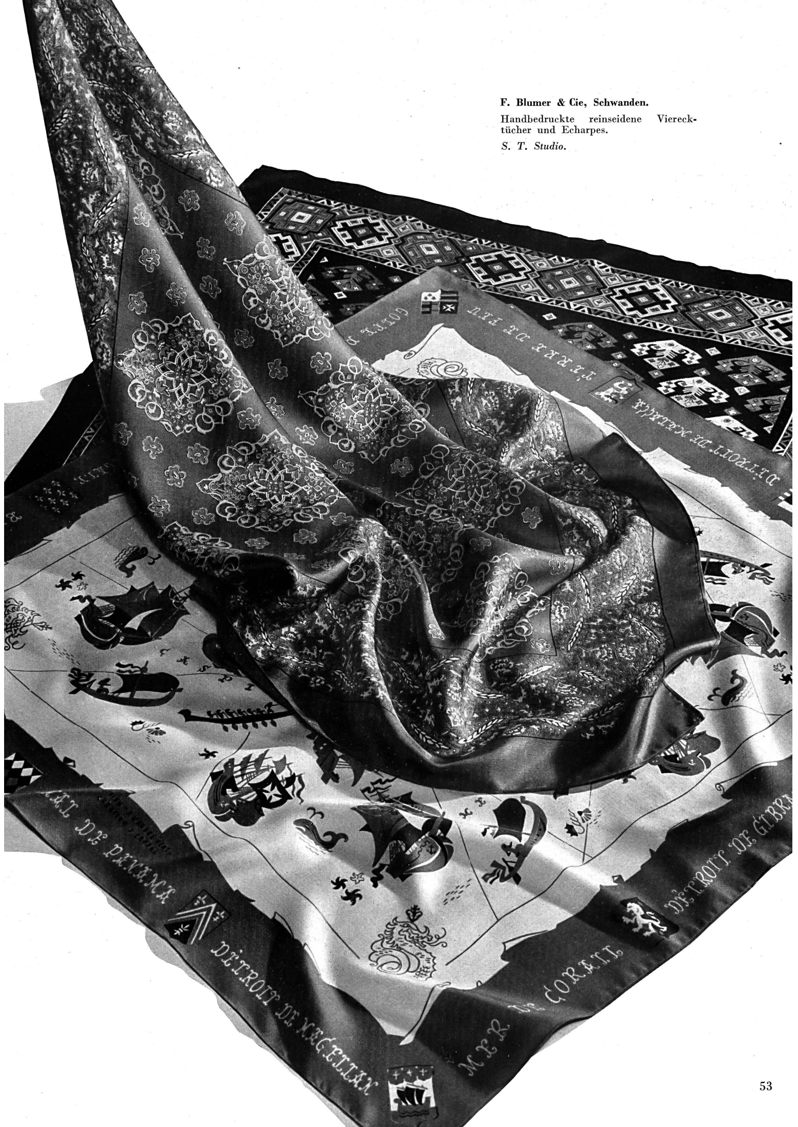
F. Blumer & Cie, Schwanden. Handbedruckte reinseidene Viereck- tücher und Echarpes. S. T. Studio.