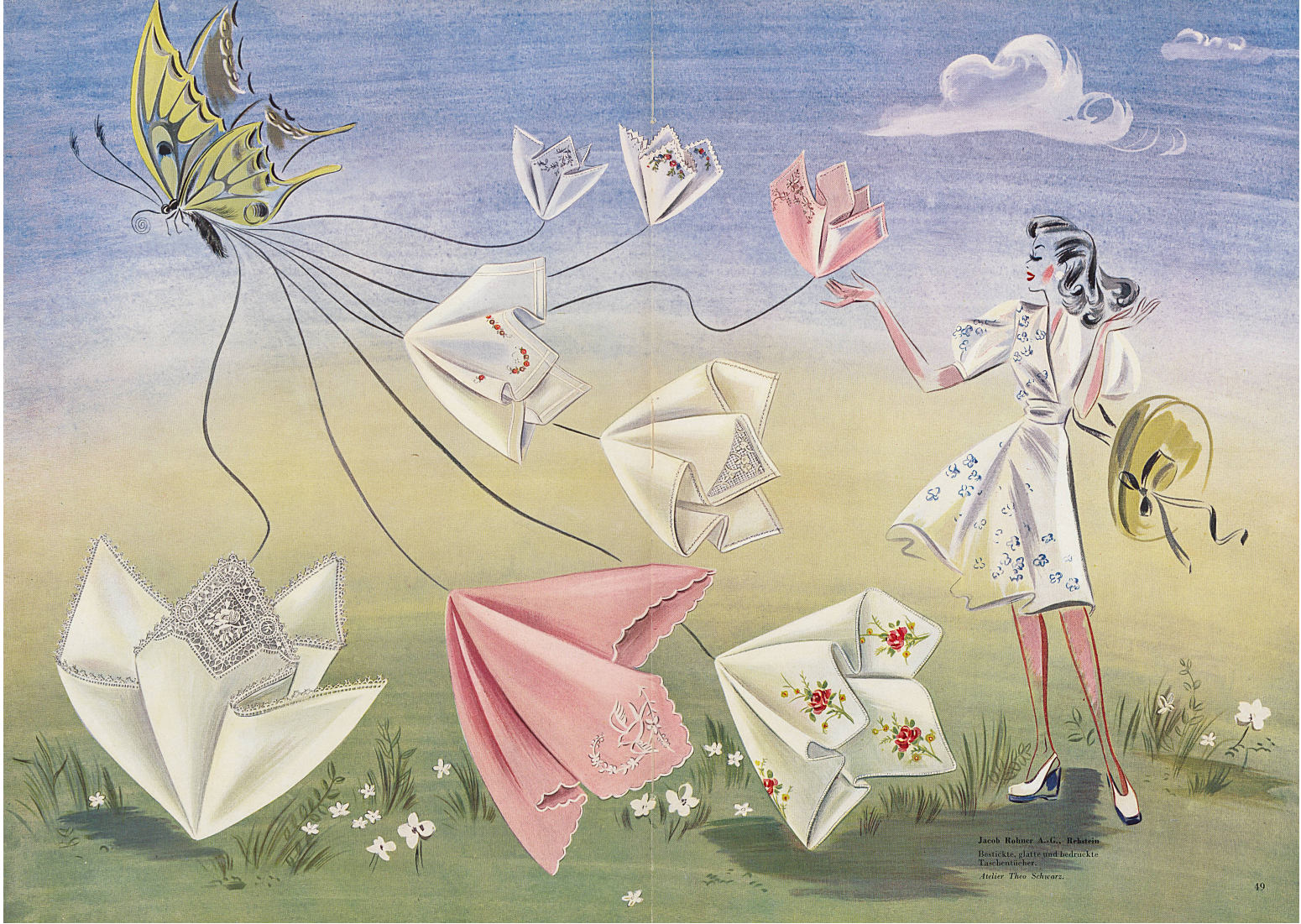
Jacob Rohrer A.-G., Reibstein. Bestückte, glatte und bedruckte Taschentücher. Atelier Theo Schwarz.