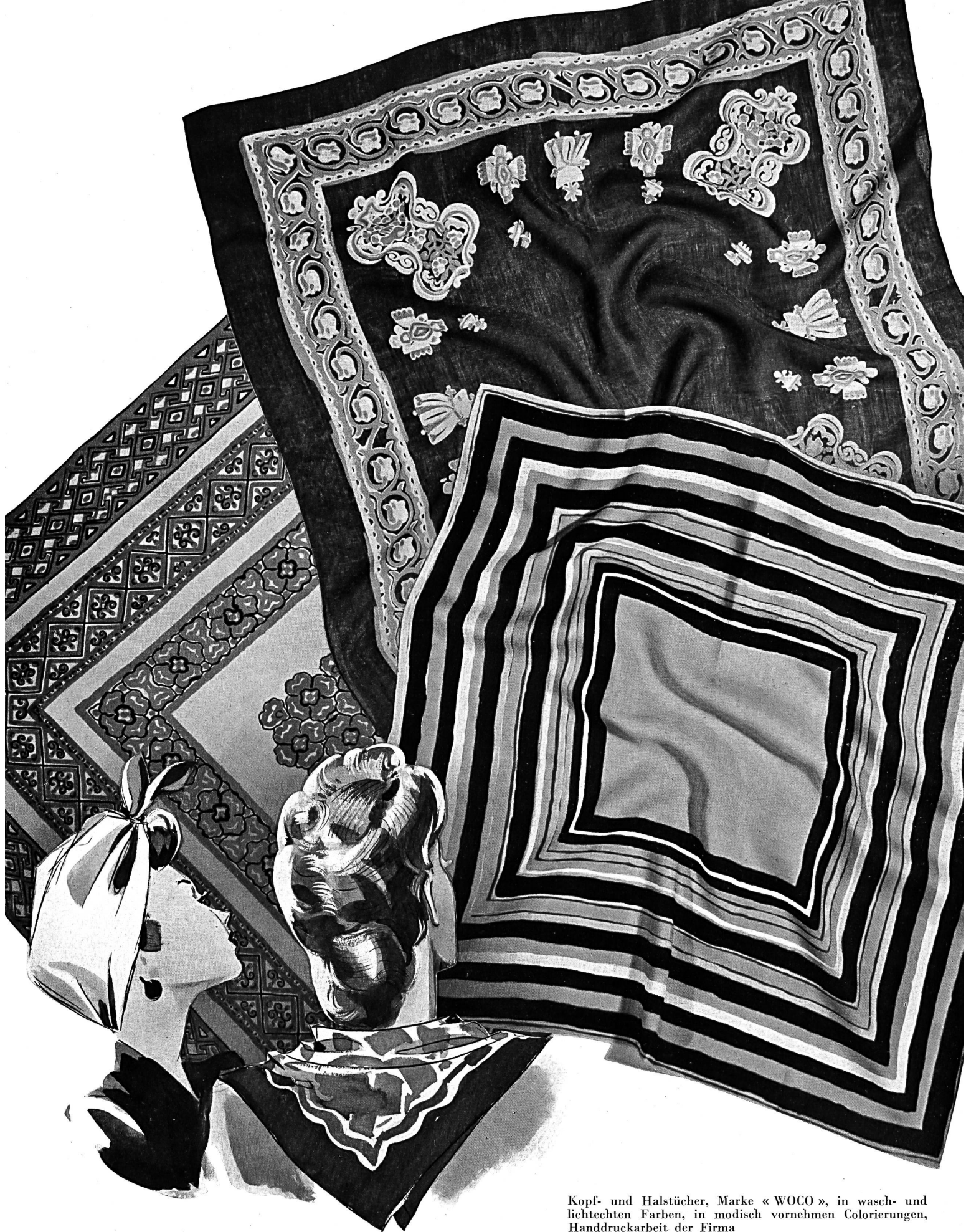
Kopf- und Halstücher, Marke «WOCO», in wasch- und lichtechten Farben, in modisch vornehmen Colorierungen, Handdruckarbeit der Firma Winzeler, Ott & Co. A.-G., Weinfelden. S. T. Studio.