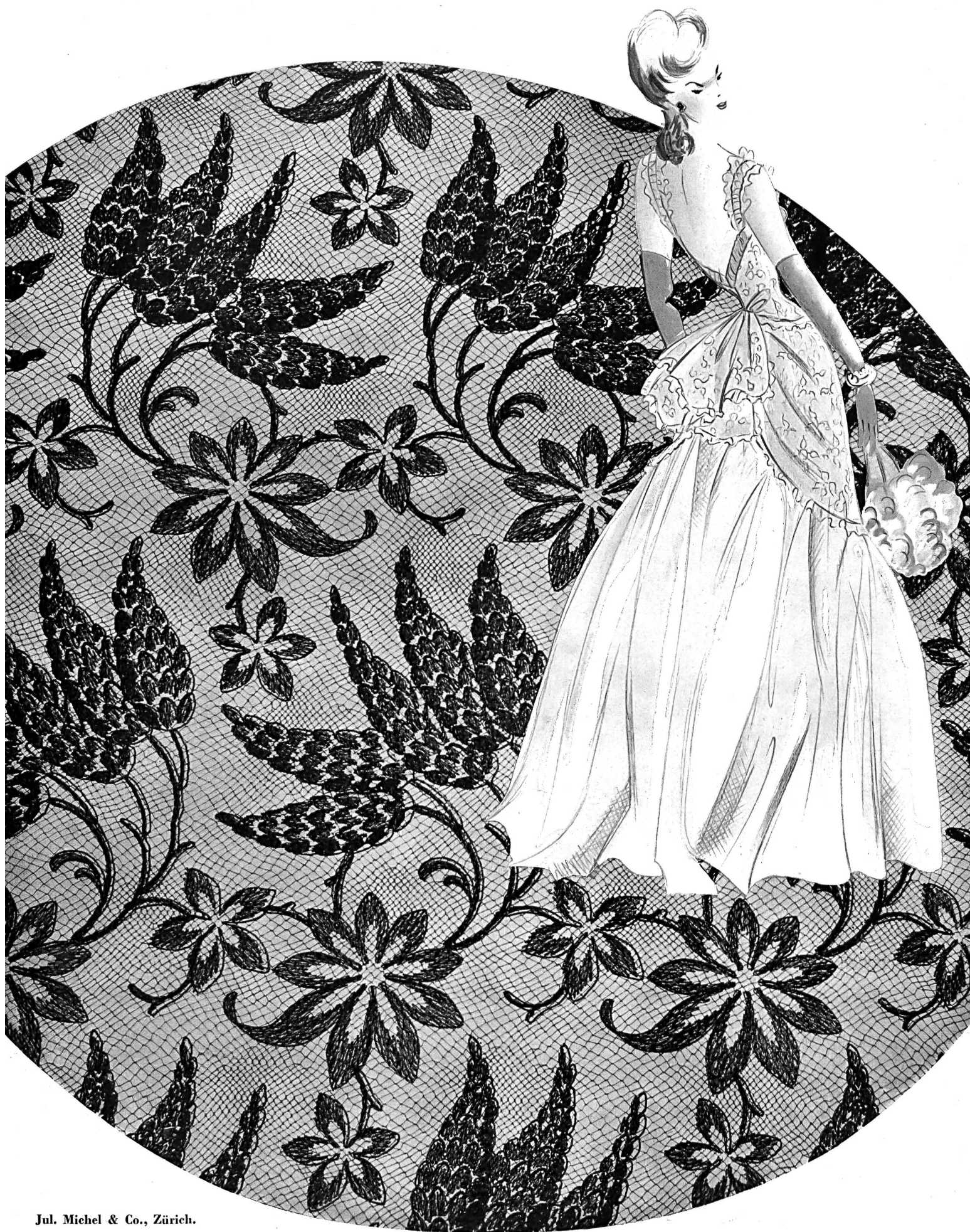
Jul. Michel & Co., Zürich. « Lupines of York », Allover aus « DENTISSU » (Patentiert). Modell Beverley. S. T. Studio.