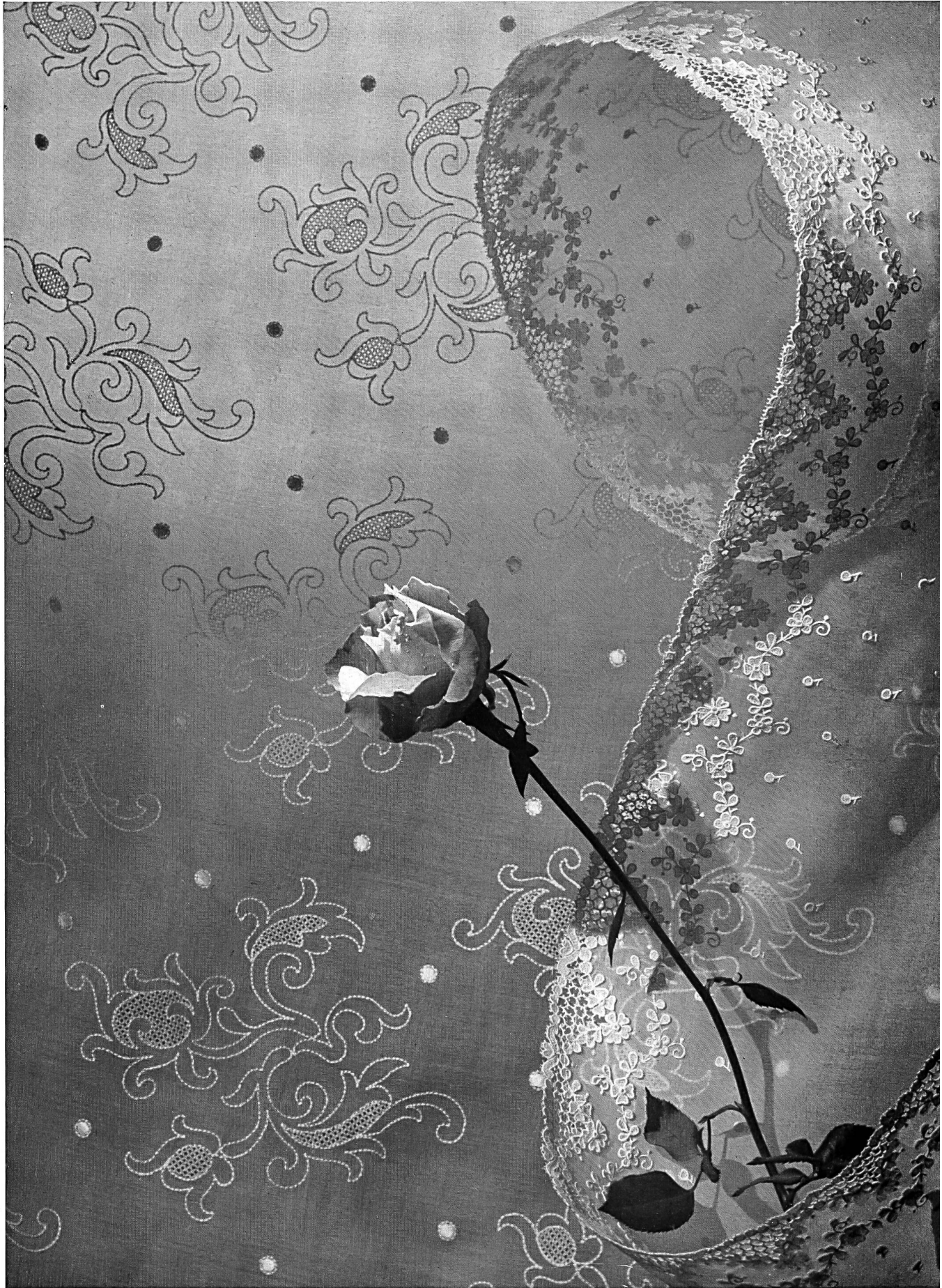
Spitze und Organdi-Stickerei aus der Kollektion Forster Willi & Co., St. Gallen.