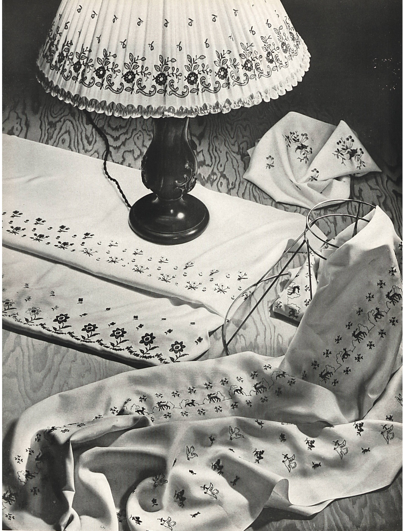
Jacob Rohner A.-G., Rebstein Bestickter Stoff für Lampenschirme.