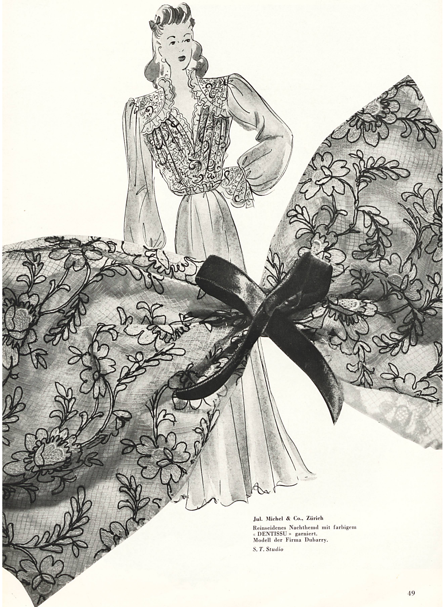
Jul. Michel & Co., Zürich Reinseidenes Nachthemd mit farbigem « DENTISSU » garniert. Modell der Firma Dubarry.