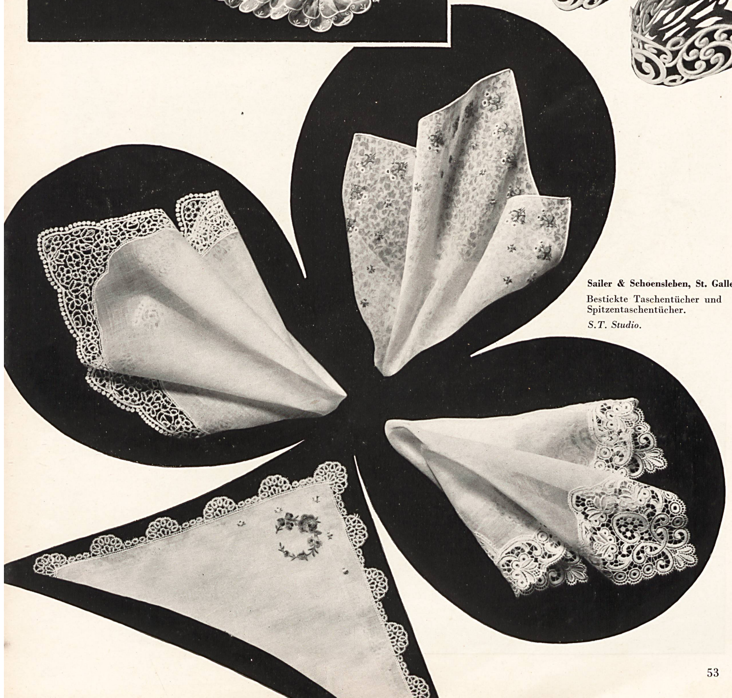
Sailer & Schoensleben, St. Gallen. Bestickte Taschentücher und Spitzentaschentücher. S.T. Studio.