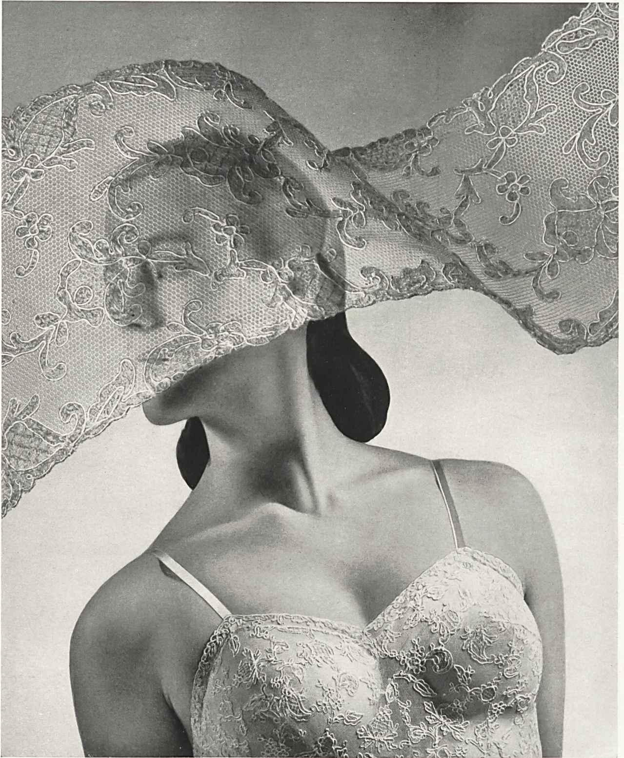
Forster Willi & Co., St. Gallen Tüll-Spitzen.