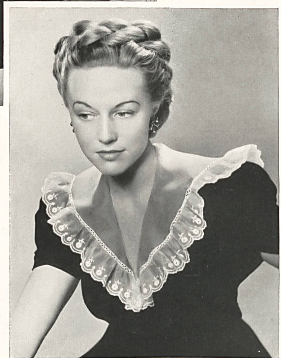
Albert Geser A.-G., St. Gallen Gestickte Kragen und Manschetten Atelier Rieser