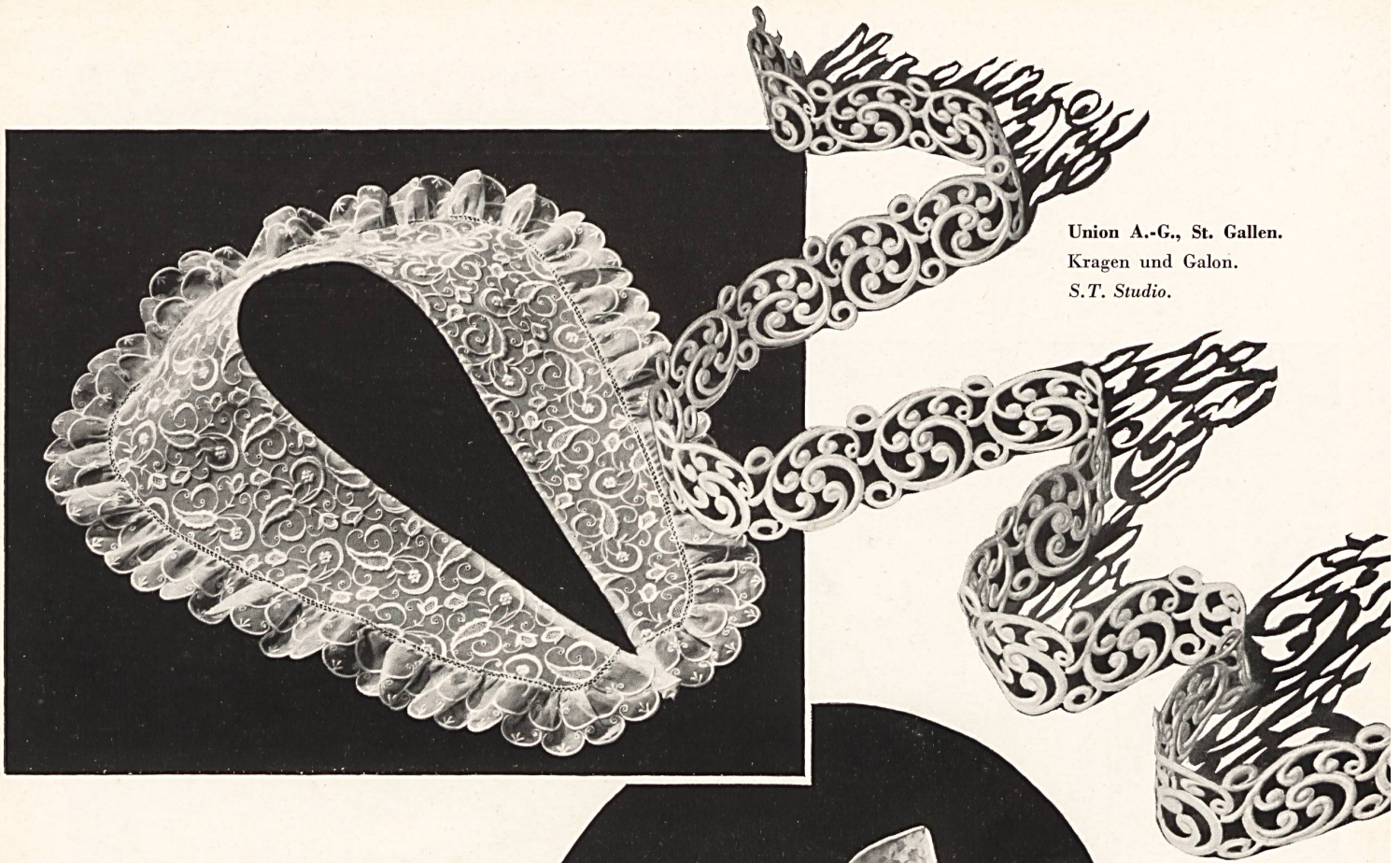
Union A.-G., St. Gallen. Kragen und Galon. S.T. Studio.