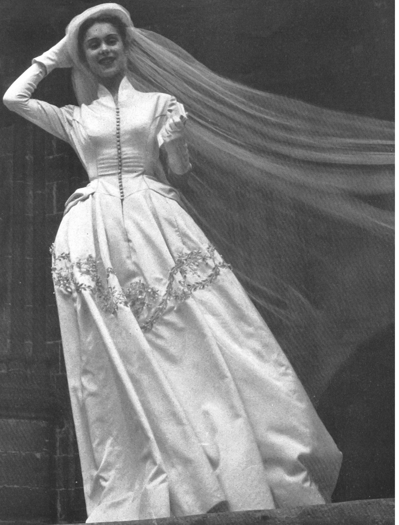
PIERRE BALMAIN L. Abraham & Cie, Soieries S. A., Zurich