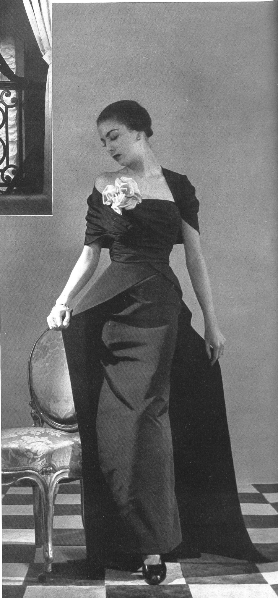
MOLYNEUX L. Abraham & Cie, Soieries S. A., Zurich