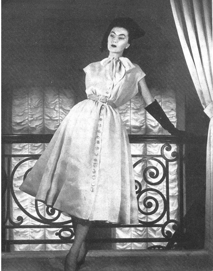
CHRISTIAN DIOR Heer & Cie S. A., Thalwil INAMO, ZURICH