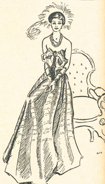
Roecliffe & Chapman, Londres. Abendkleid aus schweizerischem Plissé-Satin.