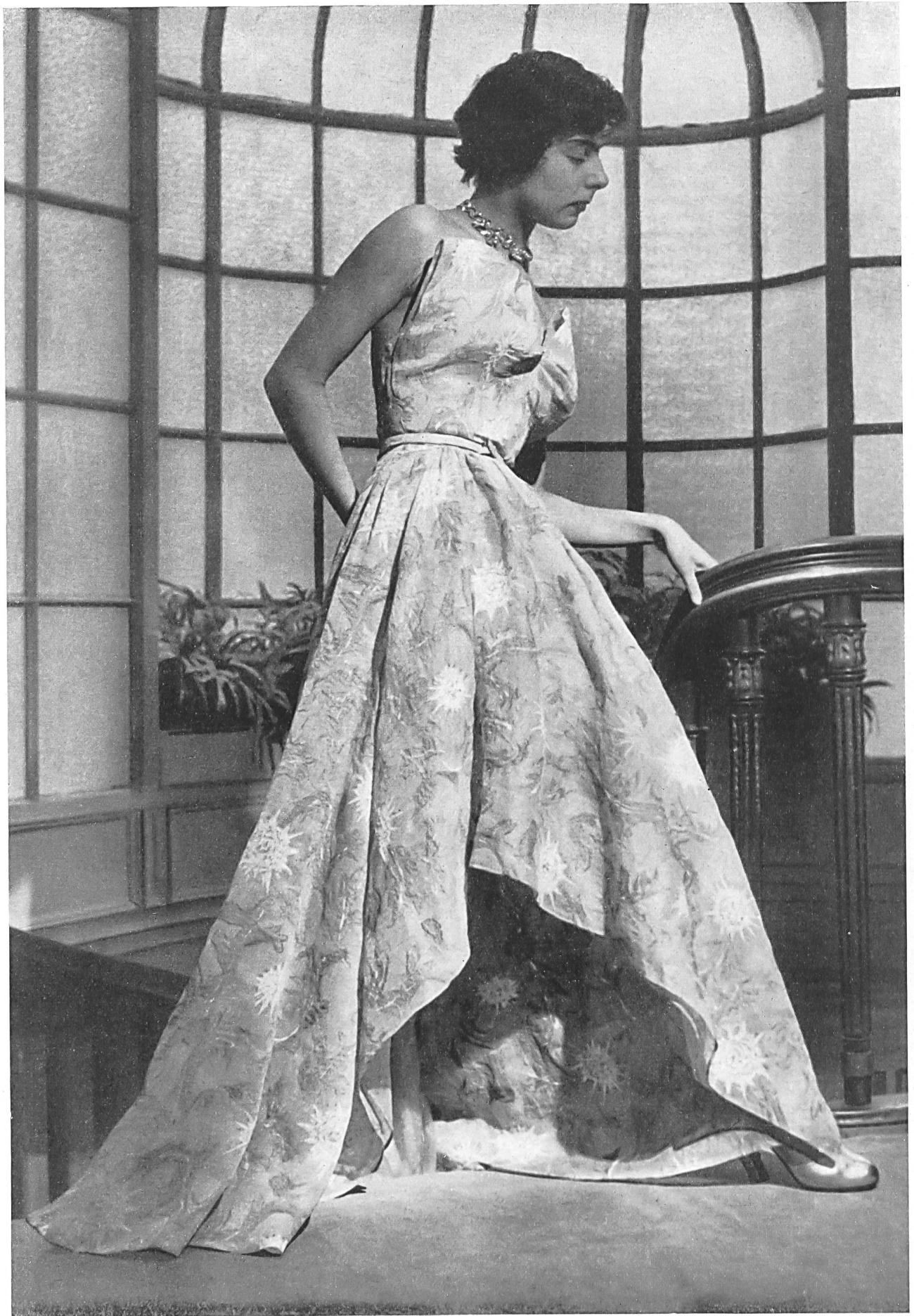
PAQUIN Emar S. A., Zurich INAMO, ZURICH