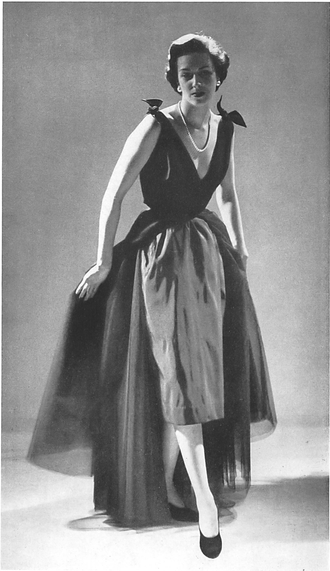
CHRISTIAN DIOR S. A. Stunzi Fils, Horgen