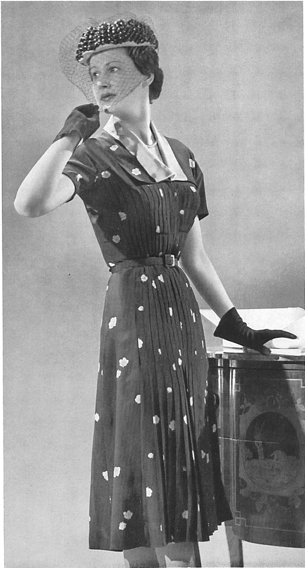
BRUYÈRE Rudolf Brauchbar & Cie, Zurich