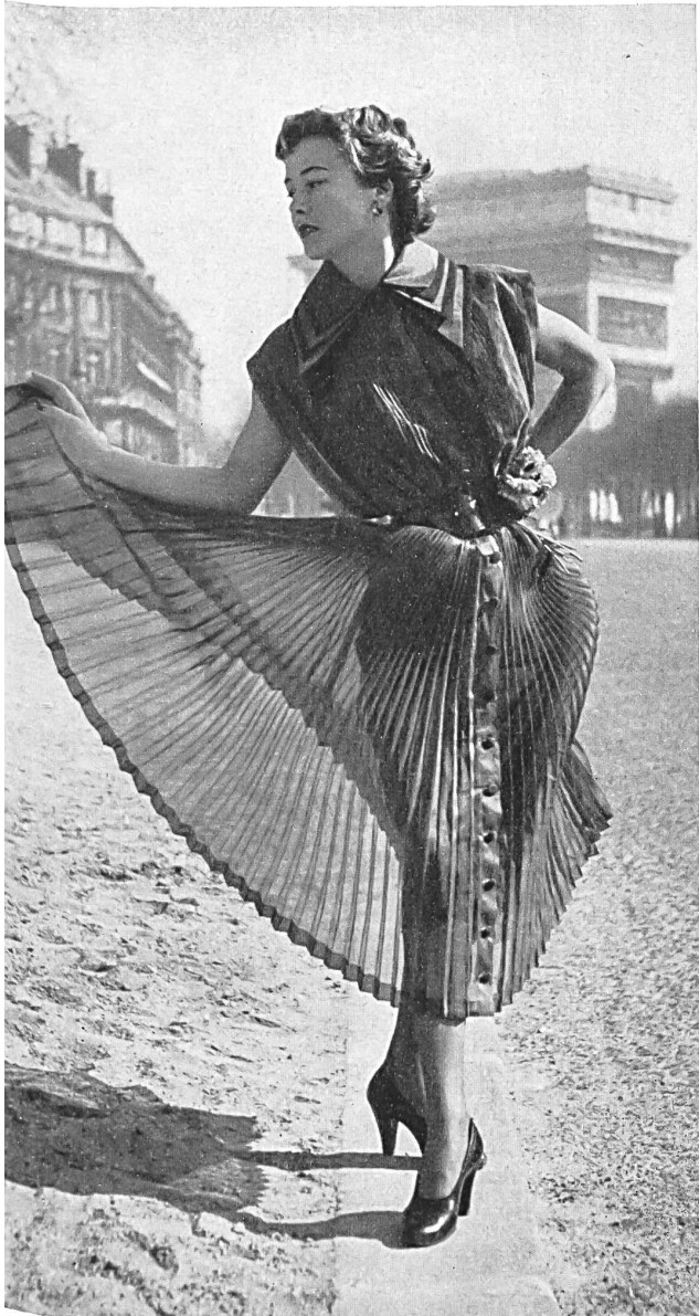
ALWYNN L. Abraham & Cie, Soieries S. A., Zurich