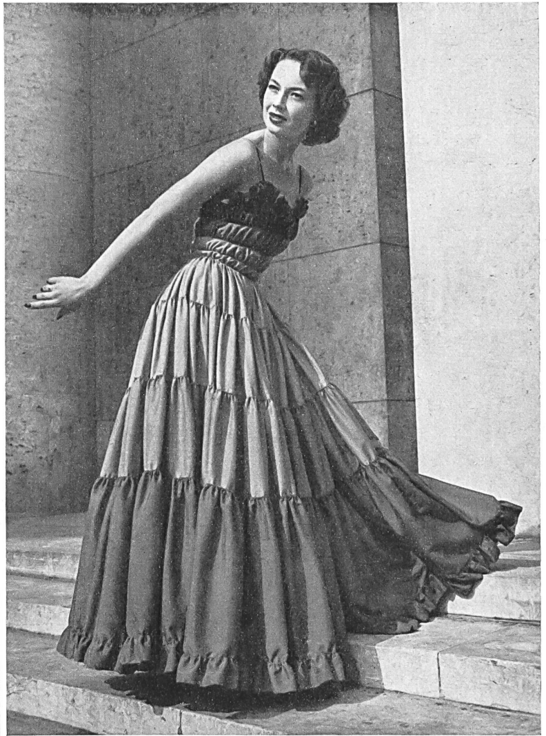
RAPHAEL Heer & Cie S. A., Thalwil INAMO, ZURICH