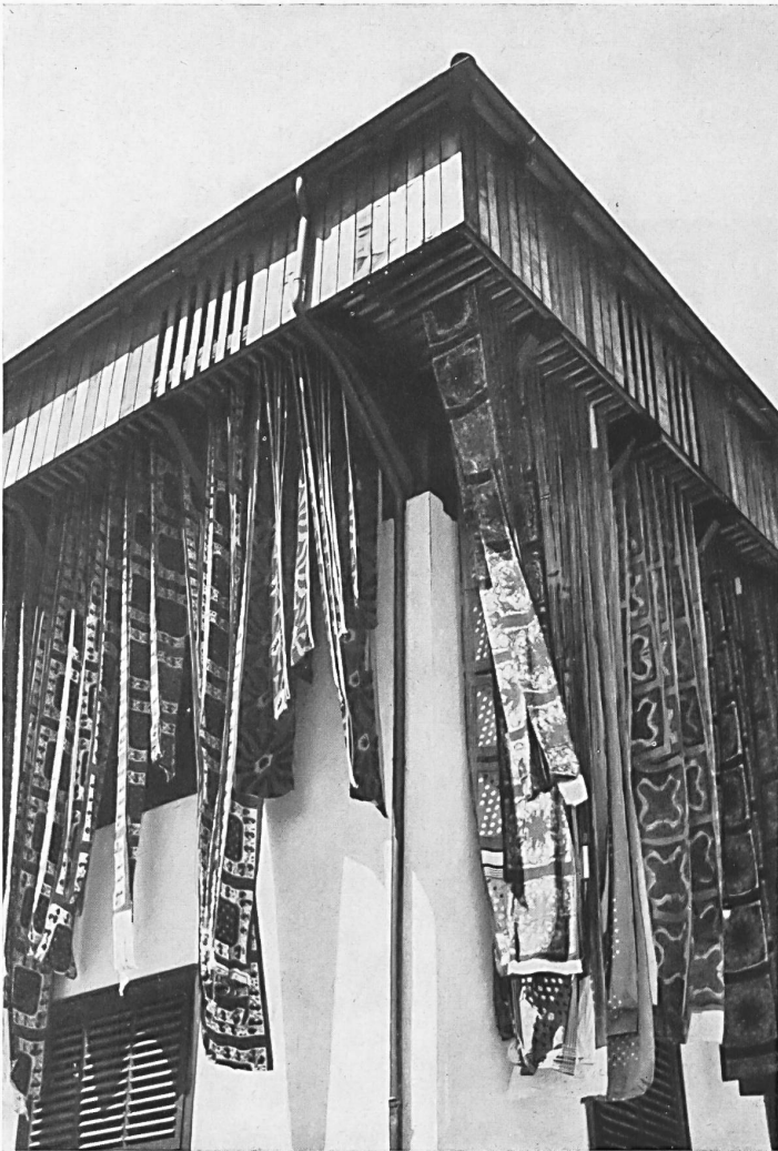
Auch heute noch werden bedruckte Stoffe im alten « Trockenturm » aufgehängt und an der freien Luft getrocknet.

Die Kunst des Stoffdruckes mit gestochenen und eingefärbten Klischees kommt aus dem Fernen Osten. Die Holländer brachten sie nach Europa, von wo aus sie über die Niederlande nach der Schweiz kam und vor allem im Kanton Neuenburg während zwei Jahrhunderten eine blühende Industrie bildete (vgl. « Textiles Suisses » Nr. 2 1950). Später wurde die Handstoffdruckerei auch in andern Gegenden der Schweiz ansässig, so beispielsweise in Genf (allerdings nur vorübergehend) und in der Nord- und Ostschweiz, ganz besonders in den entlegenen Tälern des Kantons Glarus, sowie im Kanton St. Gallen, und nahm dort rasch einen grossen Aufschwung. Vor dem ersten Weltkrieg widmeten sich in der Schweiz mehr als zwanzig Betriebe der Modell-Druckerei, und arbeiteten vor allem für den Export. Gegenwärtig ist die Zahl der schweizerischen Unternehmungen, die diese Art des Stoffdruckes pflegen, sehr klein und die Kundschaft hat sich bedeutend gewandelt. Vor der Verselbständigung des Balkans und des Orients, der blutigen oder kalten Kriege, der Krisen und eisernen Vorhänge, exportierte die Schweiz grosse Mengen mit dem Modell bedruckter Baumwollwaren nach Kleinasien, den Balkanstaaten, dem äussersten Orient und nach Afrika. Es handelte sich dabei vorwiegend um sehr einfache und immer gleiche Artikel. Jedes Land, jede Gegend, jede Völkergruppe kaufte immer nur einen bestimmten Artikel unter Ausschluss aller übrigen;