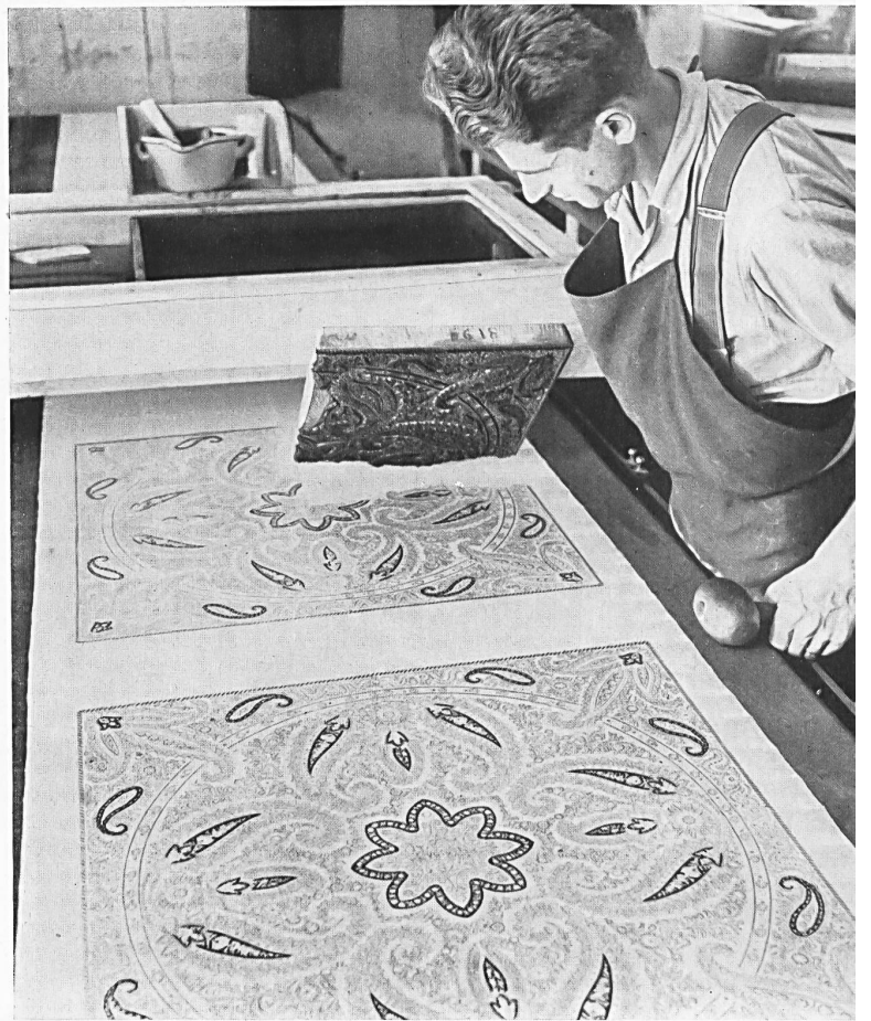
Handdruck. In seiner linken Hand hält der Arbeiter den Hammer, mit dem er auf das Grundbrett klopft, damit sich der Stoff eng daran anschmiegt.

F. Blumer & Cie, Schwanden und Textil-Werke Blumenegg A.-G., Goldach.