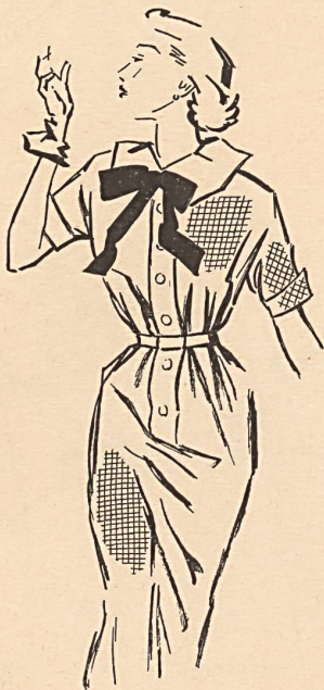
Chemisier-Kleid aus blaukariertem Taft von Mollie Parnis, New York.

Taft ist hochmodern; man verwendet ihn für Kleider, Kostüme, Blusen, Futter und tausenderlei Zutaten. Bei einer Kollektion herrlicher, aus Zürich importierter Taft ist die Qualität der Stoffe, ihre Geschmeidigkeit und unbegrenzte Vielfalt der Farben verblüffend. Sämtliche Regenbogenfarben stehen den Herstellern für die Verwirklichung ihrer Modelle für 1951 zur Verfügung. An einer