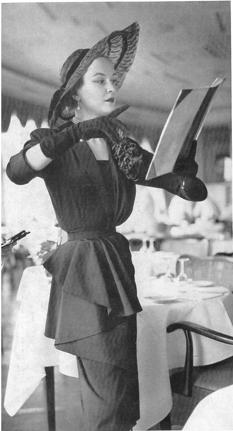
Faille pure soie de Heer & Cie S.A., Thalwil Confection : Algo S.A., Zurich.