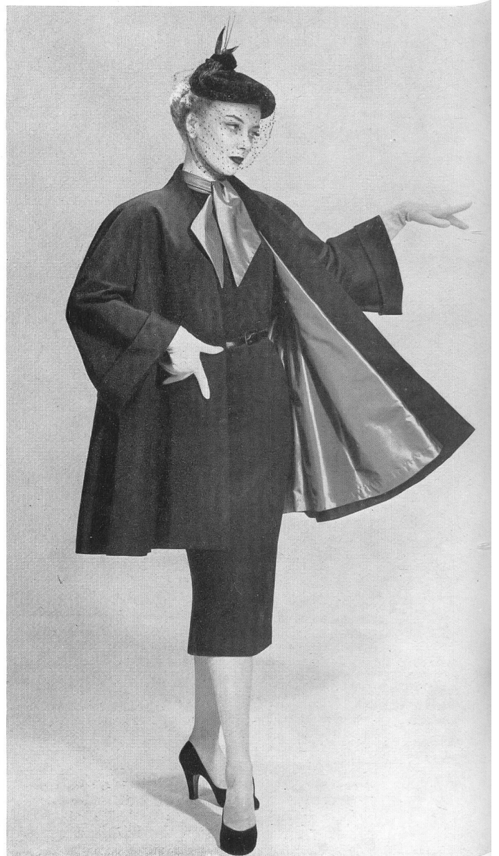
Ottoman lourd, teint en fil, de Heer & Cie S.A., Thalwil Confection : E. Braunschweig & Cie S.A., Zurich.