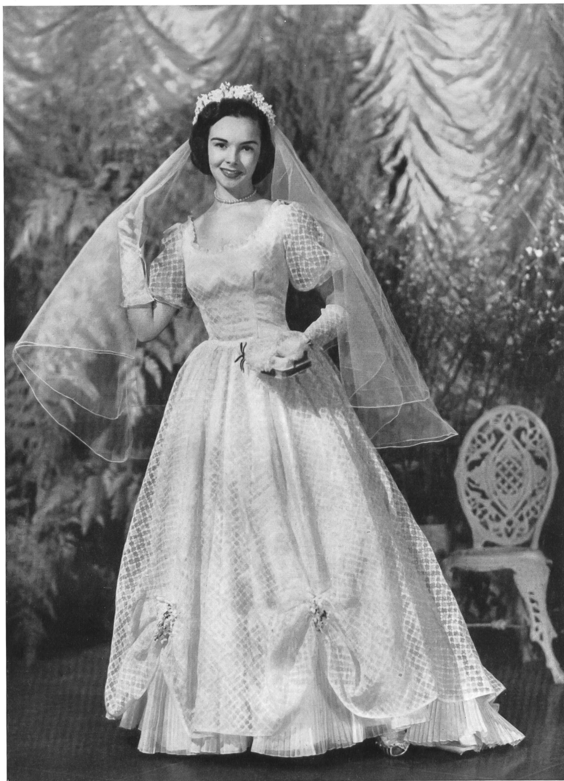
SWISS FABRIC GROUP, NEW YORK A wedding gown in a wonderful sheer novelty Swiss cotton by Ruth For- mals.

Im Waldorf Astoria in New York fand dieses Frühjahr eine beachtenswerte, von der « Swiss Fabric Group » organisierte « Fashion Show » statt, an welcher den Vertretern der amerikanischen Presse und den Leitern von Konfektionshäusern eine Serie ausschliesslich aus schweizerischen Stoffen und Stickereien hergestellter Kleider, Blusen und Wäschestücke vorgeführt wurde.