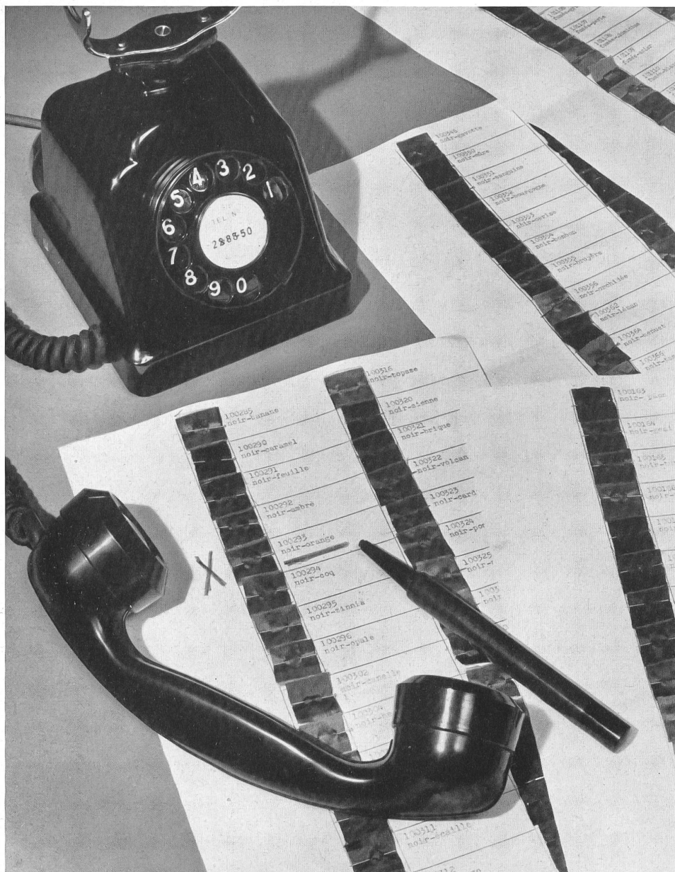
Studio Color, Zurich.