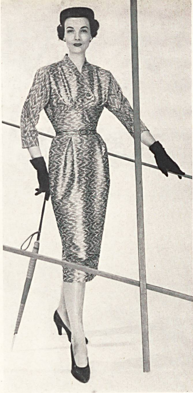
Marrakech façonné. Modèle Halldéns, Stockholm. Photo Atelier Ugglå A. B.