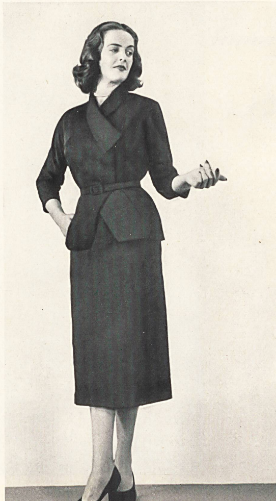
HEER & CIE S. A., THALWIL