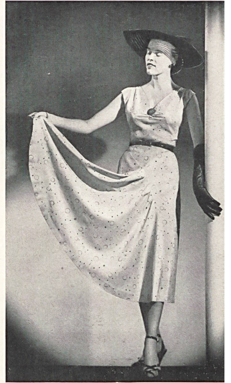
Matelassé façonné lamé. Modèle Molstad & Co., Oslo.