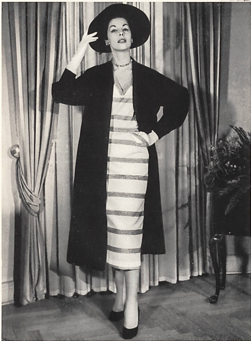
Bouclé Sport, 100 % rayonne. Modèle Bengtsons Konfektions A. B., Stockholm.