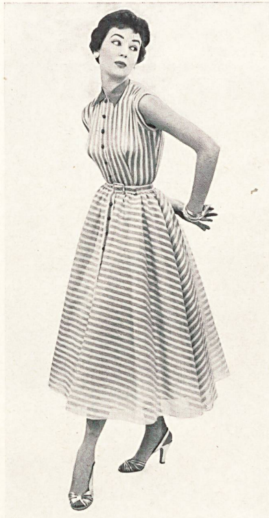
Farfalla barré. Modèle Susan Small Ltd., Londres.