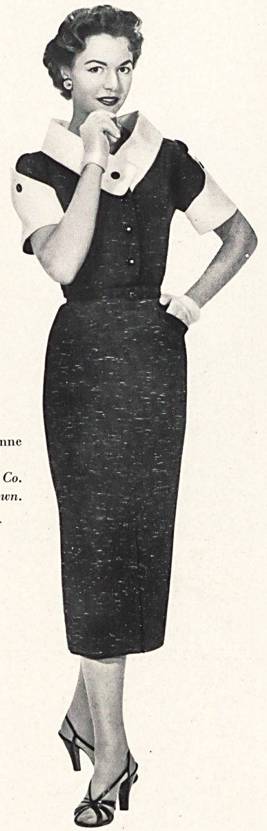
Toile Haruko, rayonne et fibranne. Modèle Hellas Mfg. Co. (Pty) Ltd., Cape Town.