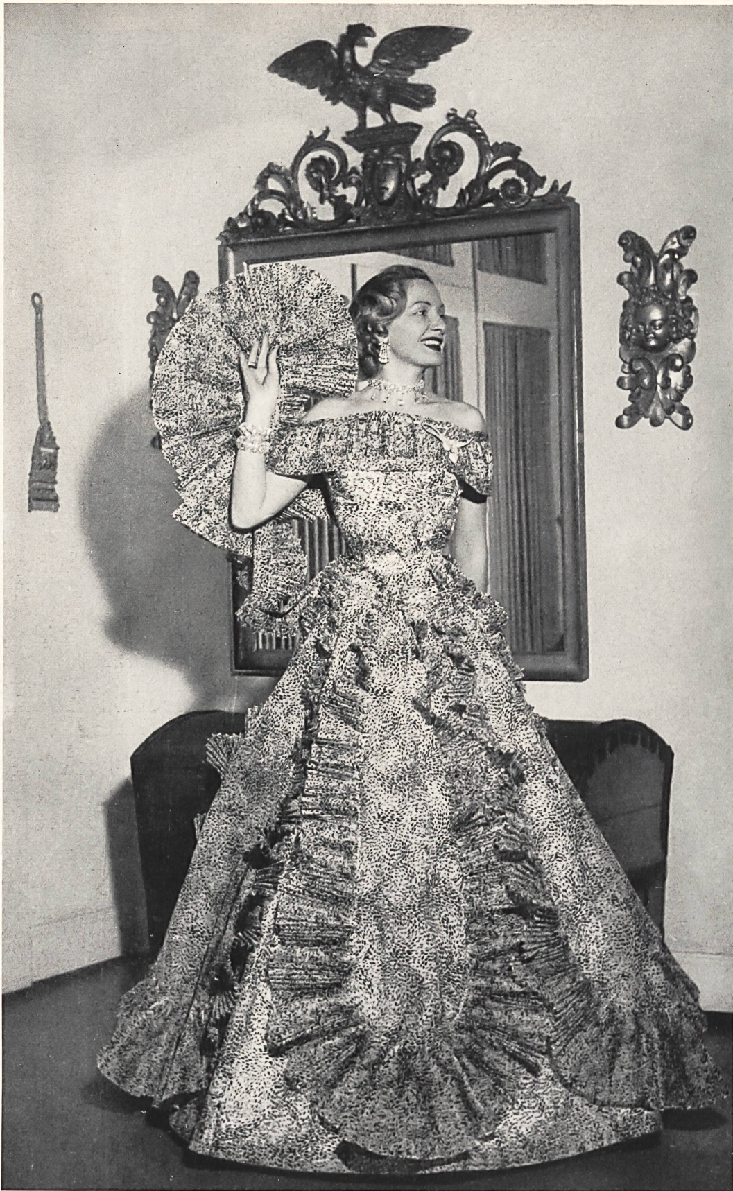
Flocosa, organdi de coton imprimé flock noir. Modèle Fred Spillmann, Bâle.