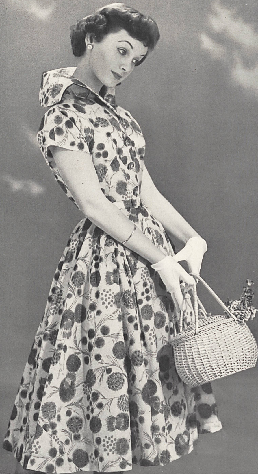
Nylon imprimé. Modèle Willy Meyer S. A., Zurich.