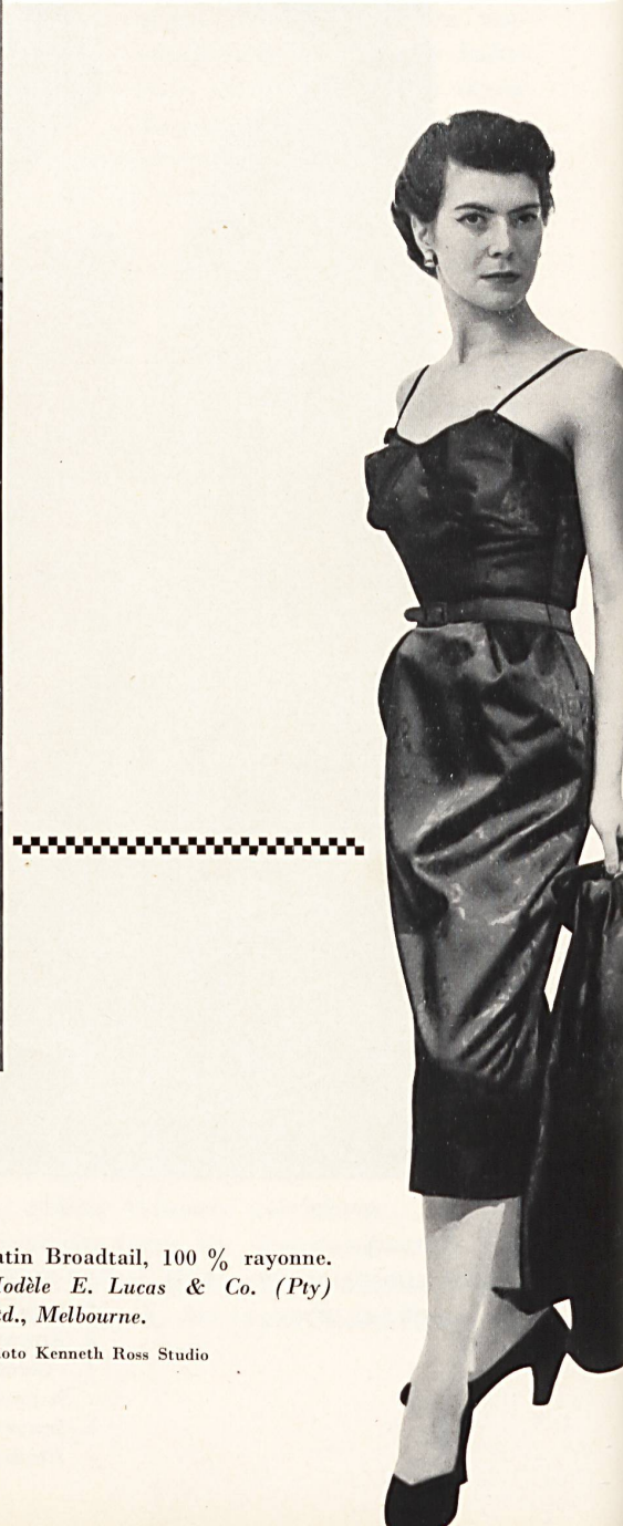
Satin Broadtail, 100 % rayonne. Modèle E. Lucas & Co. (Pty) Ltd., Melbourne.