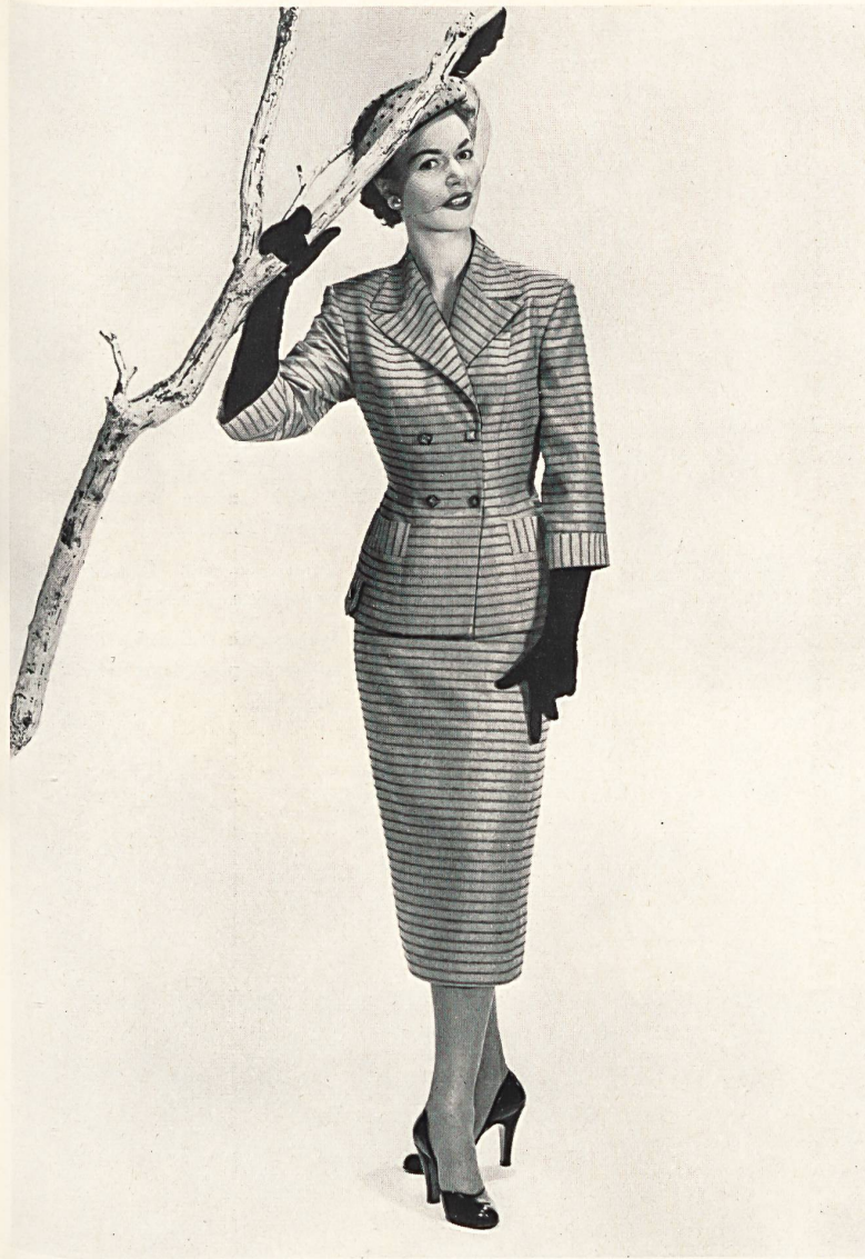
Fresco barré, rayonne et fibranne. Modèle Hellas Mfg. Co. (Pty) Ltd., Cape Town.