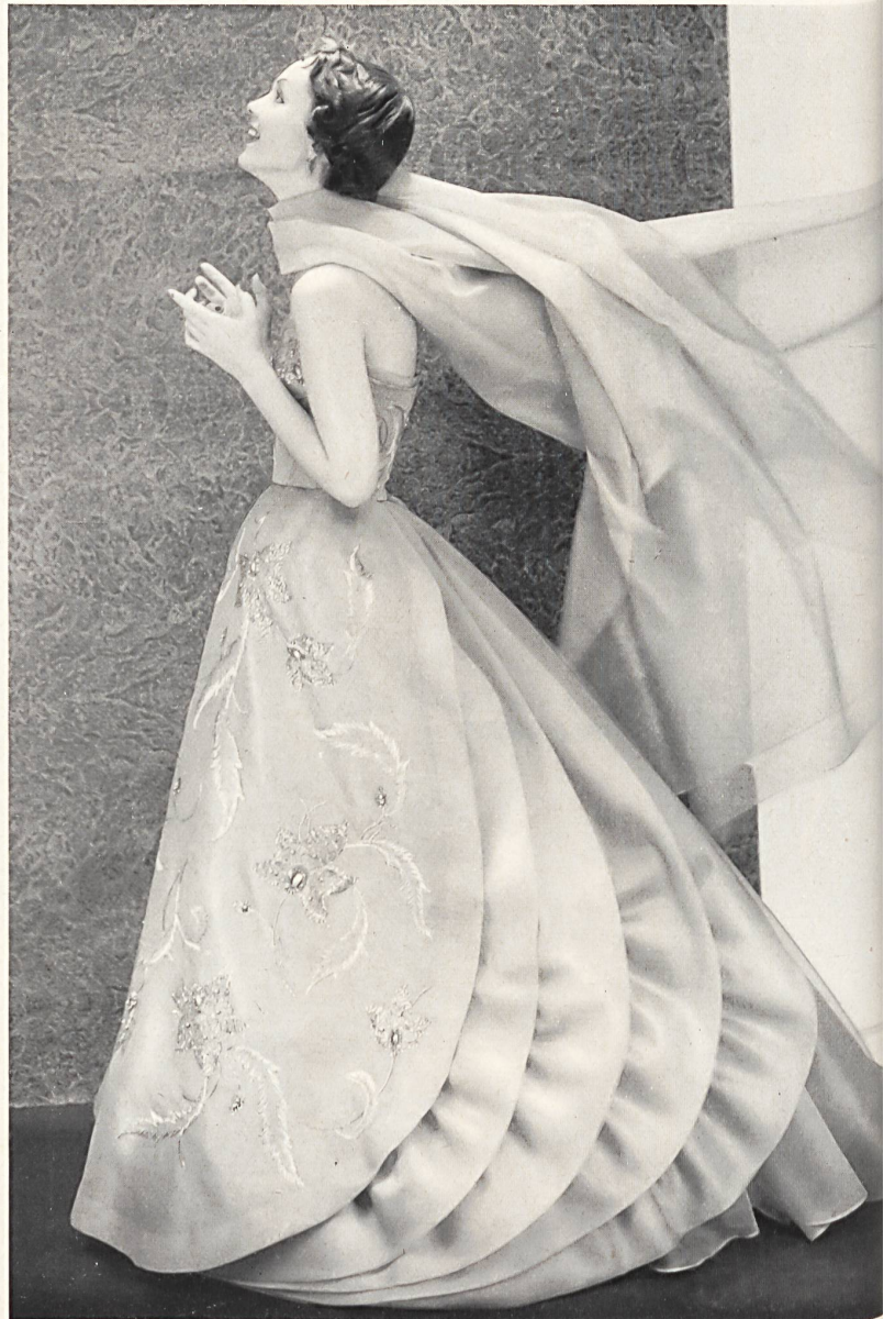
Organza pure soie. Modèle Marty & Cie, Zurich.