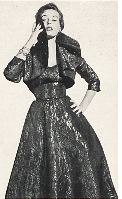
Matelassé façonné lamé. Modèle Hartnell Garment Co., Melbourne.