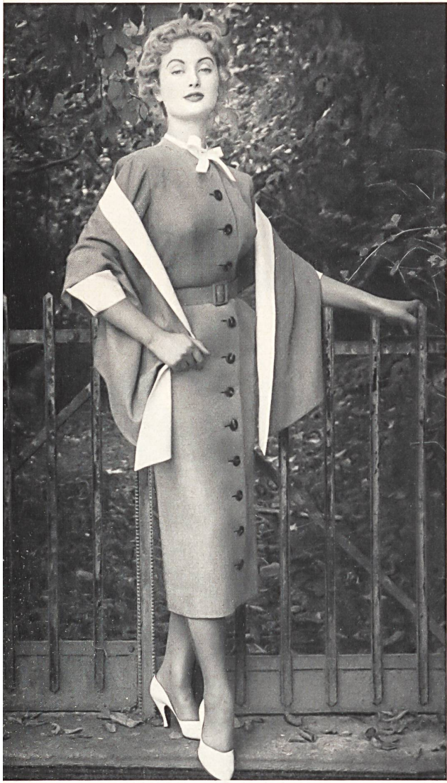
Tweed Belrobe fibranne. Modèle R. Cafader & Cie, Zurich.