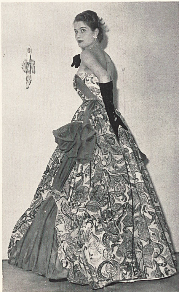
Taffetas shantung, soie naturelle. Modèle Sartoria Moco, Milan.