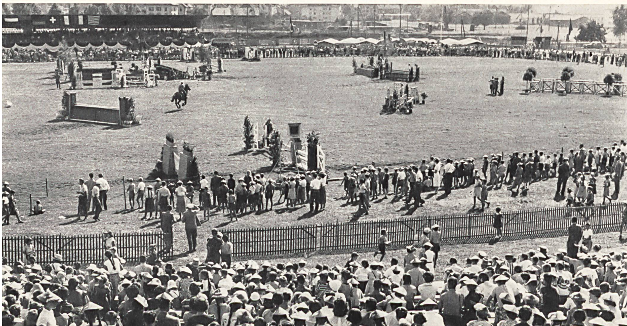
Sportbetrieb auf dem Breitfeld (St. Gallen).