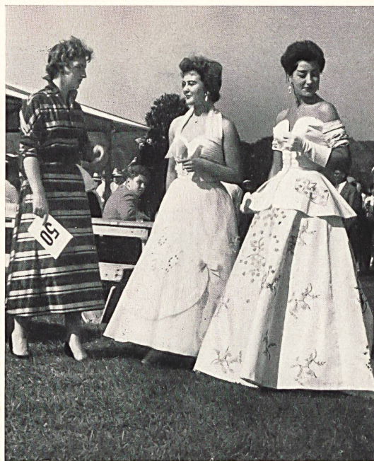
Einige Mannequins der Sankt Galler Textil- und Bekleidungsindustrien.