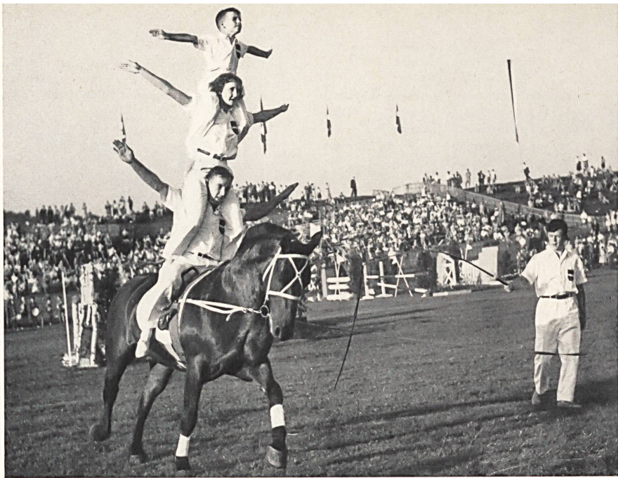
Voltigevorführung der Elgger Jugend.