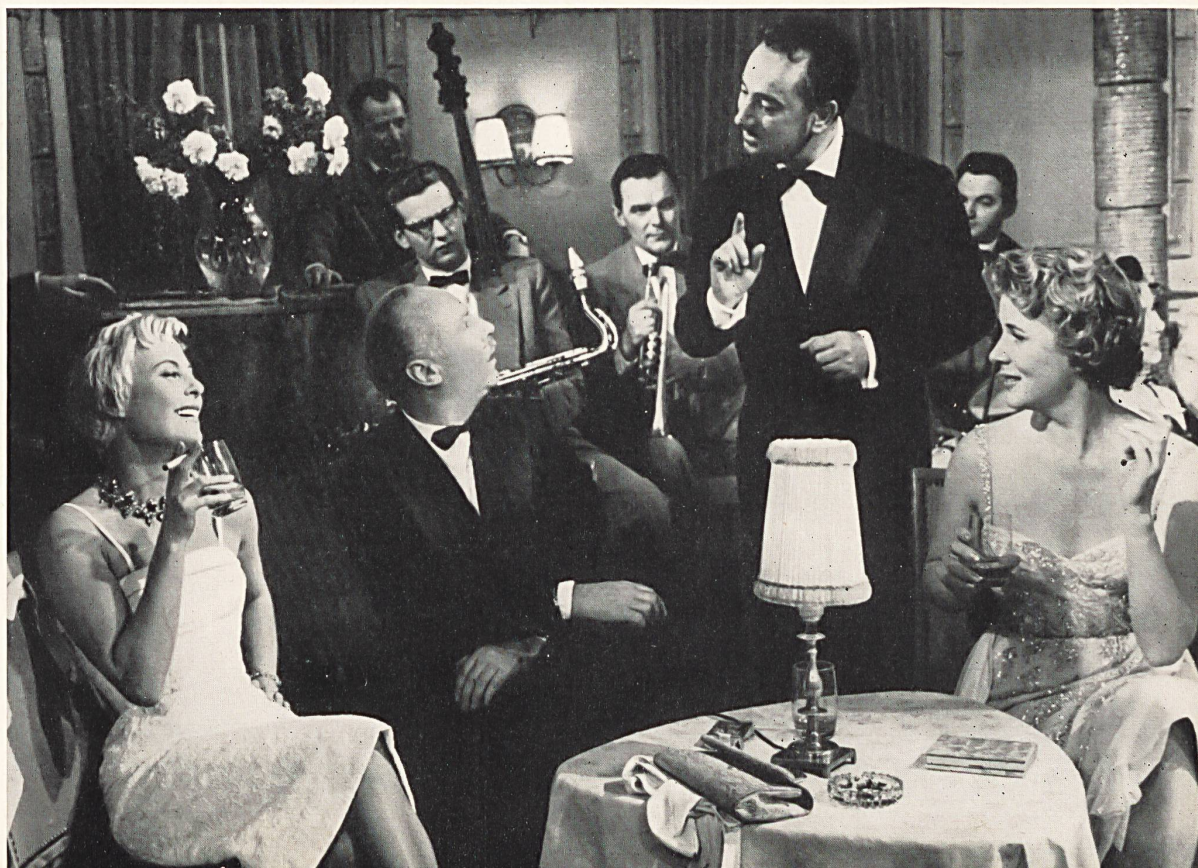
Michèle Morgan porte une robe de Hubert de Givenchy en toile brodée. Tissu de Rudolf Brauchbar & Cie, Zurich; distribué par Montex, Paris. Scène tirée du film « Oasis » en cinémascope, de Yves Allégret, avec Michèle Morgan (à gauche) et Pierre Brasseur (au centre).

— Darf ich Ihnen dann vielleicht sagen, dass Mallarmé seinerzeit Modeberichte verfasste und zwar in einer voll-