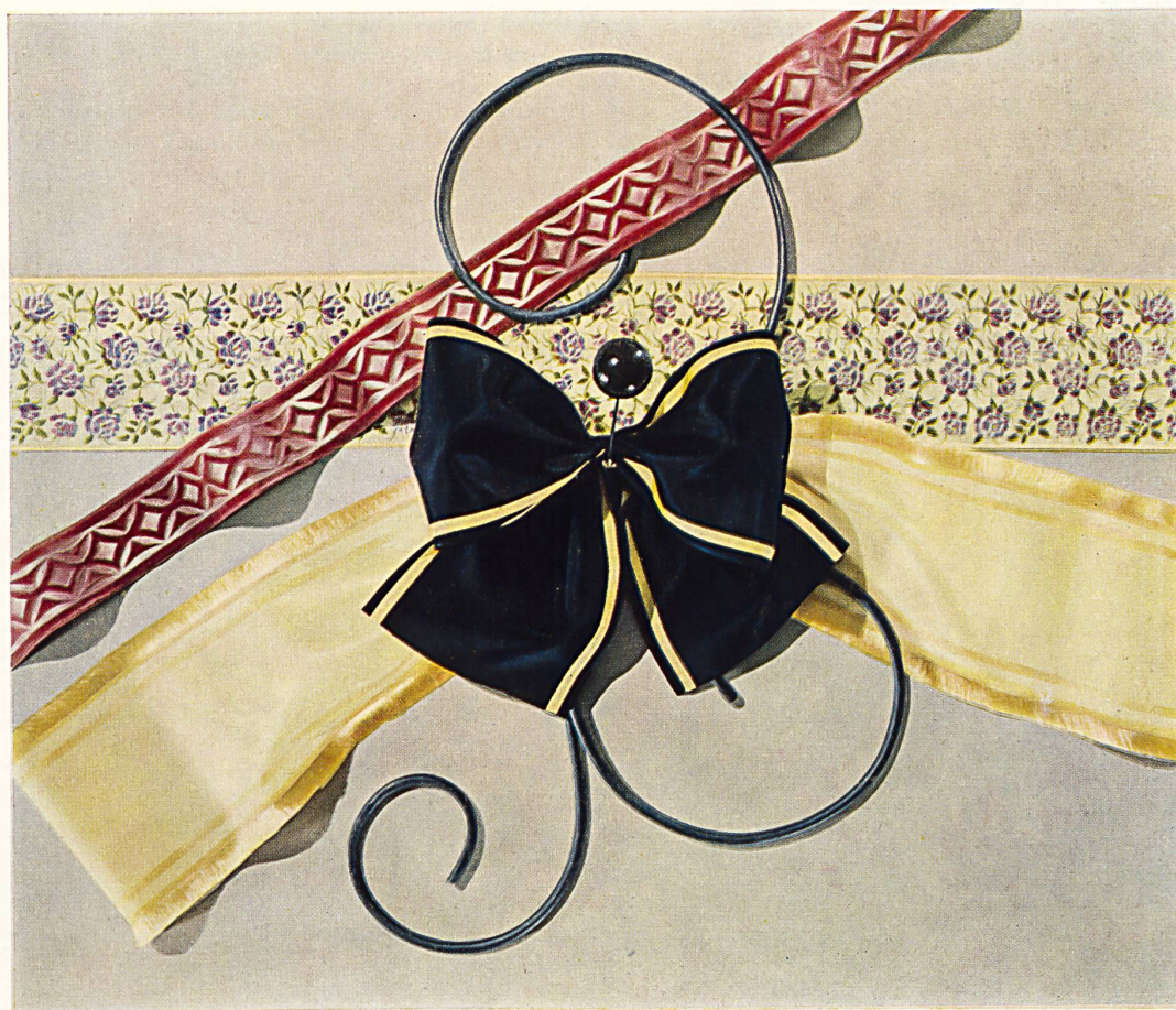
Moderne Basler Bänder in verschiedenartiger Ausführung.