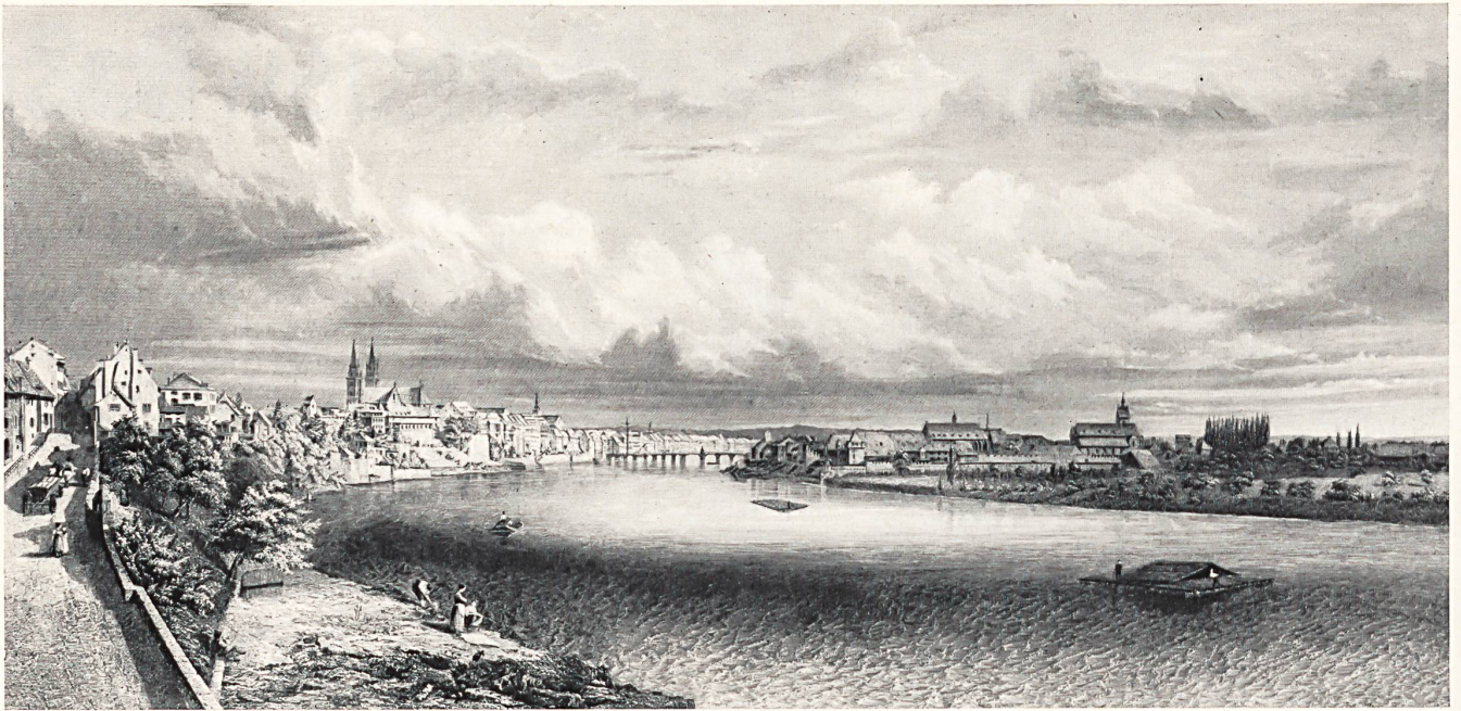
Basel vor einem Jahrhundert (nach einem zeitgenössischen Stich).