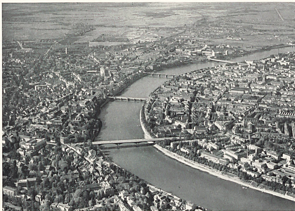
Basel, vom Flugzeug aus gesehen. Links, zwischen den zwei ersten Brücken, die Altstadt.