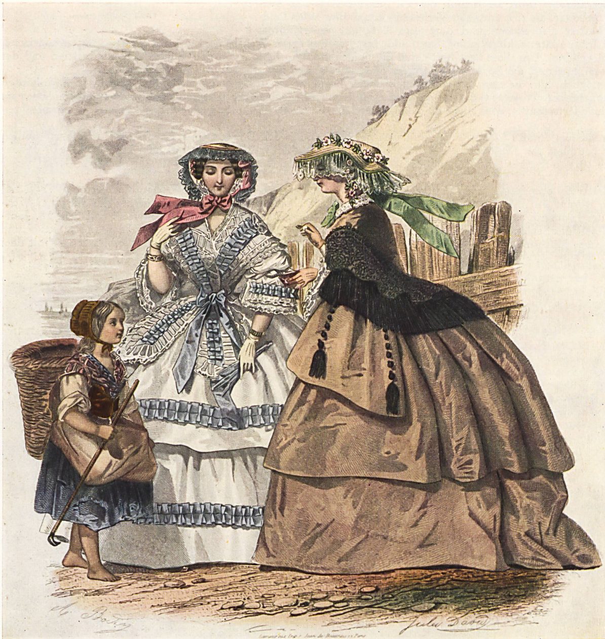
Das Band als weiblicher Putz vor einem Jahrhundert (nach zeitgenössischen Radierungen).

Wir können hier nicht auf die Einzelheiten der industriellen Struktur in dieser Branche eintreten. Die Einführung des Antriebes der Webstühle durch individuelle Elektromotoren hat eine Dezentralisation ermöglicht. Die gegenwärtige Tendenz erstrebt die Einrichtung kleiner, dezentralisierter Fabriken, die sehr rationell arbeiten und über moderne Maschinen sowie spezialisierte Arbeitskräfte verfügen. Die Fabrikation beschränkt sich fast ausschliesslich auf die Kantone Baselland und Aargau, doch haben alle bedeutenden Firmen ihre Bureaux in Basel. Die Fabrikanten haben die schwere Aufgabe, eine Produktion zu leiten, welche sich unaufhörlich und entsprechend der Entwicklung der Mode sowie der Verbraucher-