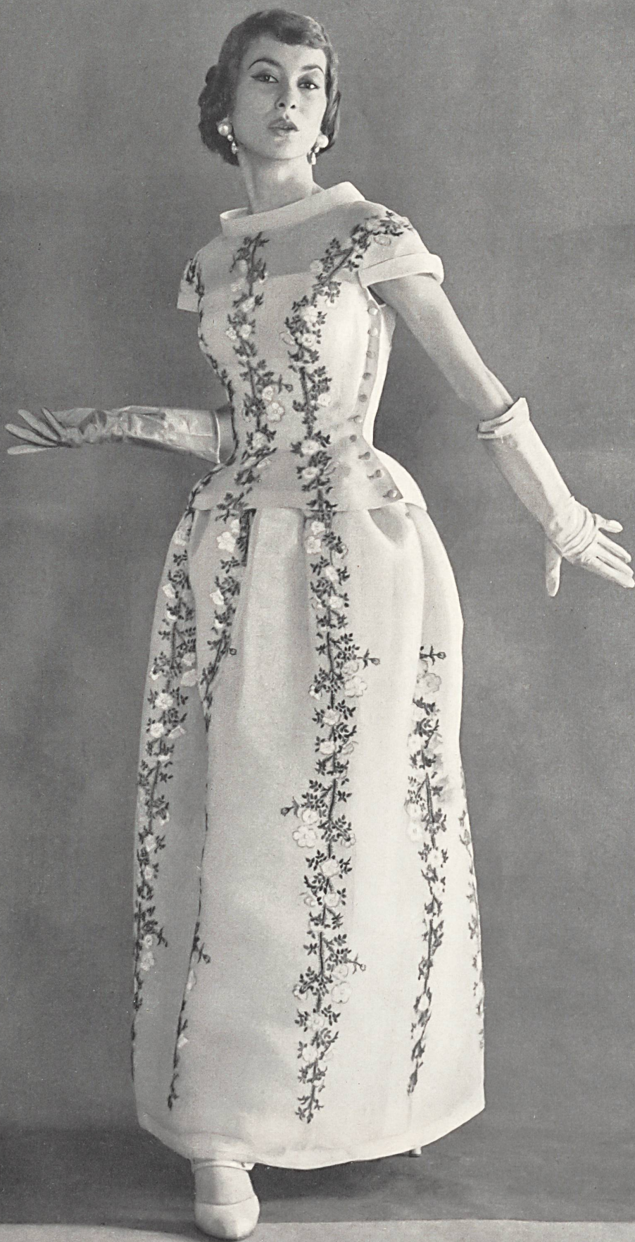
HUBERT DE GIVENCHY Organdi brodé couleurs de A. Naef & Co., Flawil Placé par Inamo, Zurich