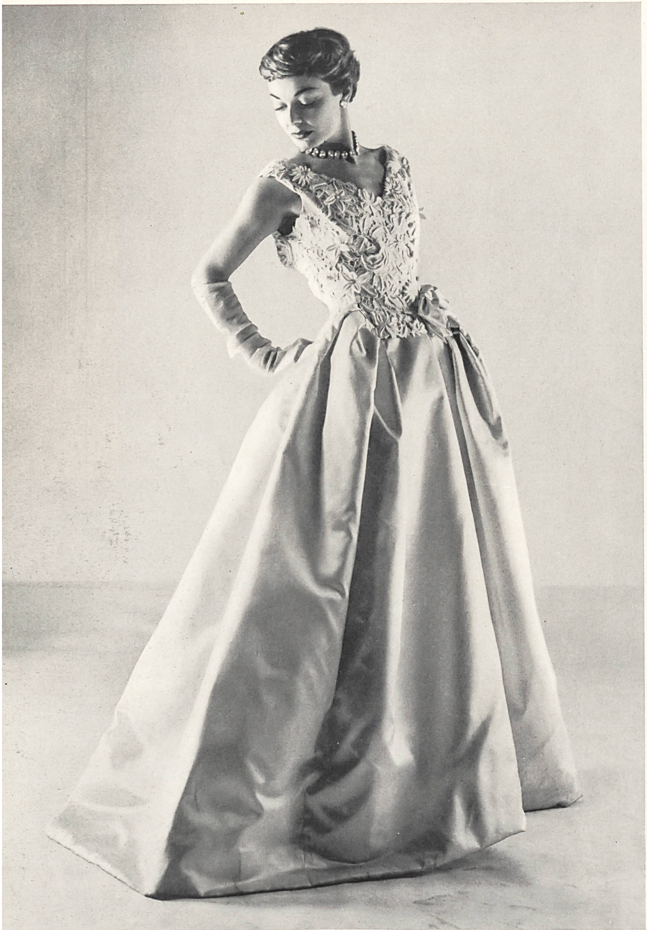
JEAN PATOU Guipure de coton riche de Forster Willi & Co., Saint-Gall Placé par Inamo, Zurich