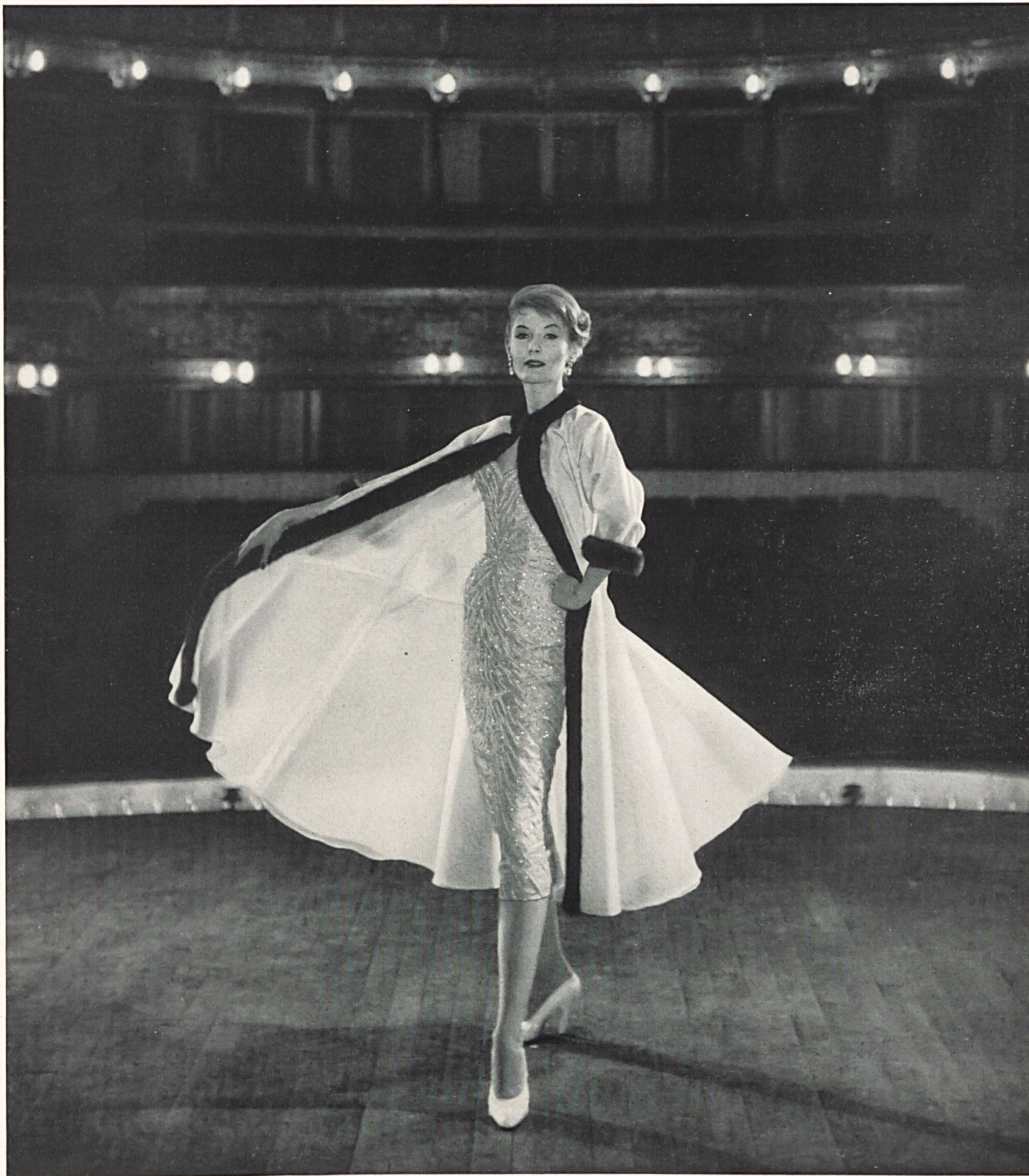
JEAN DESSES Basma de L. Abraham & Cie, Soieries S.A., Zurich