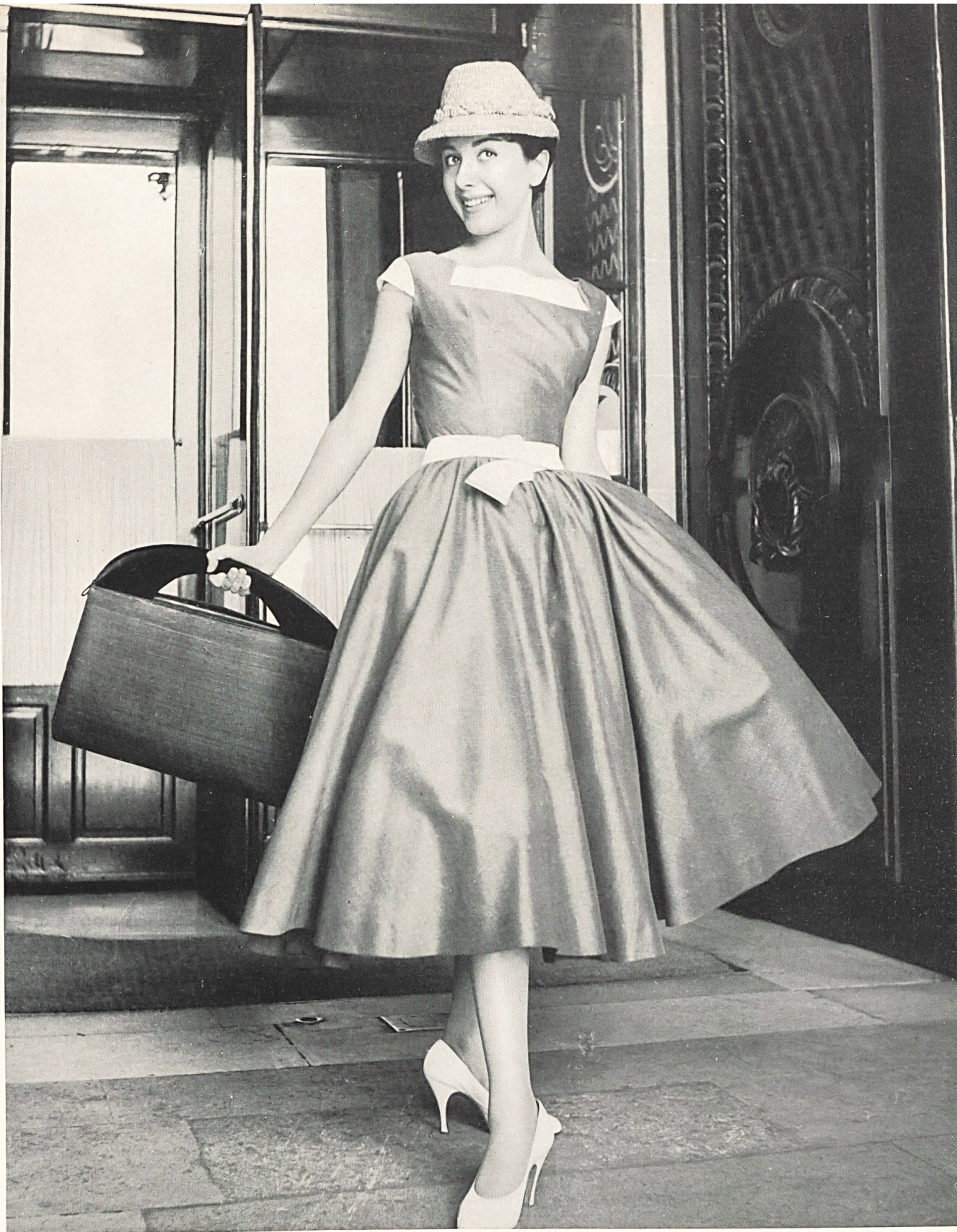
JEANNE LANVIN / CASTILLO Fil à fil marron, soie et coton, de la S. A. Stünzi Fils, Horgen