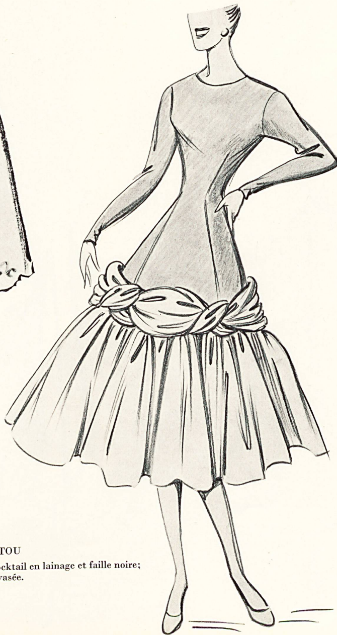
JEAN PATOU Robe de cocktail en lainage et faille noire; ampleur évasée.