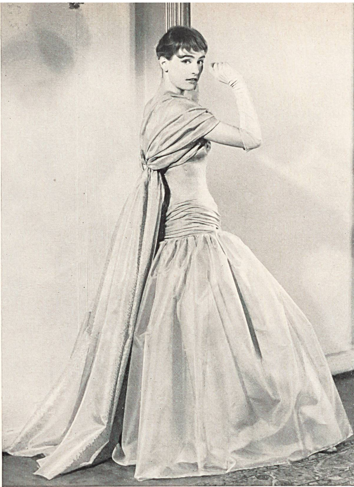
Frederick Starke Ltd., London Pure silk organza by L. Abraham & Co., Silks Ltd., Zurich