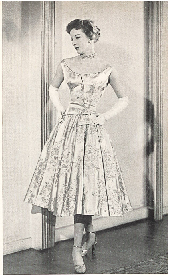
Frederick Starke Ltd., London Woven rayon by L. Abraham & Co., Silks Ltd., Zurich