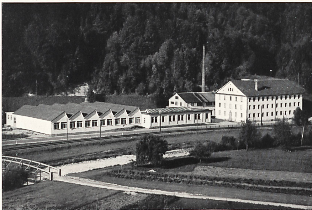
Weberei der Fa. J. G. Nef & Co. A.-G. in Bauma.