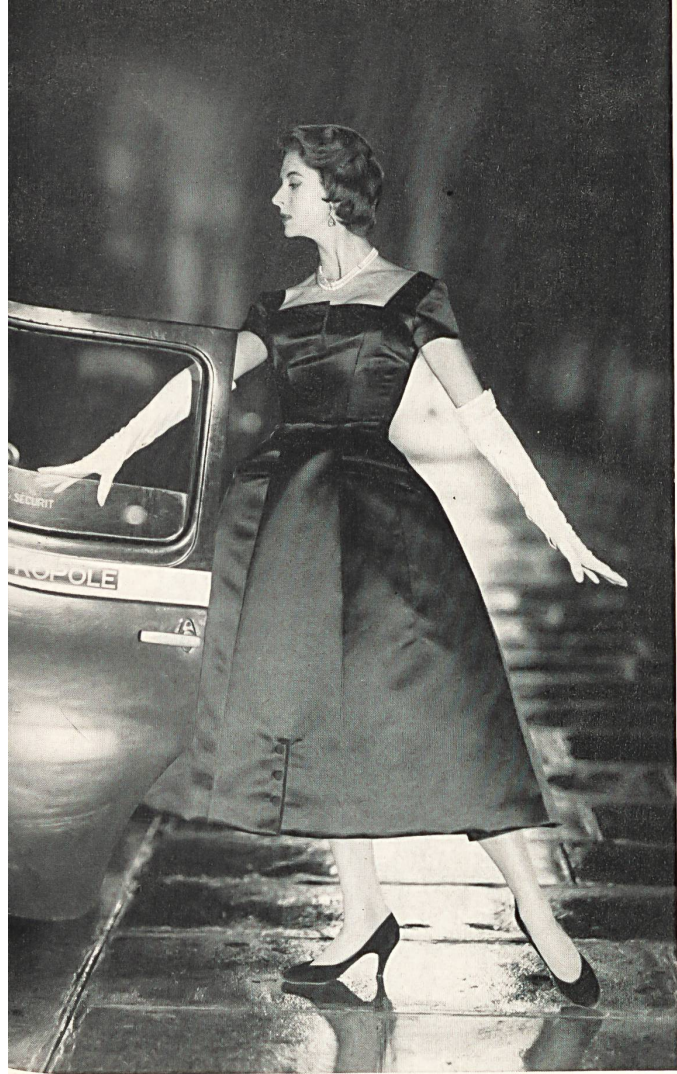
PIERRE BALMAIN Satin cuir de L. Abraham & Cie, Soieries S.A., Zurich