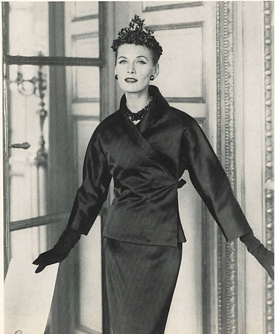
CHRISTIAN DIOR Satin double-face de L. Abraham & Cie, Soieries S.A., Zurich