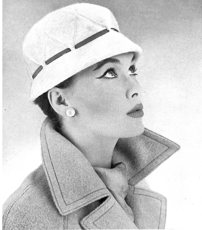
Cloche de mélusine avec ruban gros-grain et piqûres. Modèle suisse.

Melusine cloche with grosgrain ribbon and stitching. Swiss model.