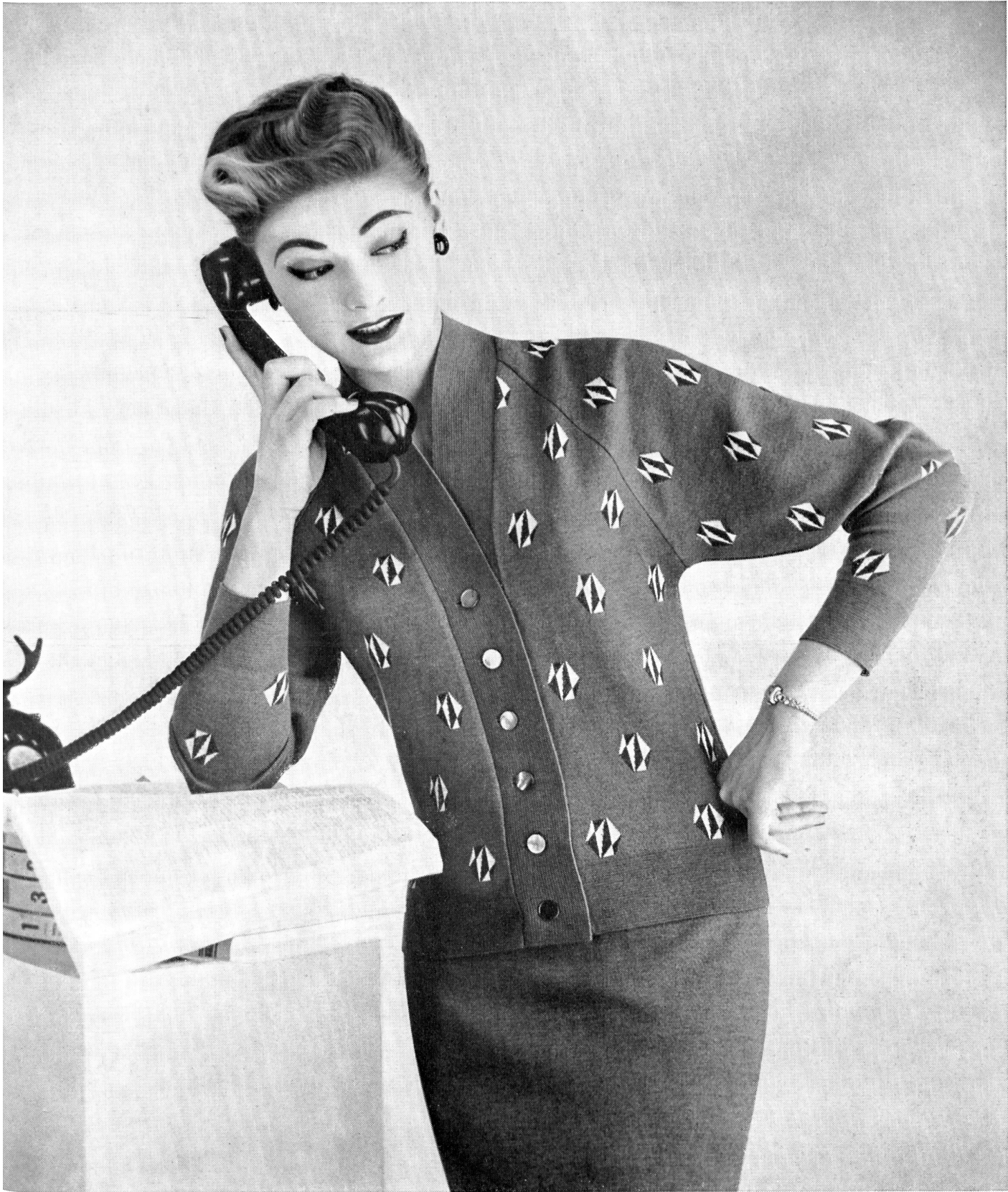
« Funkelnde Edelsteine » : so nämlich mutet uns das originelle Jacquard-Motiv an. Dazu der Jupe in der genau gleichen Farbe - als Ganzes : Der ideale - für jede Gelegenheit passende - Ferien-Begleiter. - Modell ALPINIT.