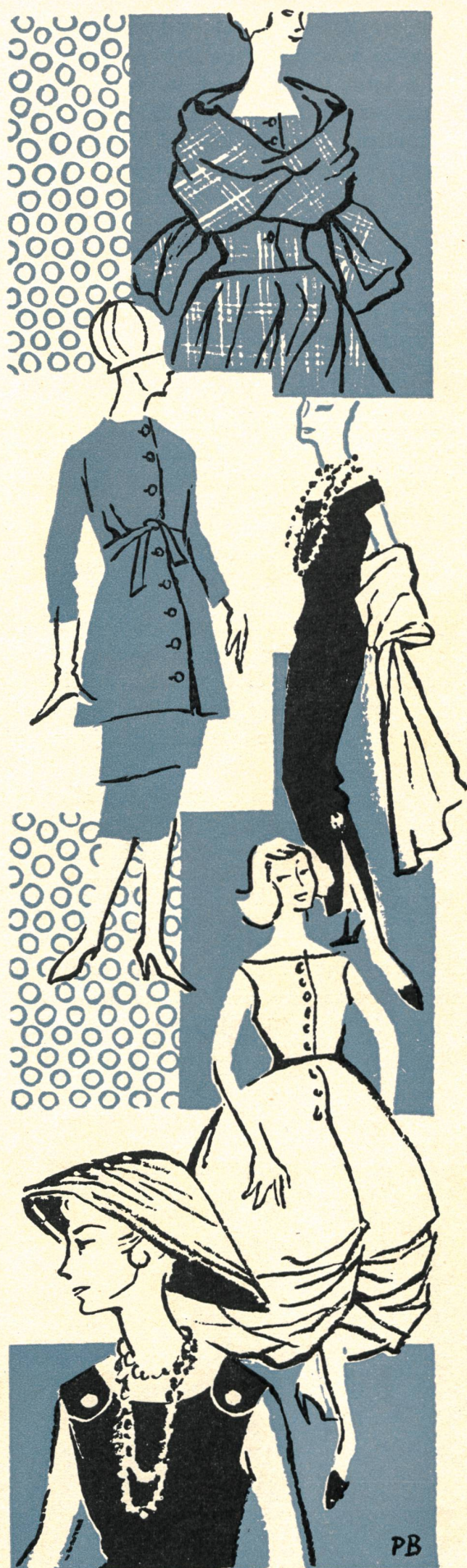
Détails, de haut en bas — Carven: deux-pièces Prince de Galles avec écharpe de même tissu ; Jacques Heim : deux-pièces en lainage beige ; Christian Dior : robe du soir en crêpe, demi longueur, fendue et retenue par un bijou aux genoux, écharpe de même tissu ; Guy Laroche : robe bulle en mousseline imprimée retenue devant ; Christian Dior : robe de cocktail.

Aber wenn wir mit diesen äusserlichen Kritiken die instinktive Reaktion vor dem Ungewohnten überwunden haben, entdecken wir mit Begeisterung eine Menge Schönes, wovon ich das eine oder andere herausgreife.