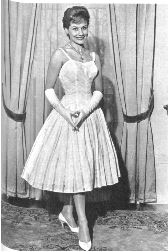
3 «RECO», REICHENBACH & CO., SAINT-GALL Tissu «Recoflora» Modèle : Delapierre, Nice Montex, Paris