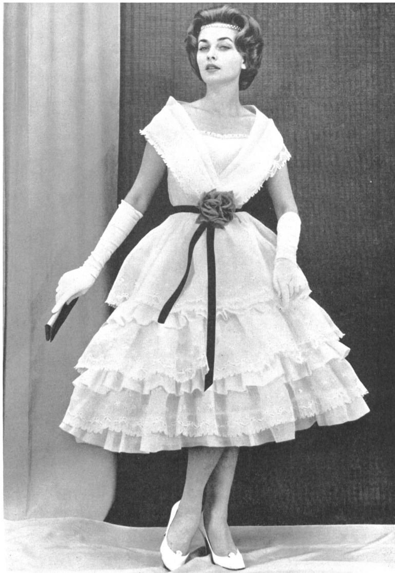
1 «RECO», REICHENBACH & CO., SAINT-GALL Organdi blanc brodé Modèle : Manuela, Nice Montex, Paris