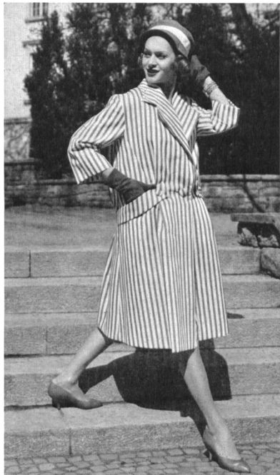
Élégant ensemble d'après-midi en satin de coton. Smart afternoon ensemble in cotton satin. Elegante traje de tarde de satén de algodón. Elegantes Nachmittagsensemble aus Baumwollsatén.