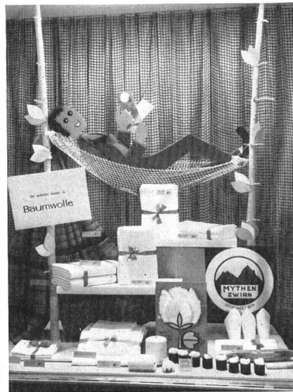
1 er prix, « amateurs ». 1 st prize, « amateurs ». 1 er premio, « no profesionales ». 1. Preis « Amateure ».