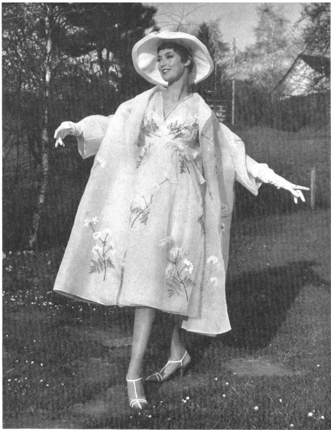
Ensemble de cocktail en organdi brodé. Embroidered organdy two-piece cocktail ensemble. Traje de dos piezas para coctel de organdi bordado. Cocktail Ensemble aus besticktem Organdy.

Dieser Vorführung ging am gleichen Tage eine Modeschau im Schloss Lenzburg voraus, die im Rahmen eines kalten Buffets für die Presse organisiert worden war.