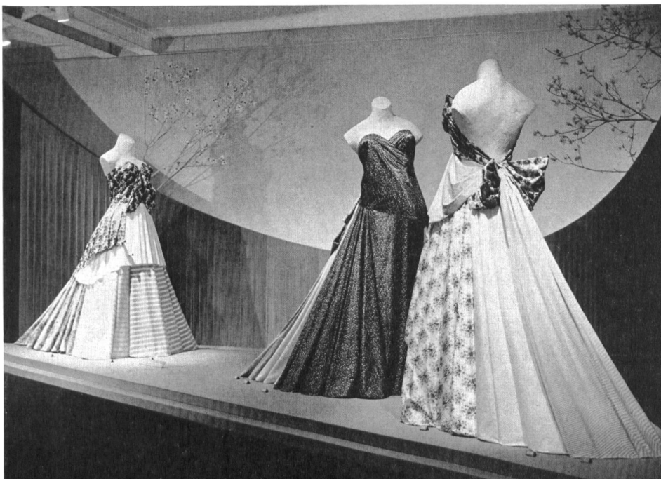
Exposition de l'industrie suisse du coton : tissus tissés en couleurs et imprimés. Display of the Swiss cotton industry : colour woven and printed fabrics. Exposición de la industria aldonera suiza : tejidos en colores y estampados. Ausstellung der Schweiz. Baumwollindustrie : Buntgewebe und Druckstoffe.