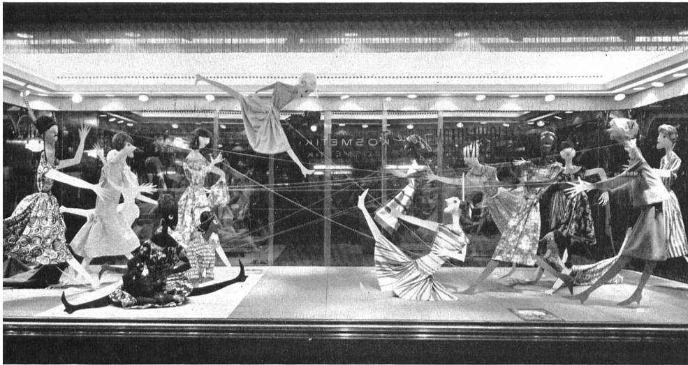
1 er prix cat. décorateurs professionnels. 1 st prize, professional decorators' category. 1 er premio, categoría de decoradores profesionales. 1. Preis, Kategorie Berufs-Dekorateur.