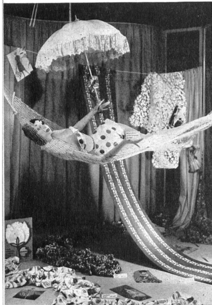
7 o prix, cat. décorateurs amateurs. 7 th prize, amateur decorators' category. 7 o premio, cat. de decoradores no profesionales. 7. Preis, Kategorie Amateure.

Die Publizitätsstelle der Schweizerischen Baumwoll- und Stickerei-Industrie in Sankt Gallen hat vom 3. bis zum 10. Mai dieses Jahres die « Erste Nationale Baumwollwoche » veranstaltet. Es ging darum, für die Baumwolle und Baumwollgewebe in allen Volksschichten zu werben; auch der Detailhandel beteiligte sich daran. Ein Schaufensterwettbewerb wurde organisiert, an dem Berufsdekorateure, sowie Amateure mitwirkten. Wir geben hier einige von den preisgekrönten Leistungen der beiden Kategorien wieder.