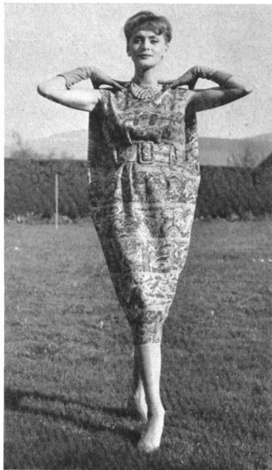
Robe d'après-midi en tissu jacquard lamé et imprimé. Afternoon dress in jacquard fabric, printed and with metallic threads. Vestido de tarde de tejido jacquard con estampación y efectos de hilos metálicos. Nachmittagskleid aus Jacquardgewebe mit Laméfäden und bedruckt.