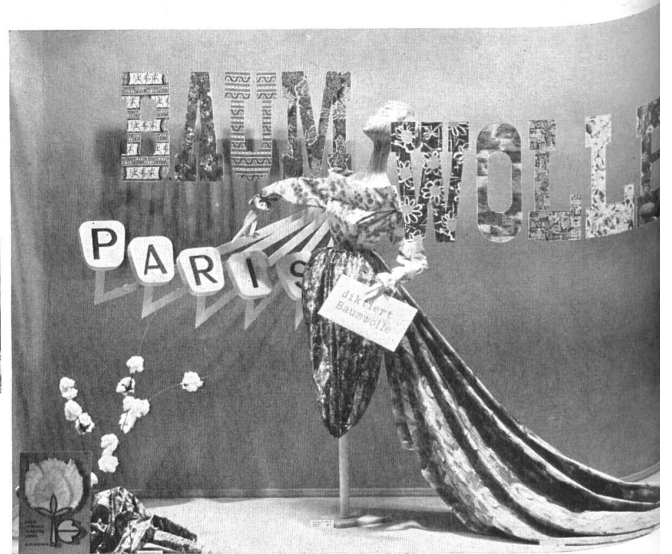
2 o prix, « professionnels ». 2 nd prize, « professional ». 2 o premio, « profesionales ». 2. Preis, « Berufsdekorateur ».