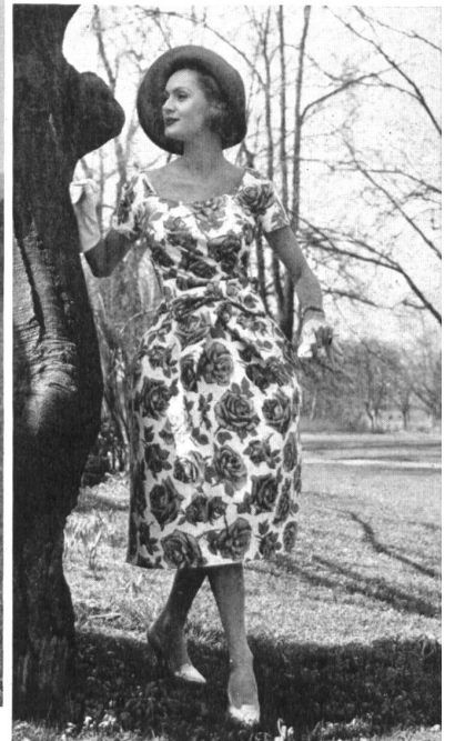
Robe de cocktail en piqué imprimé main. Hand printed piqué cocktail dress. Vestido de coctel de piqué estampado a mano. Cocktailkleid aus Baumwollpiqué mit Handdruck.