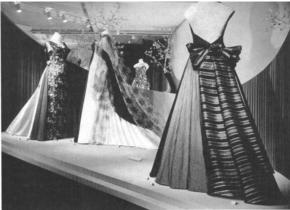
Exposition de l'industrie suisse de la soierie : pure soie, tulle, nylon. Display of the Swiss silk industry : pure silk, net, nylon. Exposición de la industria sedería suiza : seda pura, tul, nylon. Ausstellung der Schweiz. Seidenindustrie : reine Seide, Tüll, Nylon.