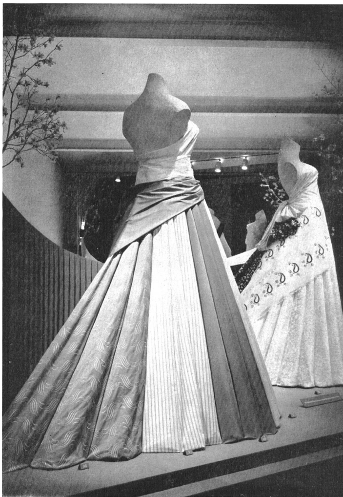
Vue partielle de l'exposition des broderies de Saint-Gall. Part view of the St-Gall embroideries' display. Vista parcial de la exposición de bordados de San Galo. Teilansicht der Sankt-Galler Stickerei-Ausstellung.

Diese stets sehr besuchte Ausstellung zeigte dieses Jahr mehr als hundertfünfzig verschiedenartige Gewebe, sowie vierzehn Vitrinen mit Schuhwerk und verschiedenen Fertigwaren: Stickerei-blusen, bedruckte und bestickte Tüchelchen, Kinderkleidchen, Echarpen, bestickte Galons und Bänder. Sie machte den Veranstaltern grosse Ehre, der Zürcher Seidenindustriengesellschaft, der Publizitätsstelle der Schweizerischen Baumwoll- und Stickerei-Industrie, dem Verband der Wolltuchfabrikanten und Kammgarnwebereien der Schweiz, sowie der Bally Schuhfabriken AG.