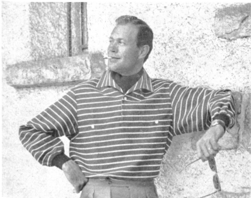
Modèles « Lutteurs », AG. Fehlmann Söhne, Schöftland

letzteren Bezeichnung wollen wir das gewählte Kleidungsstück hervorheben, welches trotz seiner modischen Note, die manchmal sogar an Kühnheit grenzt, das Praktische und Nützliche nicht ausser acht lässt und seine Aufgabe, elegant und tadellos zu kleiden, ganz erfüllt.