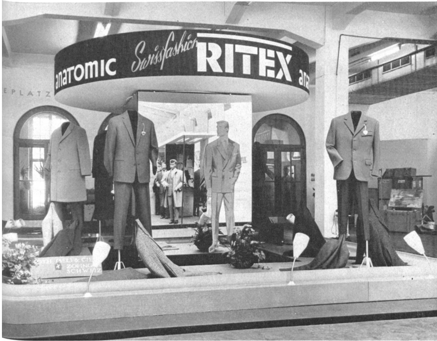
Le stand « Ritex », Roth, Iseli & Cie, Zofingue

letzteren Bezeichnung wollen wir das gewählte Kleidungsstück hervorheben, welches trotz seiner modischen Note, die manchmal sogar an Kühnheit grenzt, das Praktische und Nützliche nicht ausser acht lässt und seine Aufgabe, elegant und tadellos zu kleiden, ganz erfüllt.