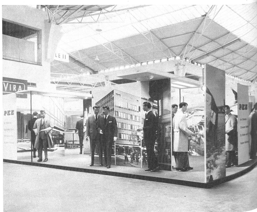
Le stand «PKZ», Burger-Kehl & C o, AG, Zurich.