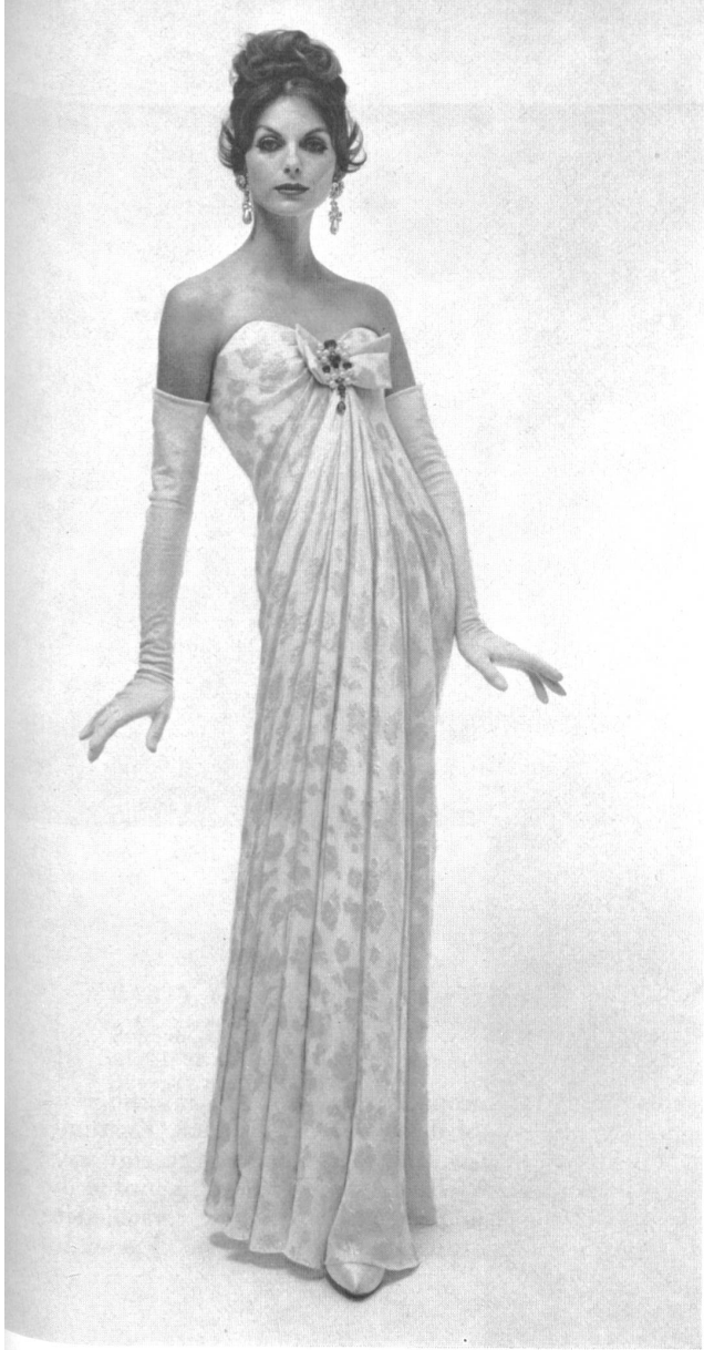
L. ABRAHAM & CO. SILKS LTD., ZURICH

Robe du soir en Basra broché. Brocaded Basra evening gown. Model by Count Sarmi for Elisabeth Arden.