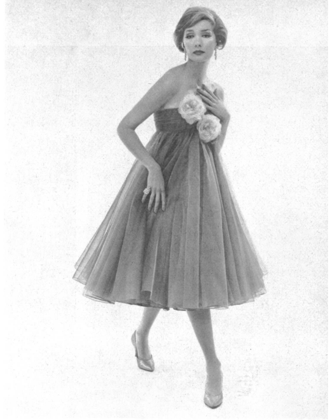
L. ABRAHAM & CO. SILKS LTD., ZURICH

Robe du soir en Basra broché. Brocaded Basra evening gown. Model by Count Sarmi for Elisabeth Arden.