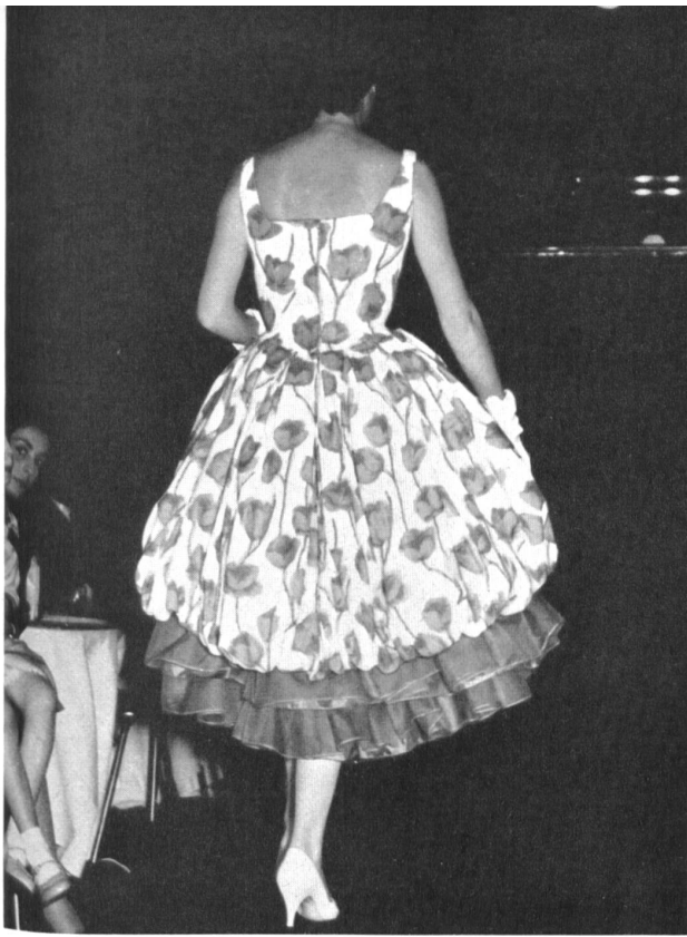
Toile Capri imprimée/Printed Toile Capri. (Cotton - viscose.)