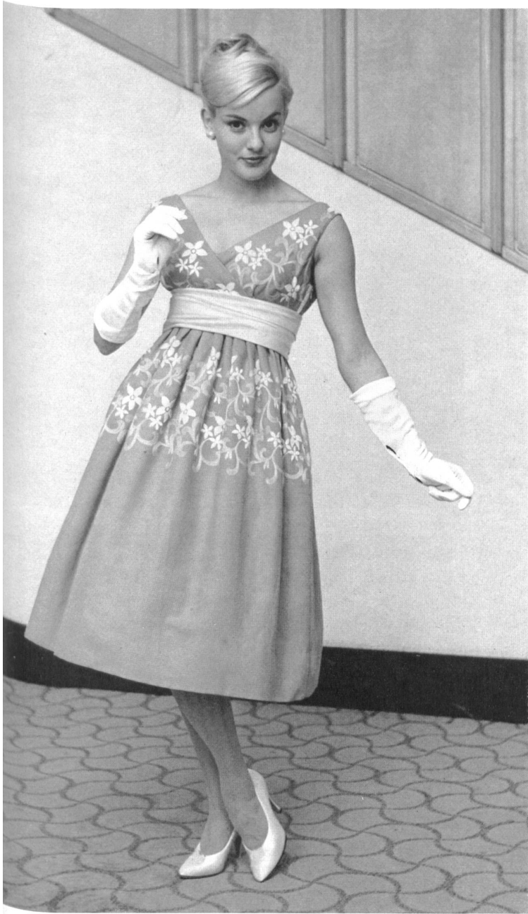
JACOB ROHNER S. A., REBSTEIN

Natté coton brodé. Embroidered basket-weave cotton.