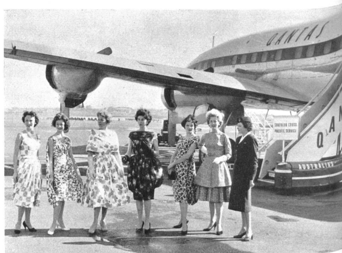
Arrivée des mannequins à Sydney. Arrival of the mannequins in Sydney.

Im August dieses Jahres wurde in den Städten Sydney und Melbourne ein Modedéfilé grossen Ausmasses abgehalten. Nach der Revue « Australian Fashion News » handelte es sich dabei um « das grösste Ereignis des Jahres auf dem Gebiete der Mode ». Auf Veranlassung eines australischen Gewebeamporteurs hatten über fünfzig der besten australischen Fabrikanten der Damenbekleidungsindustrie Modelle vom besten Geschmack aus europäischen Stoffen geschaffen, wobei insbesondere die Erzeugnisse der