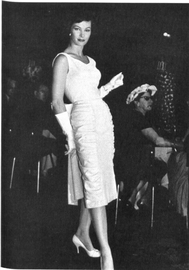
Luxor lamé, façonné ; infroissable. Luxor, crease resisting figured lamé. (Staple fibre - cotton - Lurex.)