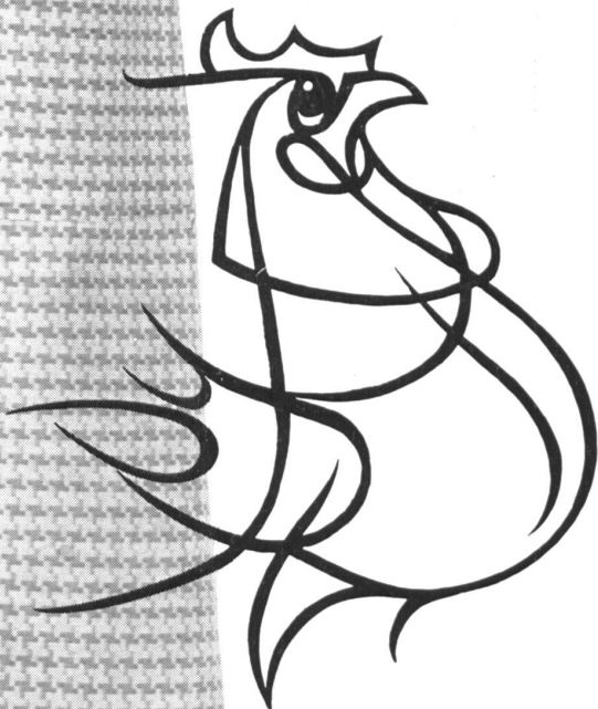
Modell Nr. 425

Während der Export-Woche vom 27.-31. Mai zeigen wir unsere Kollektion in Zurich im Glockenhof, Sihlstrasse 31 Telefon (051) 23 56 60 Bischoff Textil AG St. Gallen