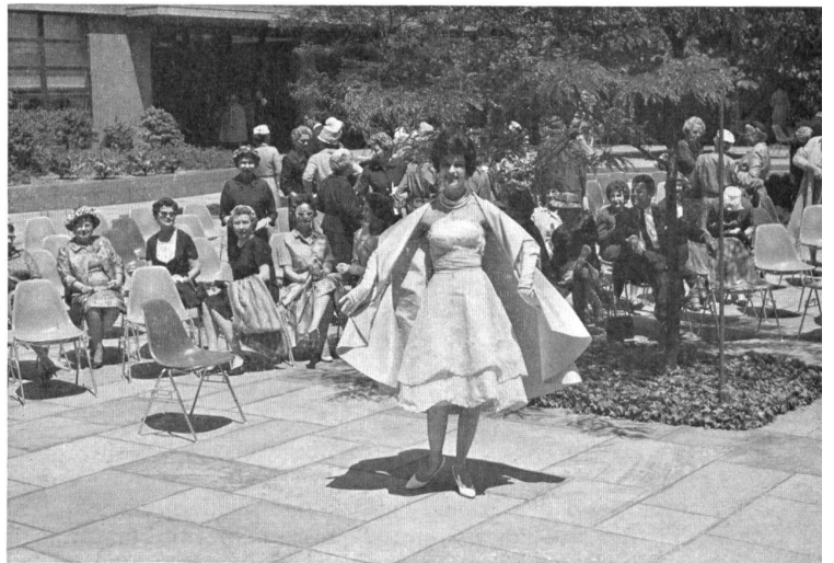
Embroidered organdie Organdi brodé Modèle Pauline Trigère, New York

Das Kleid des kleinen Mädchens geht auch mit der Mode und erinnert in seinen Tendenzen an die «Gibson girls» und die Kleider, welche man anfangs in den Kolonien trug. Gewisse Modelle tragen schon Namen wie «Puritan», «Covered Wagon» u.s.w., die den Einfluss der damaligen Daguerreotyp-Bilder auf die Mode unserer Töchterchen von 1960 deutlich verraten.