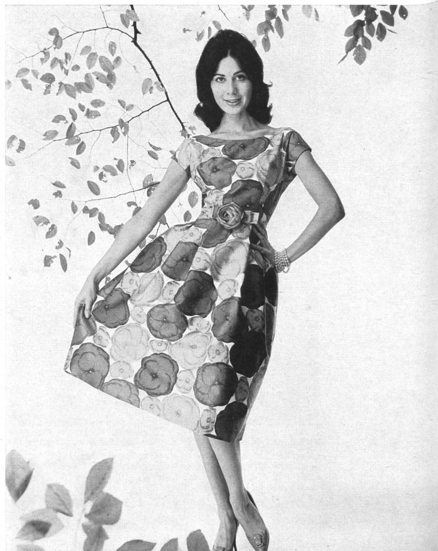
HEER & CIE S. A., THALWIL «Satin Sauvage», coton imprimé Grossiste à Paris: Robert Burg & Cie Modèle Géo Boutet, Paris