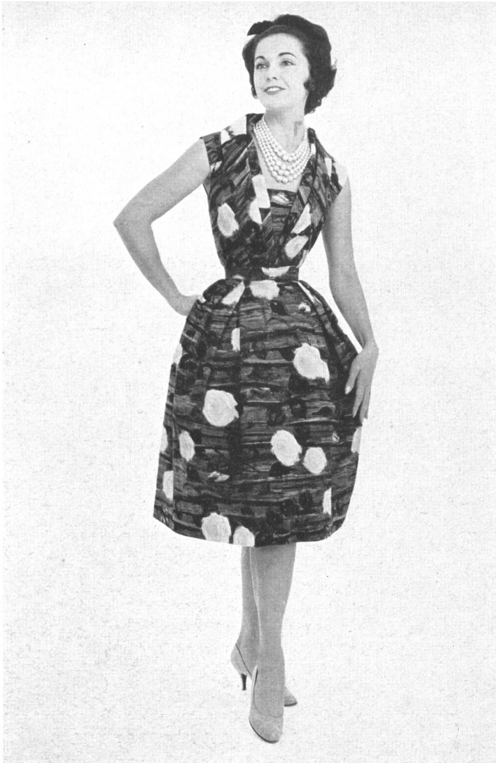
HEER & CIE S. A., THALWIL « Sarabande », coton imprimé Grossiste à Paris: Robert Burg & Cie Modèle Josette, Nice