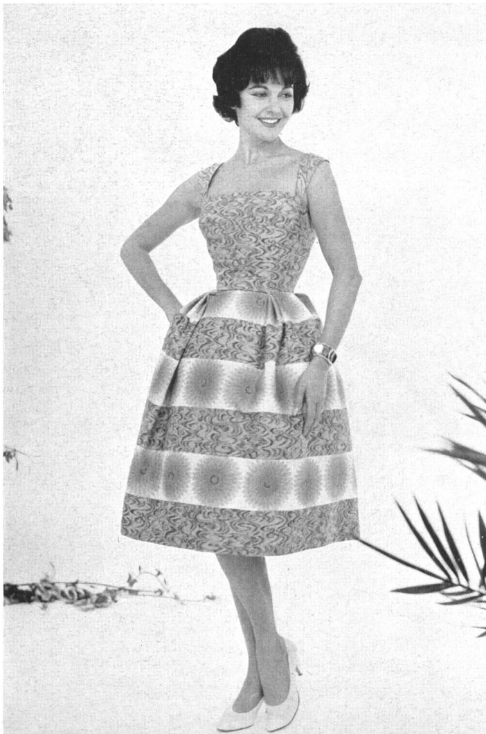
HEER & CIE S. A., THALWIL « Funny Face », coton imprimé Grossiste à Paris: Robert Burg & Cie Modèle Josette, Nice