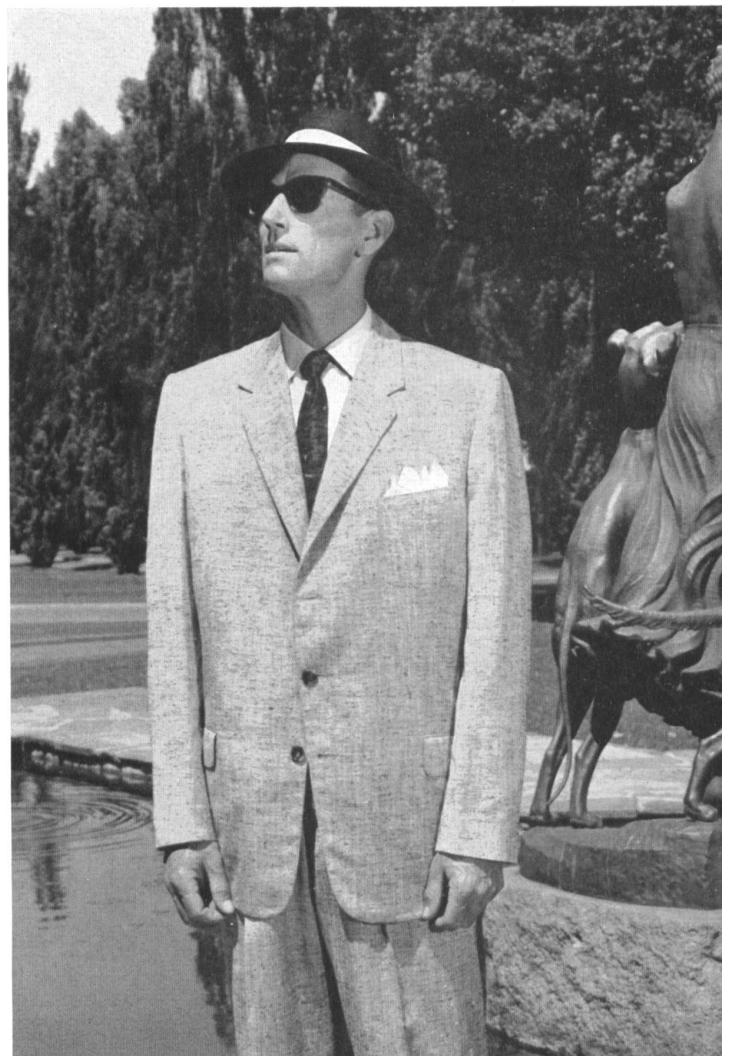
« ZURRER » WEISBROD-ZURRER SÖHNE, HAUSEN a.A. Shantung pure soie / pure silk shantung Modèle Ernest Hiller Pty. Ltd., Sydney