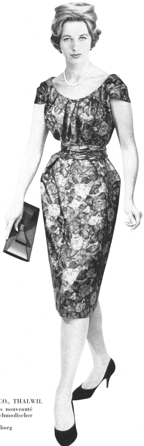
ROBT. SCHWARZENBACH & CO., THALWIL Pure soie, imprimée main, coloris nouveauté Handbedruckte reine Seide in hochmodischer Colorierung Modèle A/B Lena-Modeller, Göteborg