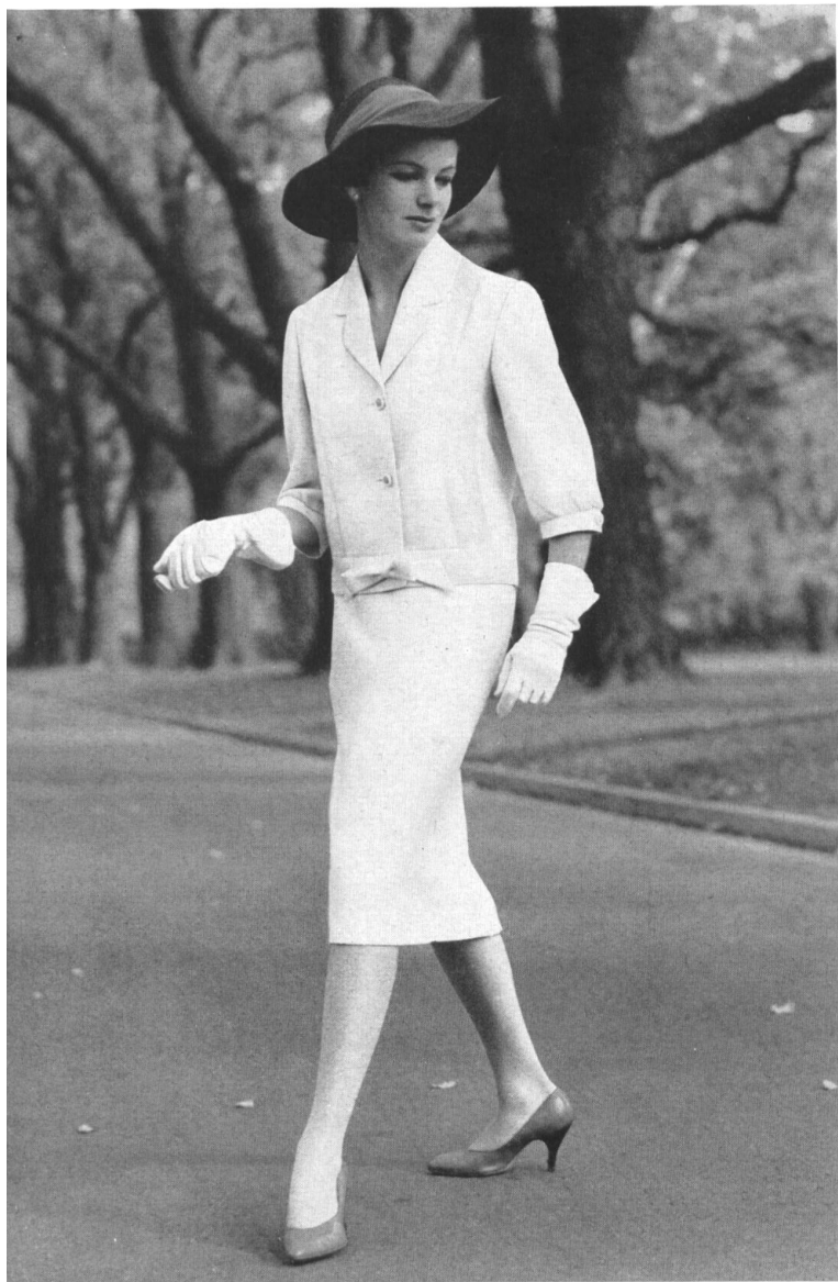
« ZURRER » WEISBROD-ZURRER SÖHNE, HAUSEN a.A. « Nanking » pure fibranne / pure spun rayon Modèle Raymon Manufacturing Co., Melbourne