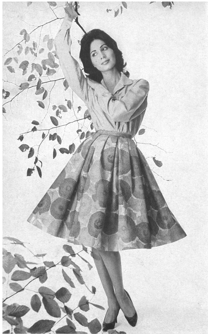
HEER & CIE S. A., THALWIL «Satin Flirt», coton imprimé Grossiste à Paris: Robert Burg & Cie Modèle Péroche, Paris