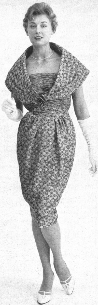
ROBT. SCHWARZENBACH & CO., THALWIL Imprimé pure soie / pure silk printed fabric Modèle Continental Modes, Sydney