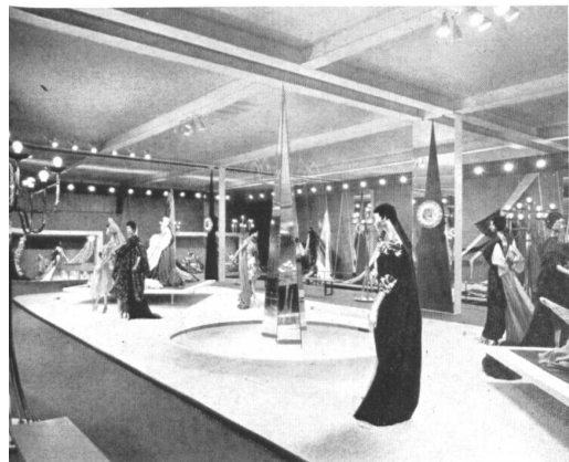
Blick auf die „Création“.

Die Textilien sind auf der Basler Mustermesse immer sehr gut vertreten. Auch dieses Jahr, vom 23. April zum 3. Mai, werden sie an den Veranstaltungen weitgehend beteiligt sein, in der Abteilung der Einzelstände sowie in den Sonderausstellungen, von denen jetzt drei den Textilien gewidmet sind. Denn zu der Halle „Création“ und der Halle „Madame et Monsieur“ kam letztes Jahr ein „Trikotzentrum“, das auch dieses Jahr wieder aufgenommen wird.