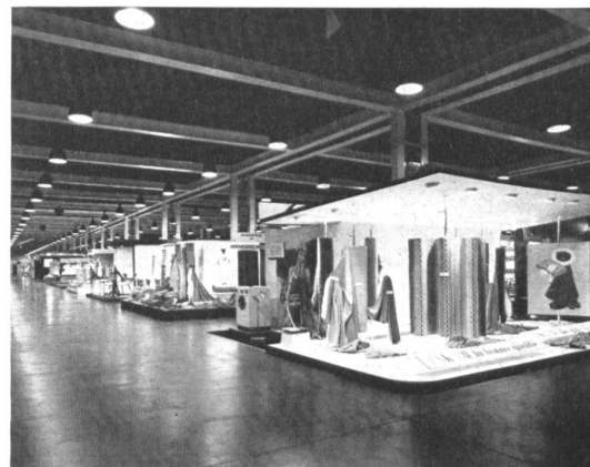
In den Textilhallen.

Der Exportverband der schweizerischen Bekleidungsindustrie hat eine gemeinsame Halle „Madame et Monsieur“, in der Kleidungsstücke für Damen und Herren aus den verschiedensten Geweben sowie Maschenprodukte, Wäsche, Strümpfe, Hüte, u. s. w. ausgestellt werden. Unter dem Titel: „Die Mode, ein Beruf für mich?“ wird dieses Jahr noch besonders auf die verschiedenartigen Berufsmöglichkeiten hingewiesen, um junge Kräfte heranzuziehen. Hier werden die einzelnen Zweige des Modeschaffens in anschaulichen Figurinen-gruppen dargestellt. Die Gestaltung dieser Schau wurde dem zürcher Grafiker Hans Looser übertragen.