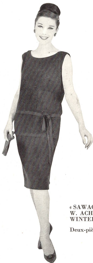
«SAWACO», W. ACHTNICH & CO. S. A., WINTERTHOUR

Deux-pièces très mode en jersey de dralon et Lurex