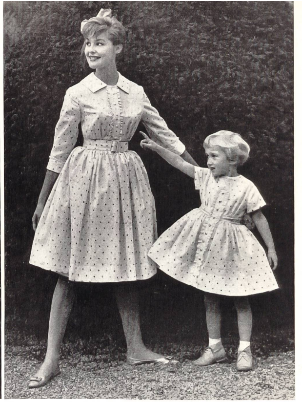
SETARTI S. A., ZURICH

Batiste Minicare brodée en noir. — Black embroidery on Minicare batiste. — Batista Minicare bordado en negro. — Minicare Batist mit schwarzer Stickerei Modèle E. & R. Braunschweig, Zurich