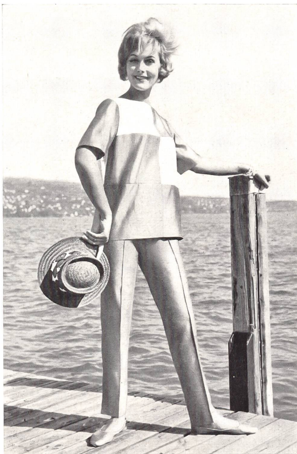
Satin douppion, pure soie.