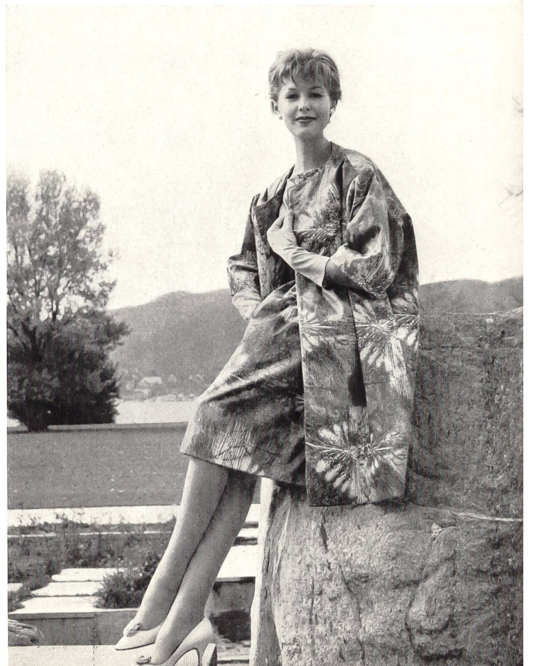
« MINICARE », Joseph Bancroft & Sons Co. A.G., Zurich

Soraya — Tissu imprimé Minicare Printed Minicare fabric Tejido Minicare estampado Minicare Druckstoff Modèle Willy Meyer S. A., Zurich