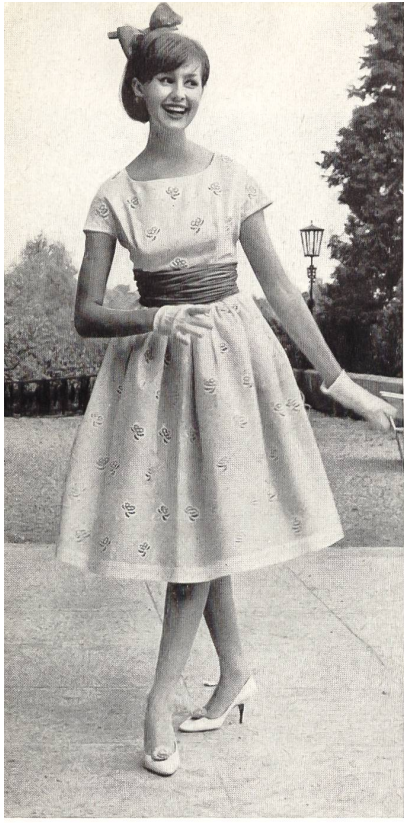
« FISBA », CHRISTIAN FISCHBACHER CO., SAINT-GALL

Tissu Minicare brodé. — Embroidered Minicare fabric. — Tejido bordado Minicare. — Minicare Stickerei Modèle R. Cafader & Co., Zurich