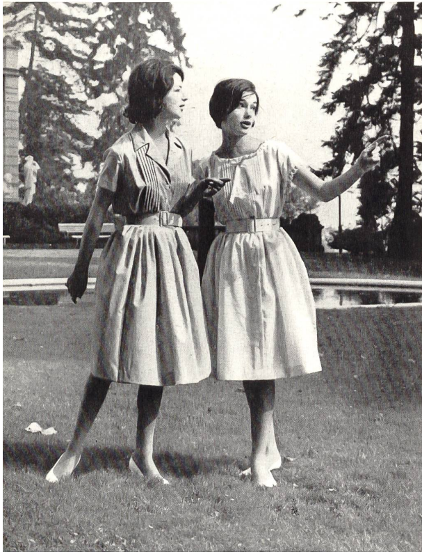
« NELO », J. G. NEF & CO. S. A., HERISAU

Tissu Minicare brodé. — Embroidered Minicare fabric. — Tejido Minicare bordado. — Minicare Stickerei Modèles E. & R. Braunschweig & Co., Zurich