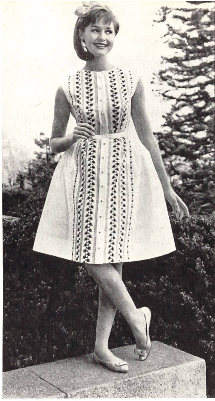
JACOB ROHNER S. A., REBSTEIN

Tissu Minicare brodé. — Embroidered Minicare fabric. — Tejido bordado Minicare. — Minicare Stickerei Modèle R. Cafader & Co., Zurich