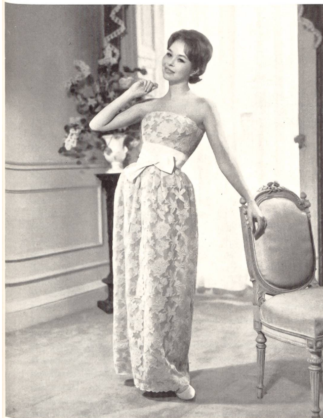
Broderie lin sur tulle Linen embroidered tulle Modèle Ronald Paterson, Londres