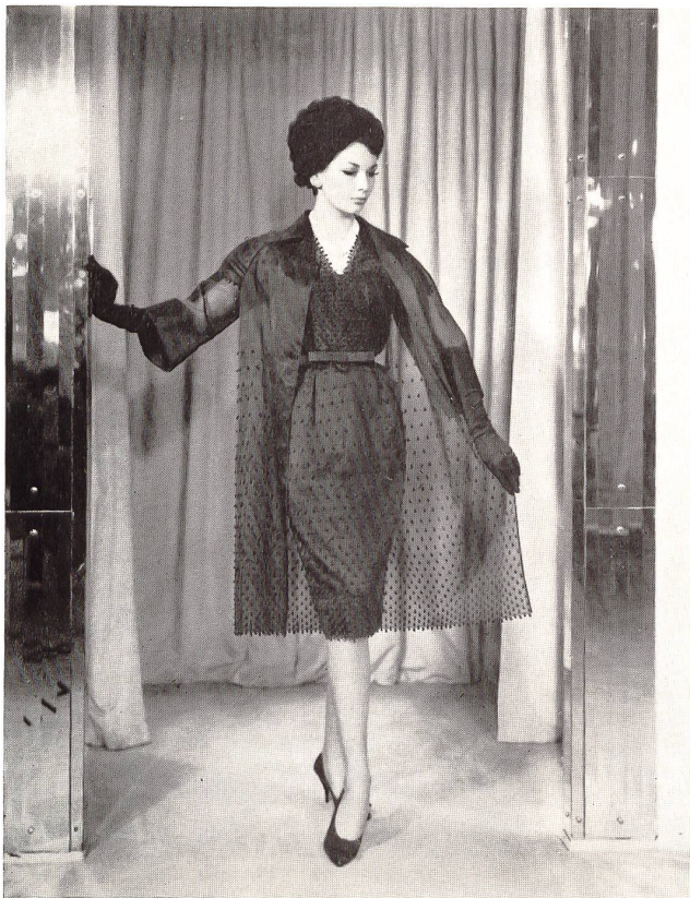
Organdi de soie bleu marine brodé de pois en relief Navy blue silk organdie with embroidered raised spots Modèle Norman Hartnell, Londres