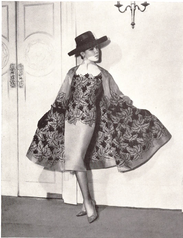
Organdi de soie café avec broderie de soie noire à jour Coffee silk organdie with openwork black silk embroidery Modèle Lachasse, Londres