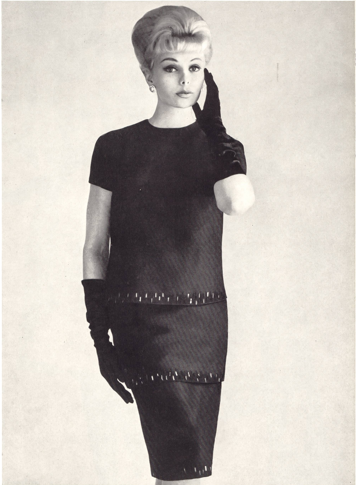
TISSAGES DE SOIERIES NAEF FRÈRES S.A., ZURICH « Tivoli » tissu acétate et laine (acetate and wool fabric, tejido de acetato y lana, Azetat-Woll-Gewebe) Modèle Brüllmann & Co., Zurich