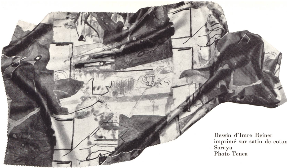
Dessin d'Imre Reiner imprimé sur satin de coton Soraya