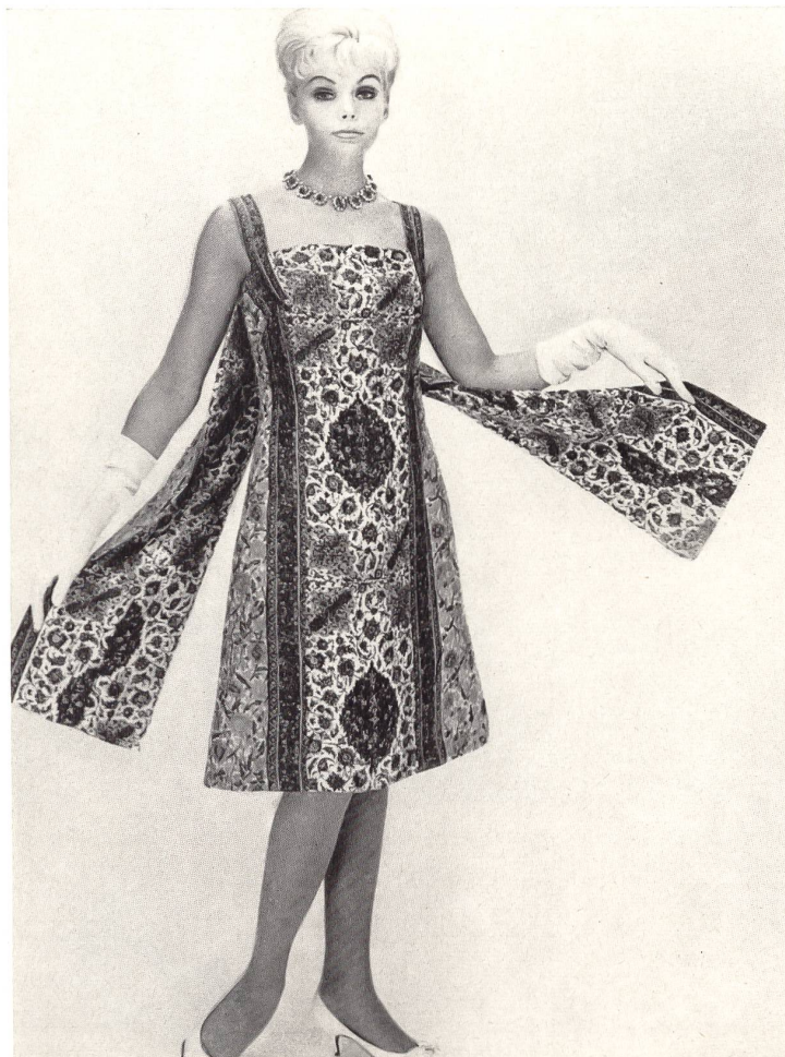
TISSAGES DE SOIERIES NAEF FRÈRES S.A., ZURICH Pure soie « Hirondele » imprimée d'un motif persan « Hirondele » pure silk fabric, printed with a Persian design « Hirondele », tejido pura seda estampado con un dibujo persa « Hirondele » Seiden-Imprimé mit persischen Motiven Modèle Yvel S.A., Zurich