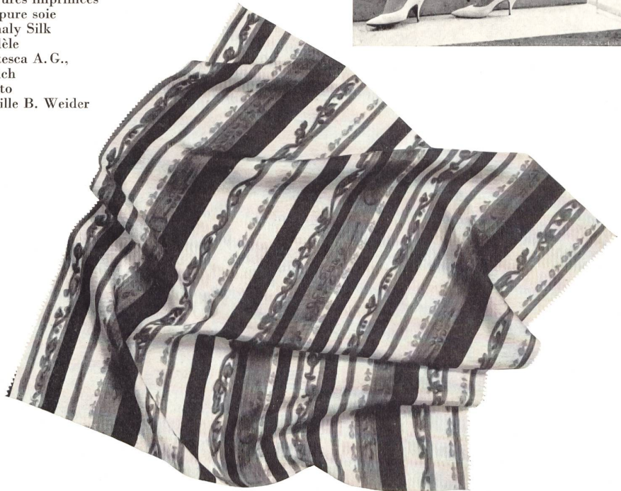
METTLER & CIE S.A., SAINT-GALL Collection été 1962 — Summer 1962 collection — Colección para el verano 1962 — Sommerkollektion 1962