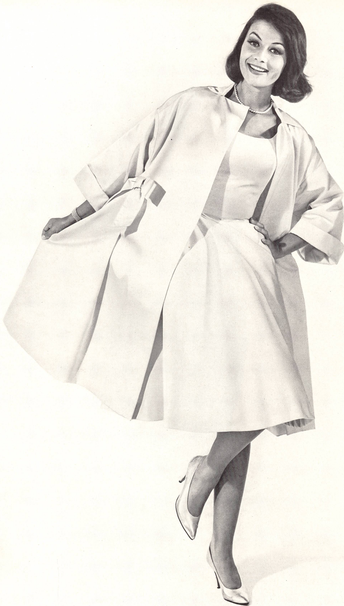
ROBT. SCHWARZENBACH & CO., THALWIL Tissu Peau de Soie (fabric, tejido, Gewebe) Modèle El-El S.A., Zurich