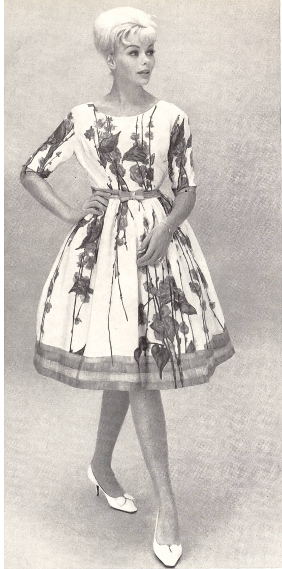
TISSAGES DE SOIERIES NAEF FRÈRES S.A., ZURICH Pure soie « Hirondele » imprimée d'un dessin en bordure « Hirondele » pure silk fabric, printed along one edge « Hirondele » tejido pura seda estampado con un dibujo de borde « Hirondele » Seiden-Imprimé, Bordürendessin Modèle Yvel S.A., Zurich