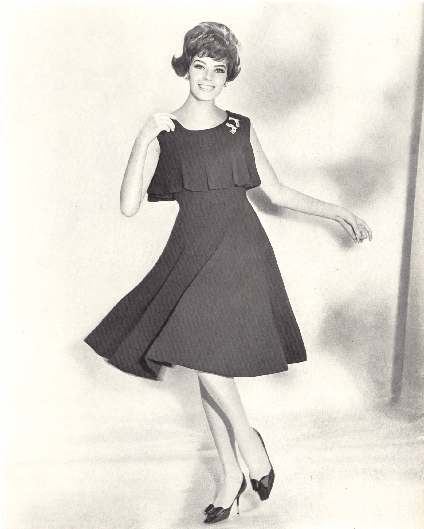
HEER & CIE S.A., THALWIL Crêpe Derby rayonne Modèle Willy Meyer S.A., Zurich