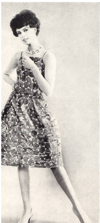
Impression « Devina » sur satin de coton Habanera Photo Rev