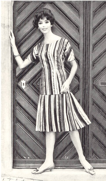
Rayures imprimées sur pure soie Mahaly Silk Modèle Cortesca A. G., Zurich