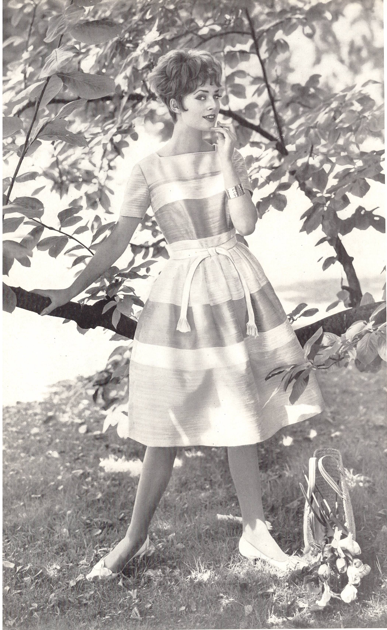
HEER & CO. S.A. THALWIL Shantung de soie Modèle Orig. Geny Spielmann, Zurich