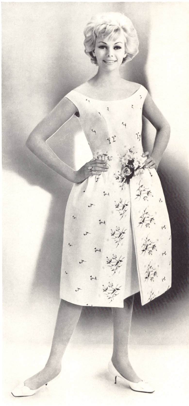
« RECO », REICHENBACH & CO., SAINT-GALL Batiste Souplesse imprimée (printed — estampada — bedruckt) Batiste Minicare brodée (embroidered — bordada — bestickt) Modèles Willy Meyer S.A., Zurich