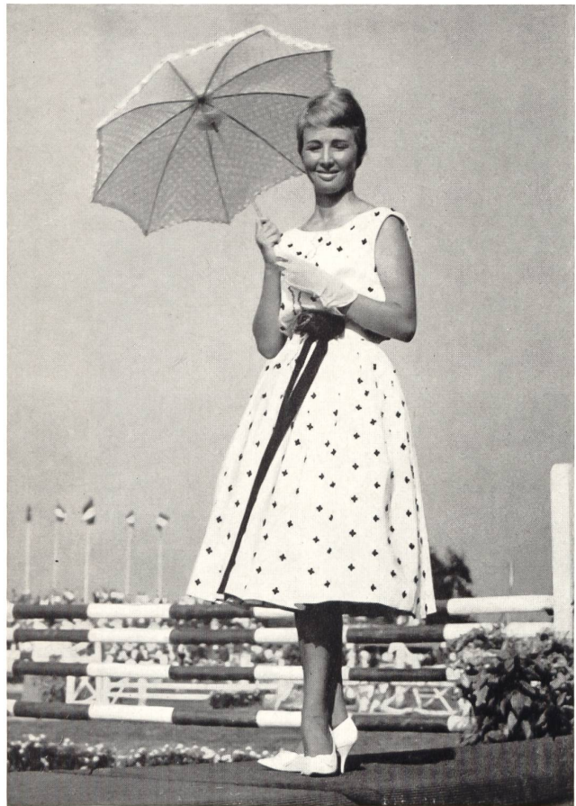
MACOLA A.-G., ZÜRICH Baumwollkleid mit applizierten Stickerei-Motiven

Nebenstehend einige Aufnahmen, die bei dieser Gelegenheit gemacht wurden.