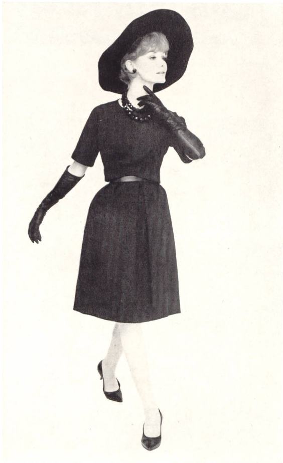
Schwarzes Baumwollgewebe aus St. Gallen Modell Teal Traina New York