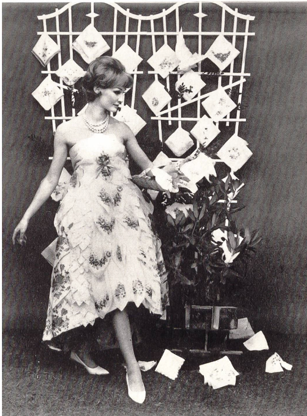
Kreation Marianne Couture, St. Gallen aus ca. 120 Tüchlein gemacht