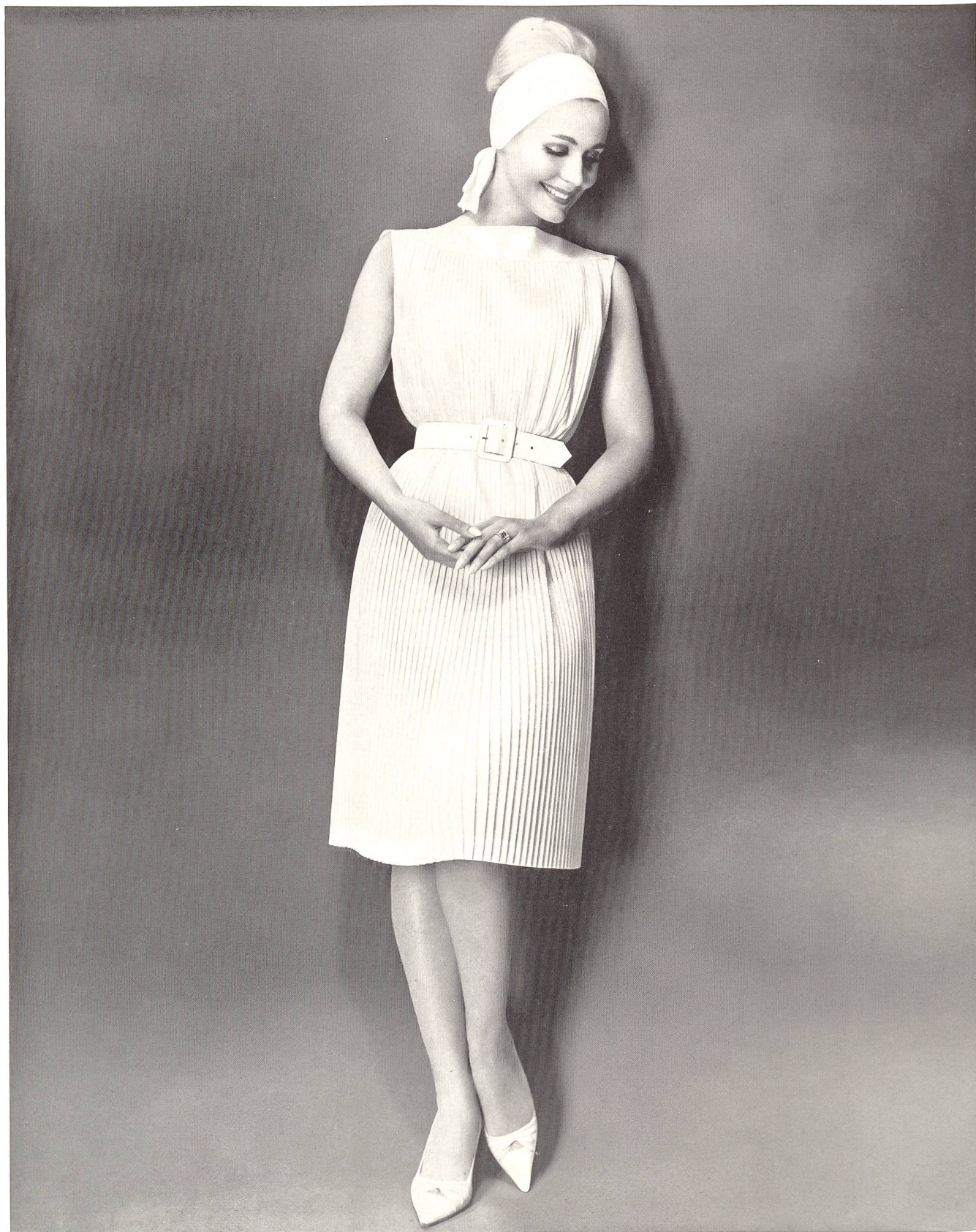
Elegantes Plissé-Kleid aus «Stoffels» Terylene

Nous présentons notre collection à l'Hôtel Central, à Zurich Tél. (051) 32 68 20