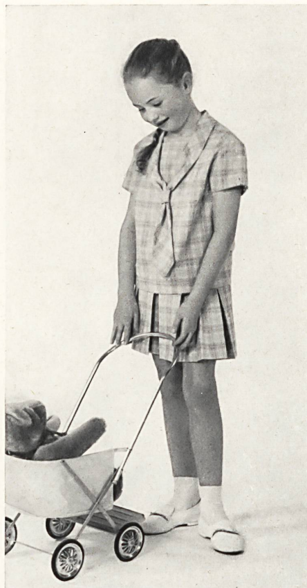
HEER & CIE S. A., THALWIL Térylène/laine Modèle Eugen Oertle & Cie, Saint-Gall