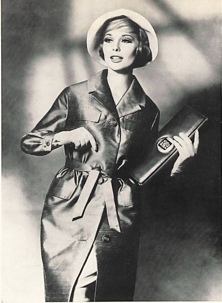
HEER & CIE S. A., THALWIL Shantung pure soie Imperméable de Dumas, Egloff S. A., Châtel-Saint-Denis