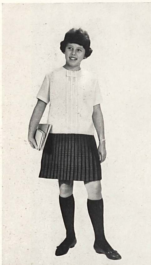
HEER & CIE S. A., THALWIL Térylène/laine (blouse et jupe) Modèle Leumann, Boesch & Cie S. A., Kronbühl