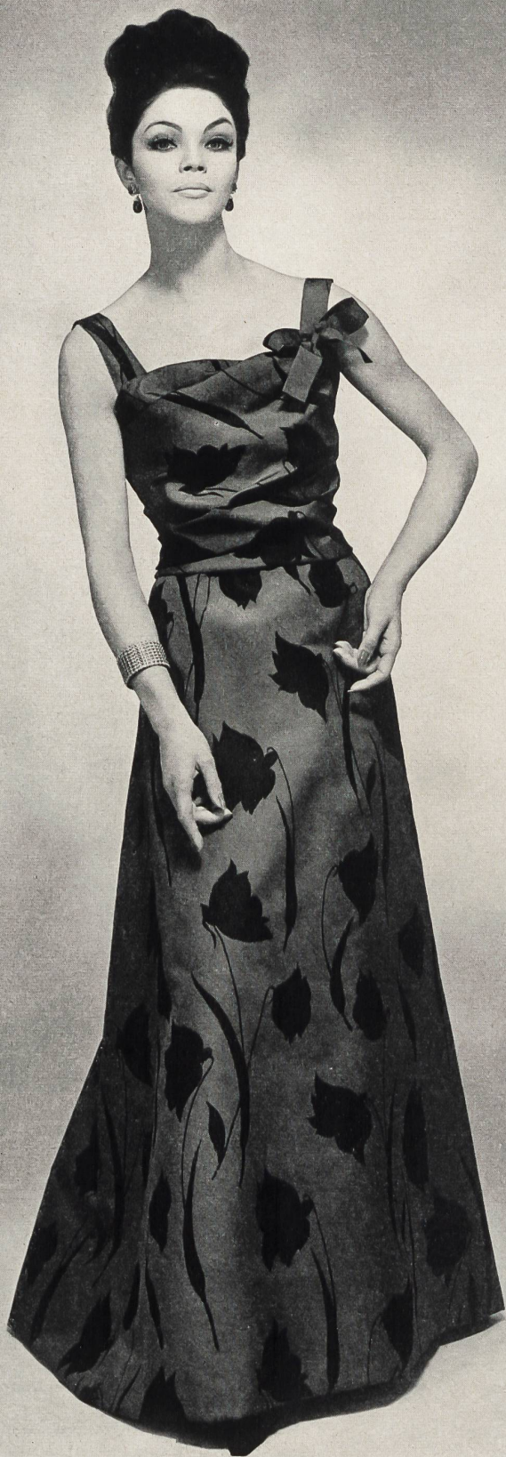
CHRISTIAN DIOR (Boutique) Sablé chiné imprimé pure soie de Rudolf Brauchbar & Cie S.A., Zurich