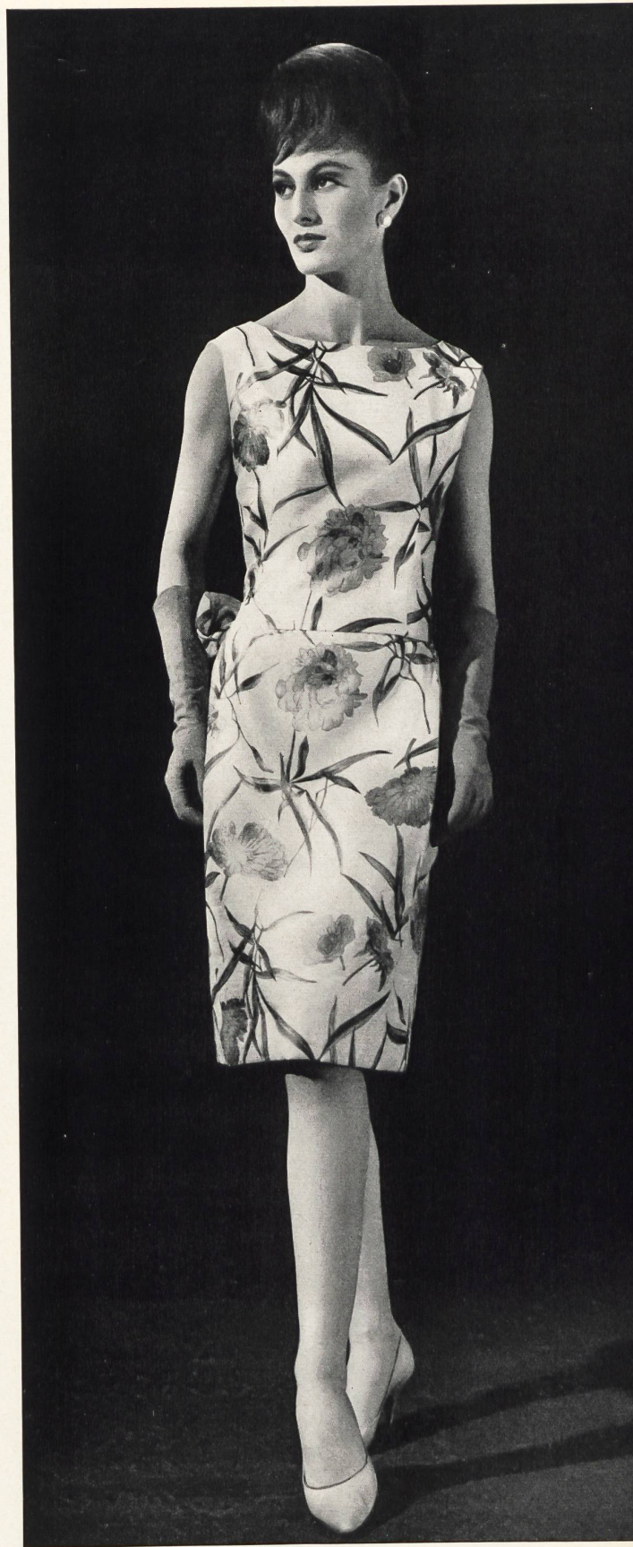
CHRISTIAN DIOR (Boutique) « Olympic » pure soie imprimée de Rudolf Brauchbar & Cie S.A., Zurich