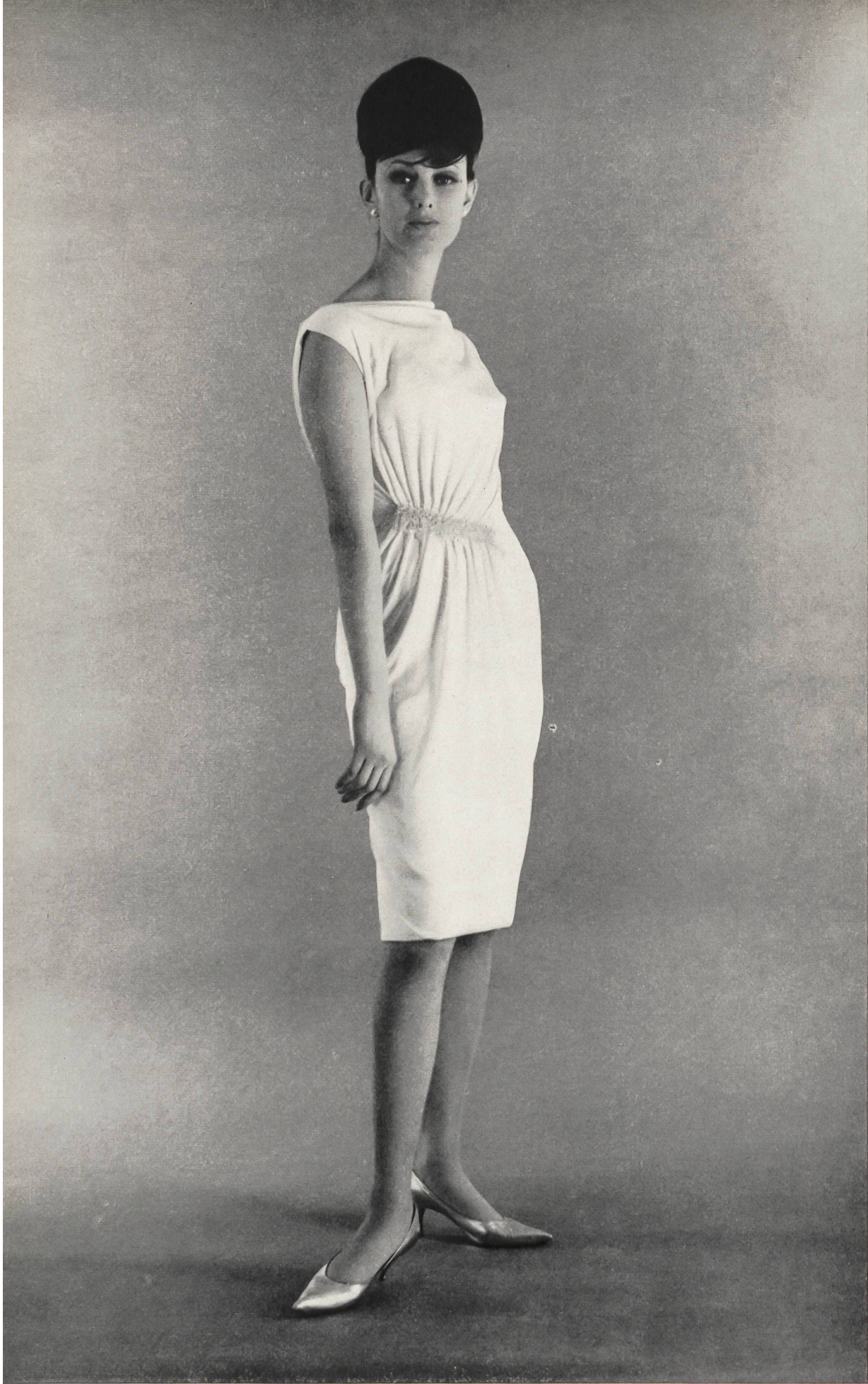
CARVEN Crêpe « Masuma », soie naturelle de Heer & Cie S.A., Thalwil Grossiste à Paris: Robert Burg & Cie