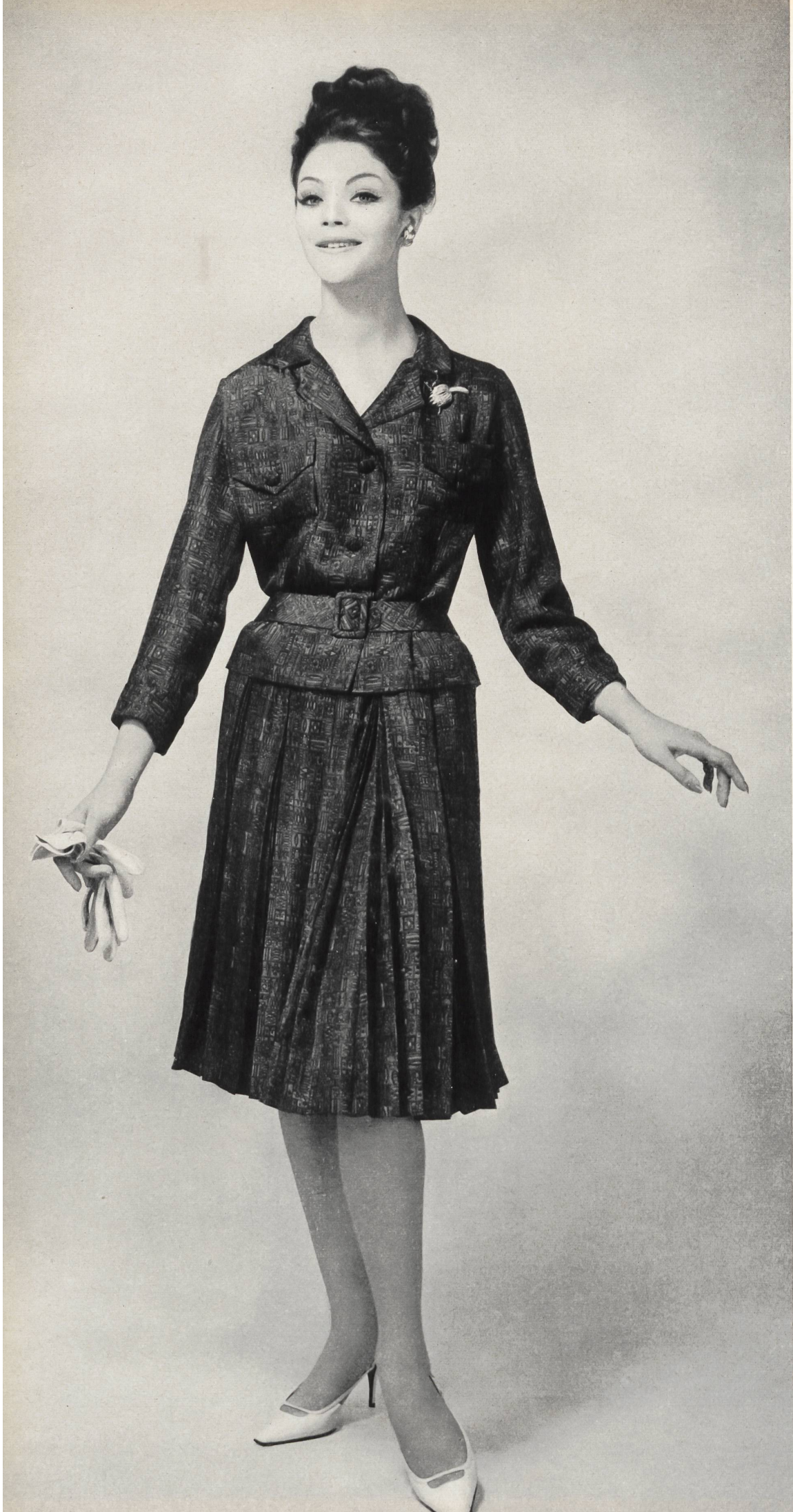
CHRISTIAN DIOR (Boutique) « Caroline », imprimé pure soie de Rudolf Brauchbar & Cie S.A., Zurich