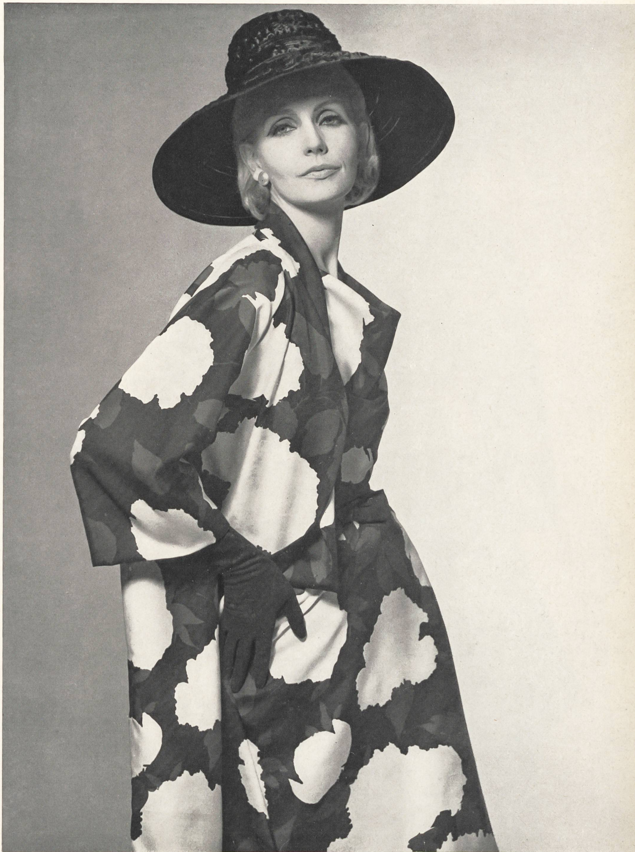
PIERRE BALMAIN Robe et manteau en « Dauphine Imprimé », de L. Abraham & Cie, Soieries S. A., Zurich

MODÈLES EXCLUSIFS — REPRODUCTION INTERDITE