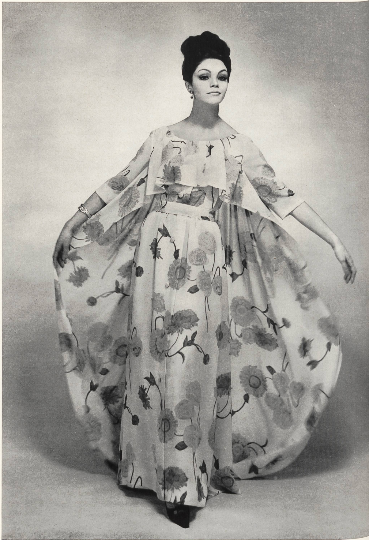
CHRISTIAN DIOR (Boutique) Crêpe « Flirte » imprimé pure soie de Rudolf Brauchbar & Cie S.A., Zurich