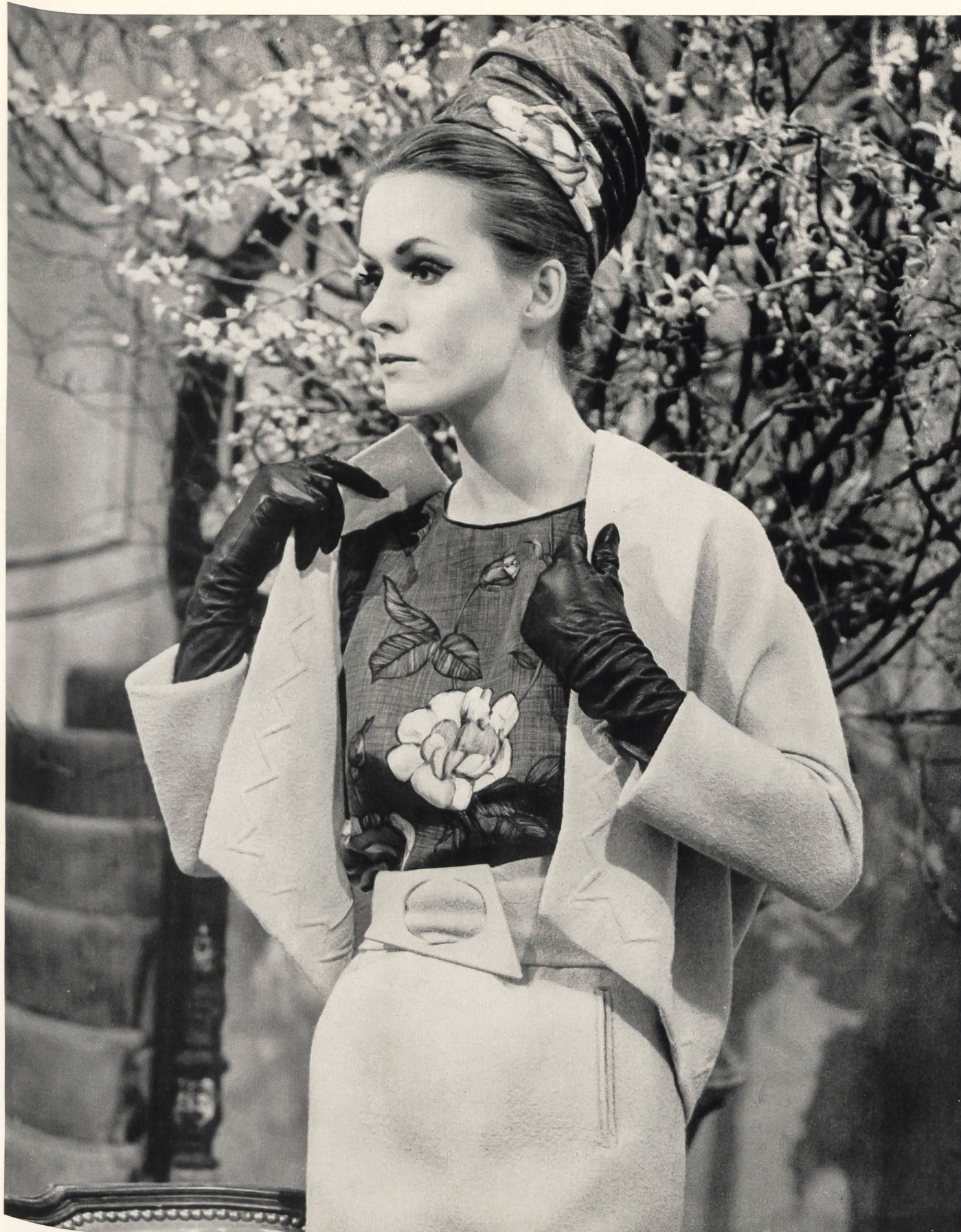
PIERRE CARDIN Soie « Hironnelle » imprimée des Tissages de Soieries Naef Frères S.A., Zurich