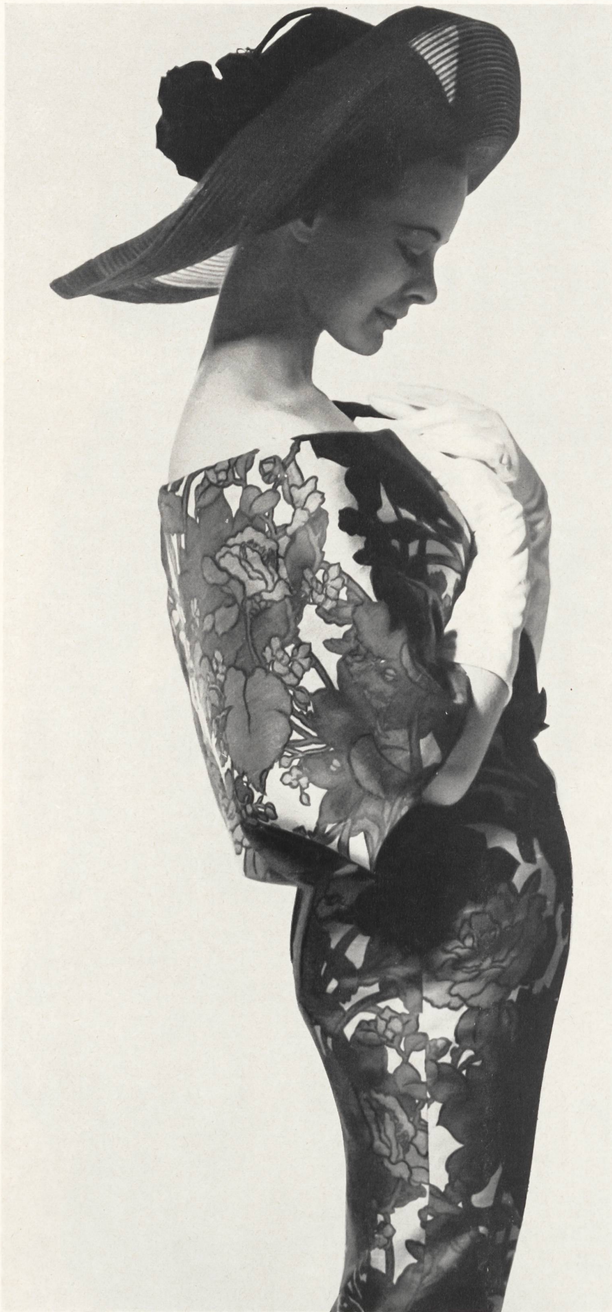
JACQUES HEIM Robe d'après-midi en « Kwana imprimé », de L. Abraham & Cie, Soieries S. A., Zurich