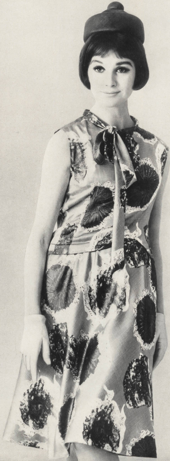
PIERRE CARDIN Satin « Mindo » imprimé, soie des Tissages de Soieries Naef Frères S.A., Zurich