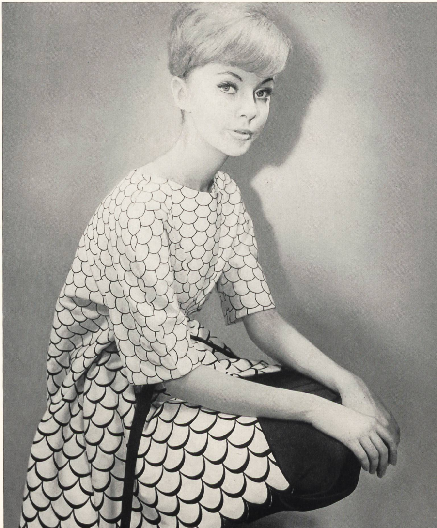
CHRISTIAN DIOR (Boutique) Bordure brodée sur piqué de Forster Willi & Co., Saint-Gall