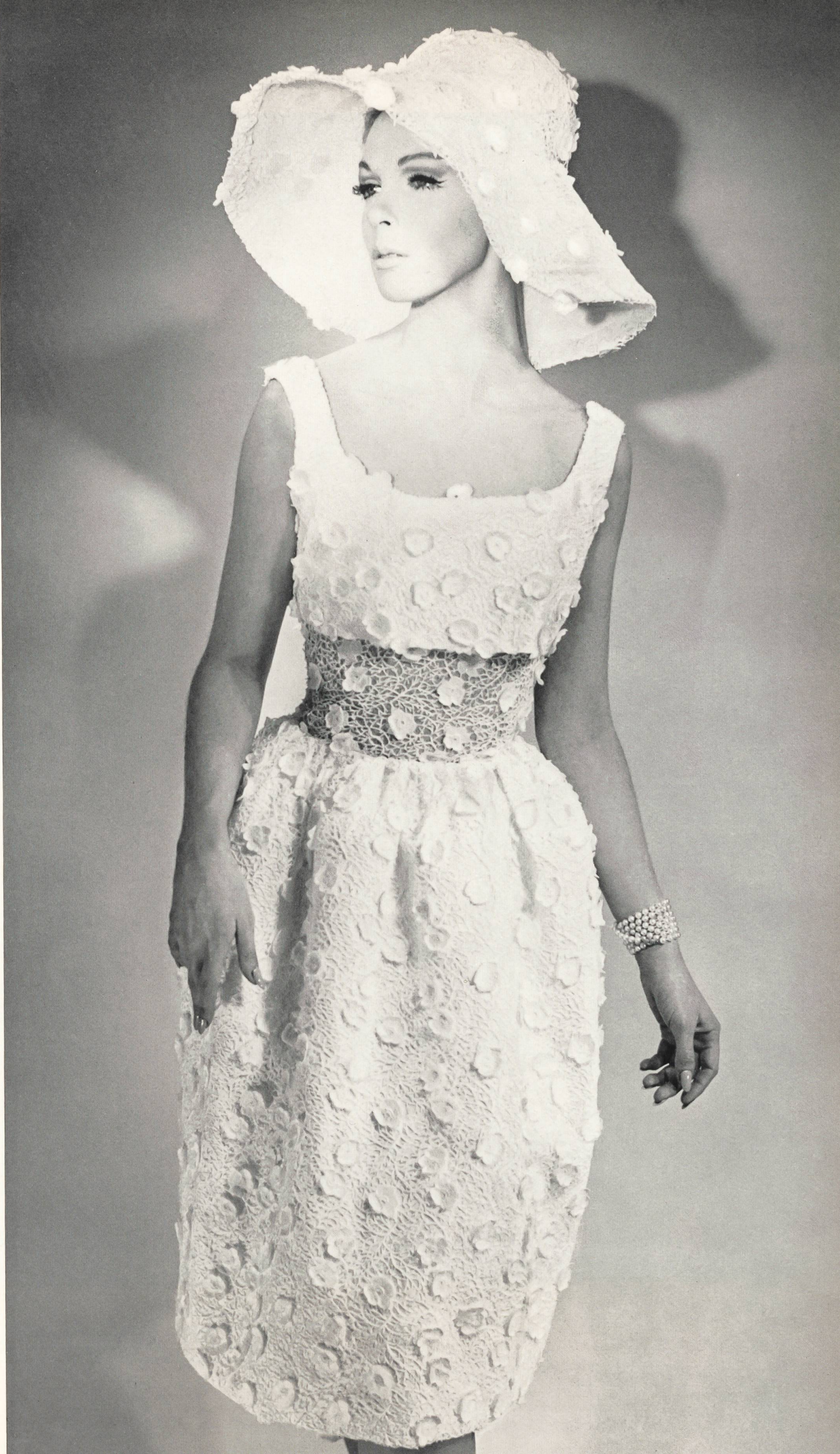
GUY LAROCHE Dentelle de guipure riche de Forster Willi & Co., Saint-Gall Grossiste à Paris : Robert Burg & Cie