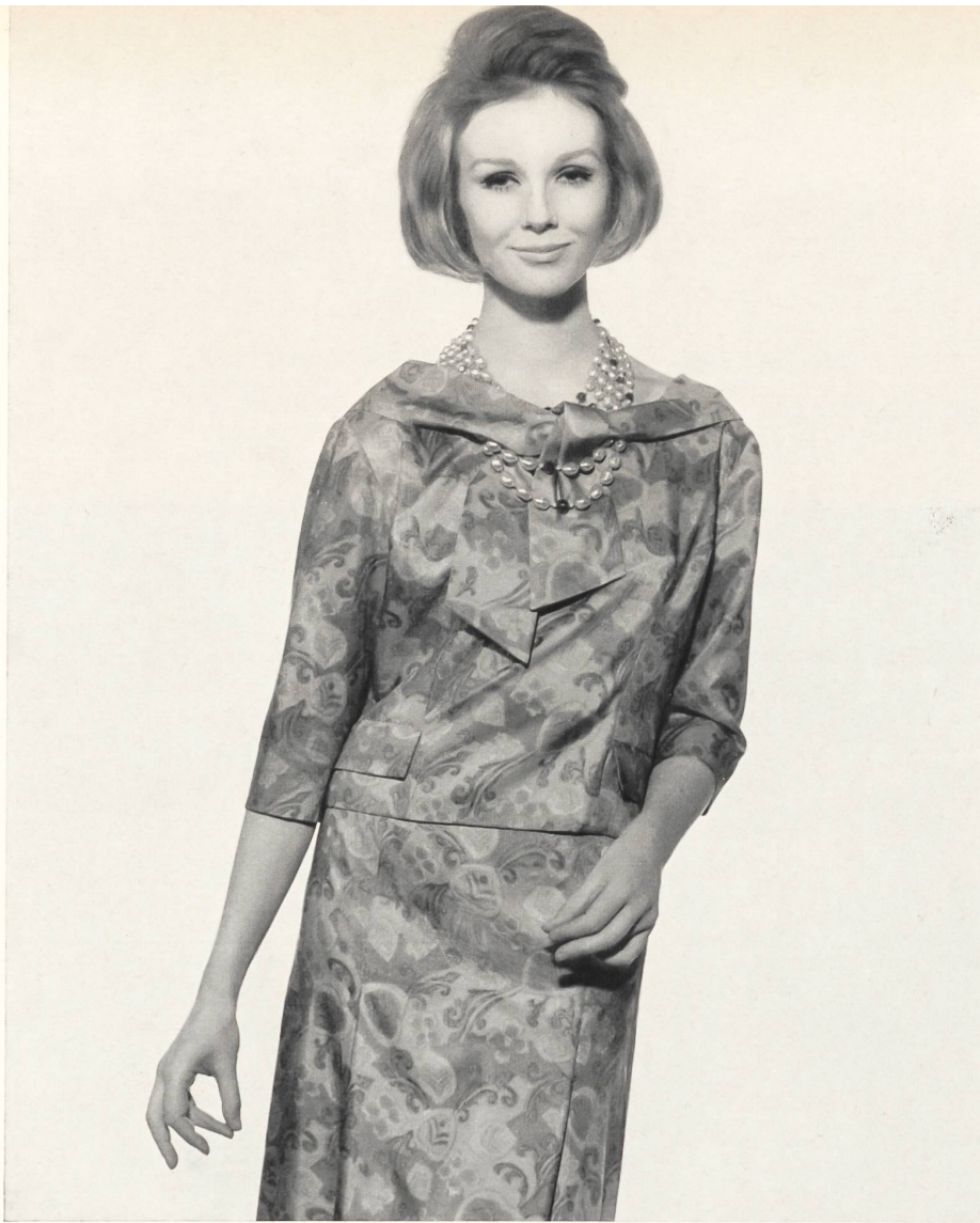
RÉGINE LUTÈCE, PARIS Tissu « bégé-Oki Ama » pure soie de Bégé S. A., Tissus Nouveautés, Zurich Lahondès, grossiste exclusif, Paris