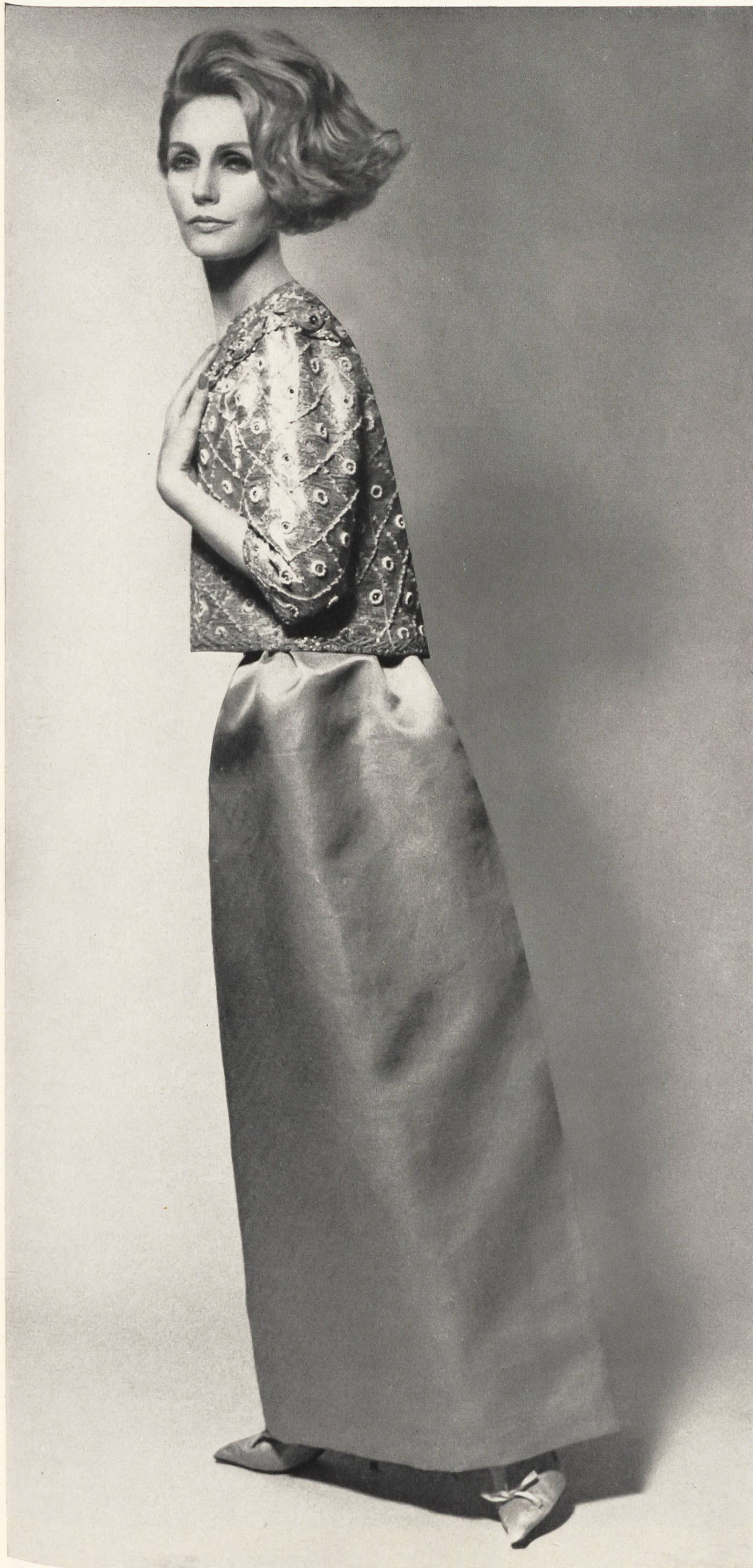
CHRISTIAN DIOR Robe du soir en «Tundra» de L. Abraham & Cie, Soieries S.A., Zurich