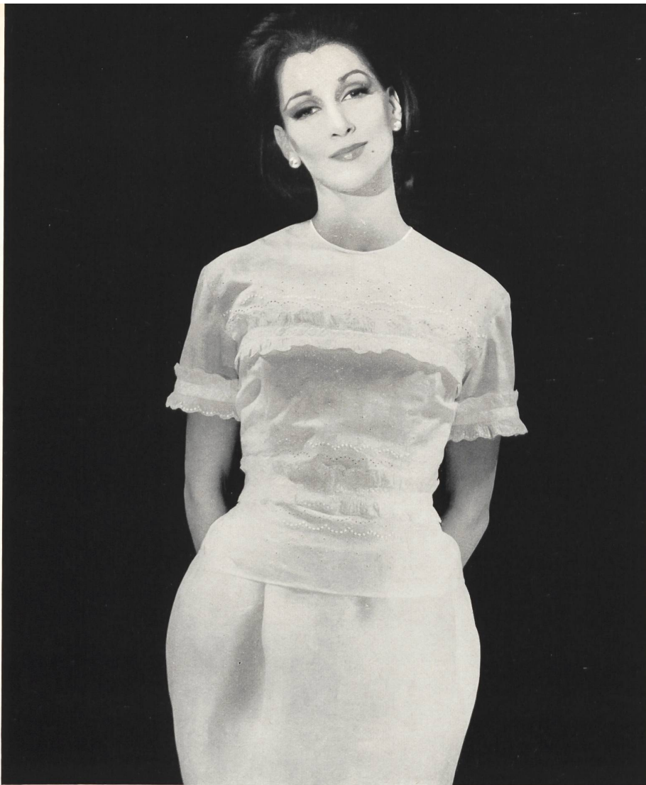
CARVEN « Nelo », broderie coton « Belrosa » Minicare de J. G. Nef & Co. S. A., Hérisau