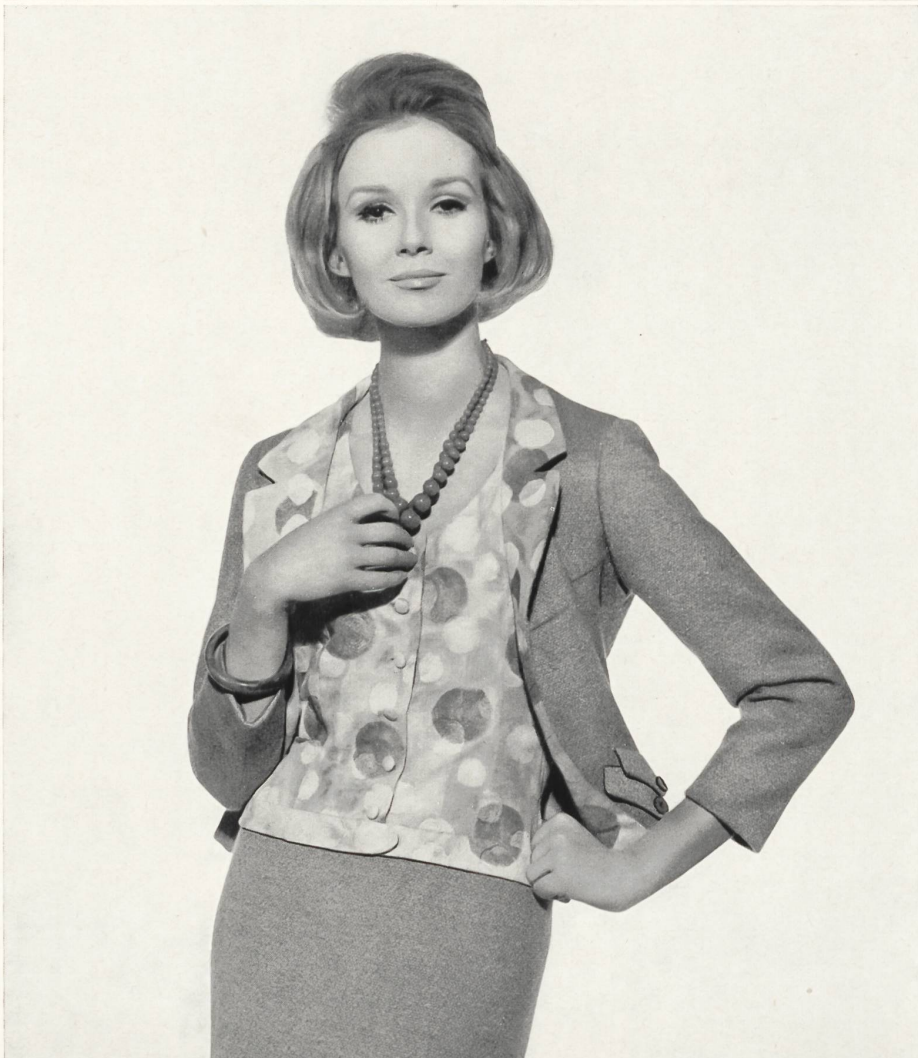
RECTIFICATION La légende de chacun de ces deux documents, parus aux pages 82 et 189 de « Textiles Suisses » N° 2/1962, ne men- tionnait pas le nom du gros- siste exclusif à Paris : la Maison Lahondès