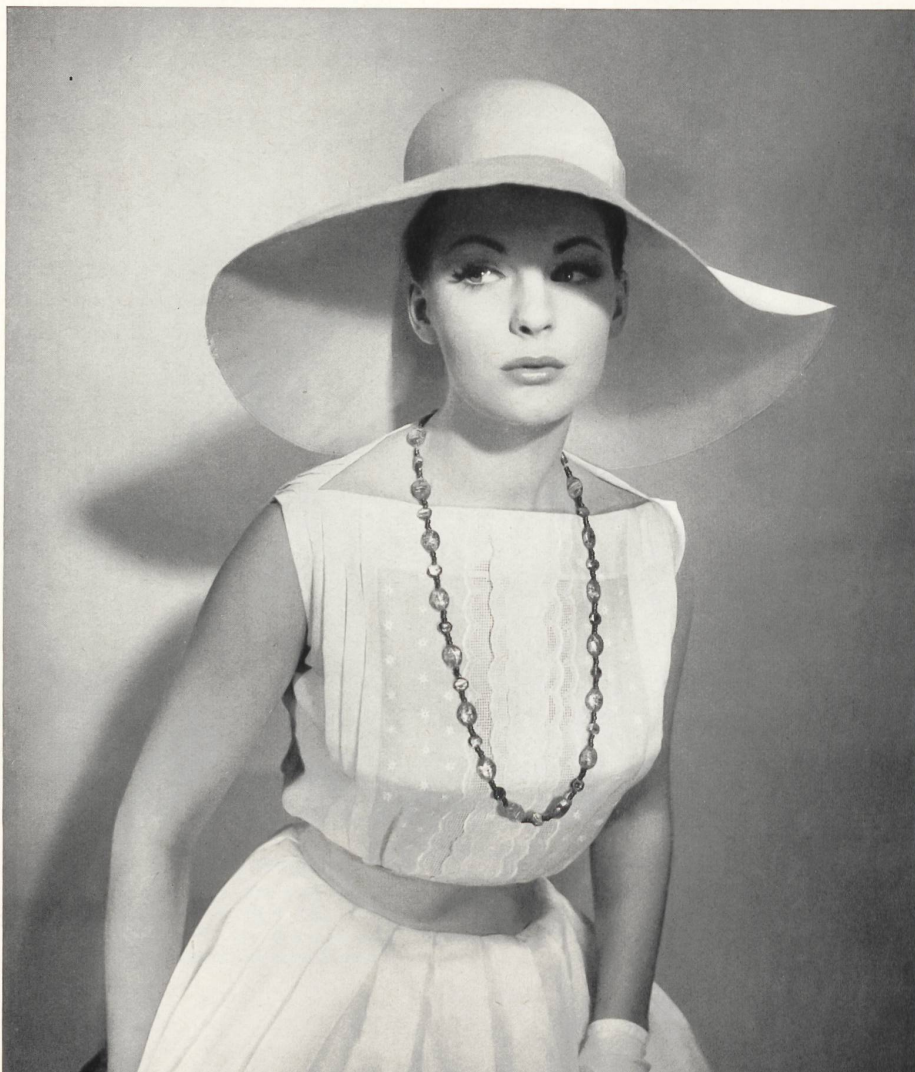
GUY LAROCHE « Nelo », broderie coton « Belrosa » Minicare de J. G. Nef & Co. S. A., Hérisau