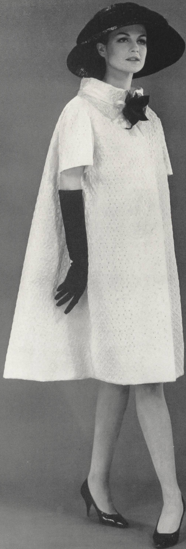
JACQUES HEIM Batiste Minicare blanche brodée de Reichenbach & Co., Saint-Gall