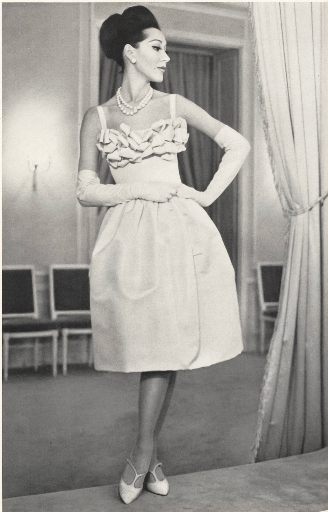
CHRISTIAN DIOR (Boutique) Poult de soie de la S.A. Stünzi Fils, Horgen