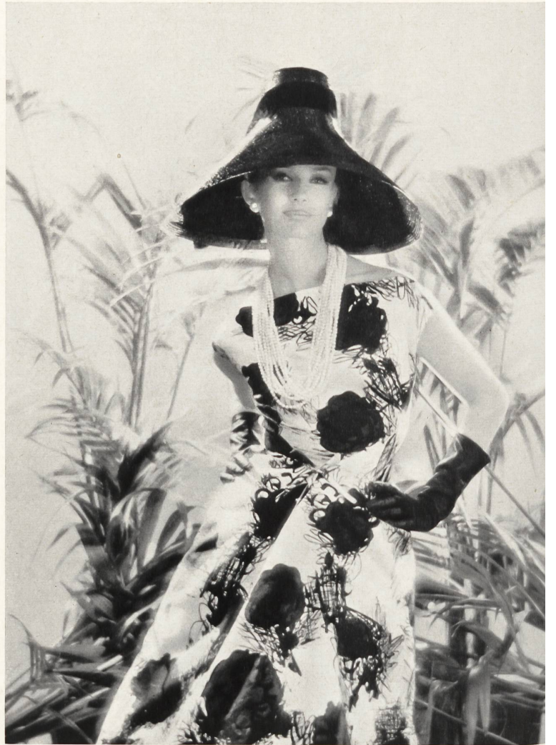
JACQUES GRIFFE Soie imprimée de Robt. Schwarzenbach & Co., Thalwil