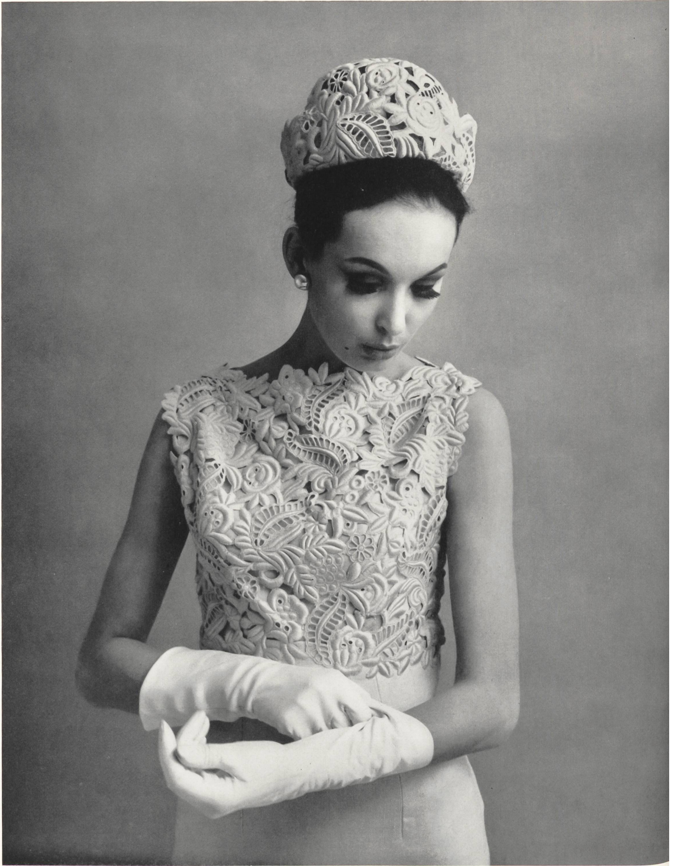
PIERRE BALMAIN Galon découpé de Forster Willi & Co., Saint-Gall