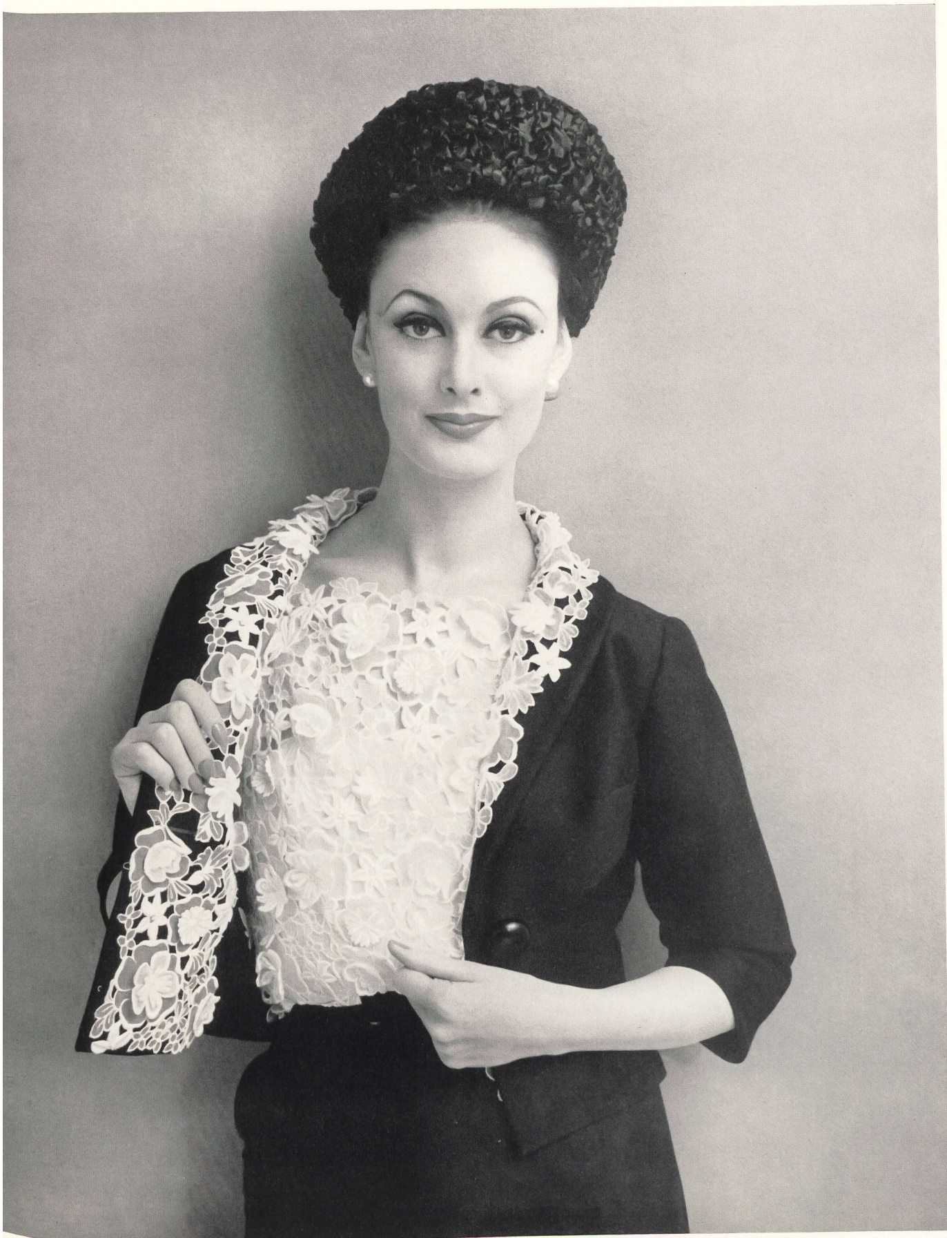
JEAN DESSÈS Galon d'organdi découpé de Forster Willi & Co., Saint-Gall Grossiste à Paris : Pierre Brivet, S. à r. l.