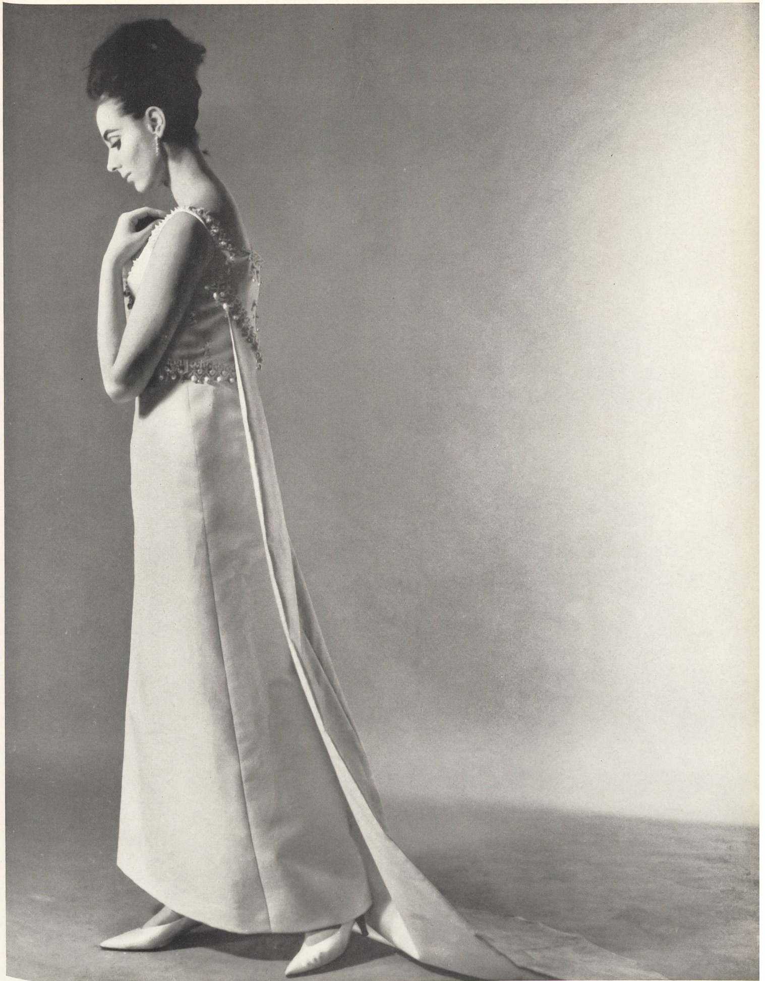
JACQUES HEIM Robe du soir en «Tundra» de L. Abraham & Cie, Soieries S.A., Zurich