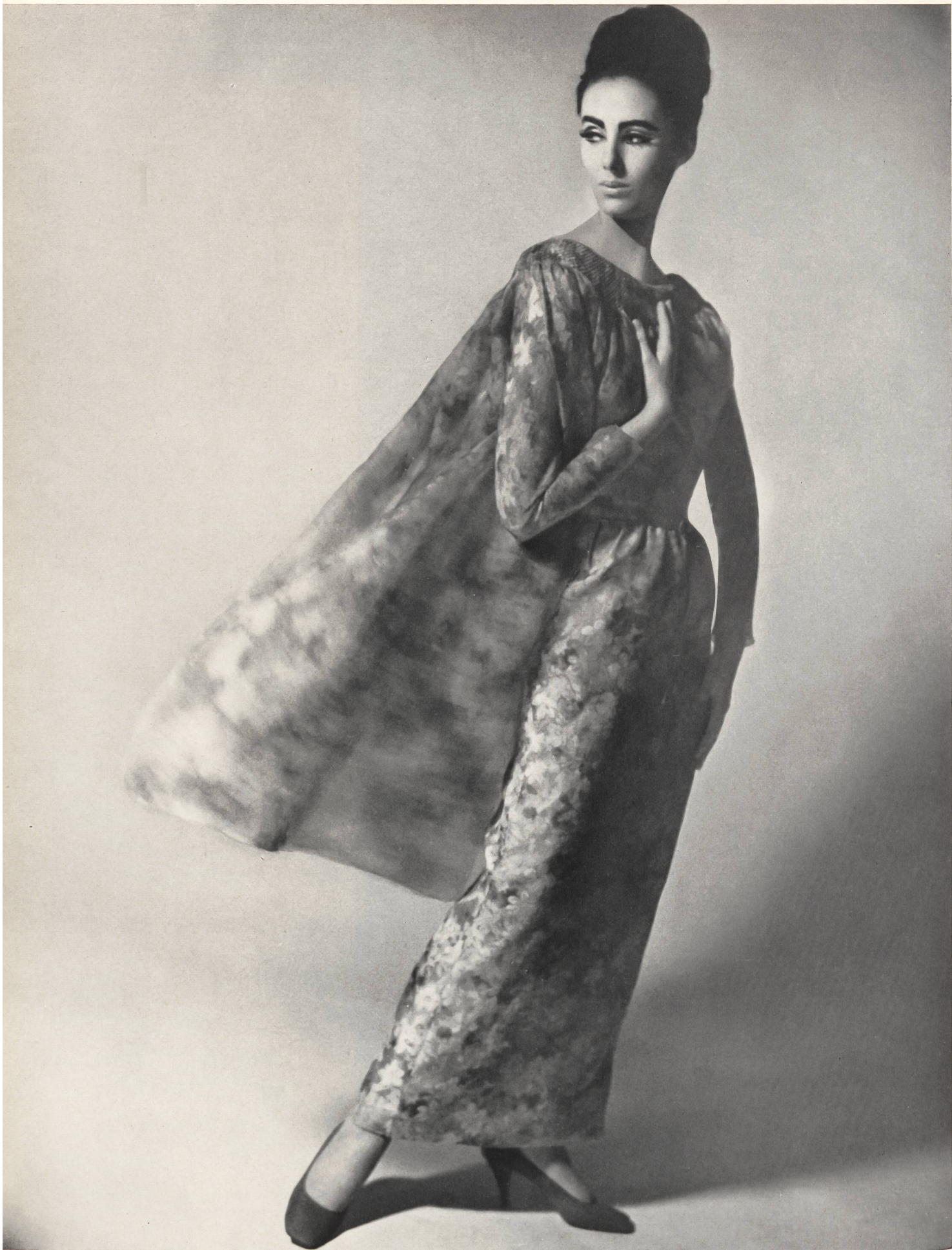
PIERRE CARDIN Robe du soir en «Mousseline Chichi» de L. Abraham & Cie, Soieries S.A., Zurich