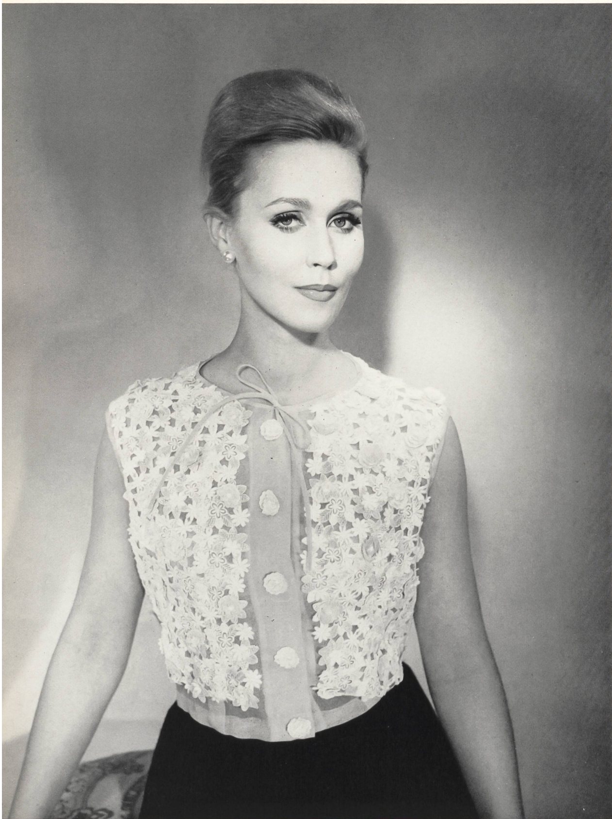
BERNARD SAGARDOY Organdi brodé avec fleurs superposées de A. Naef & Cie S. A., Flawil/Saint-Gall Grossiste à Paris: Robert Burg & Cie