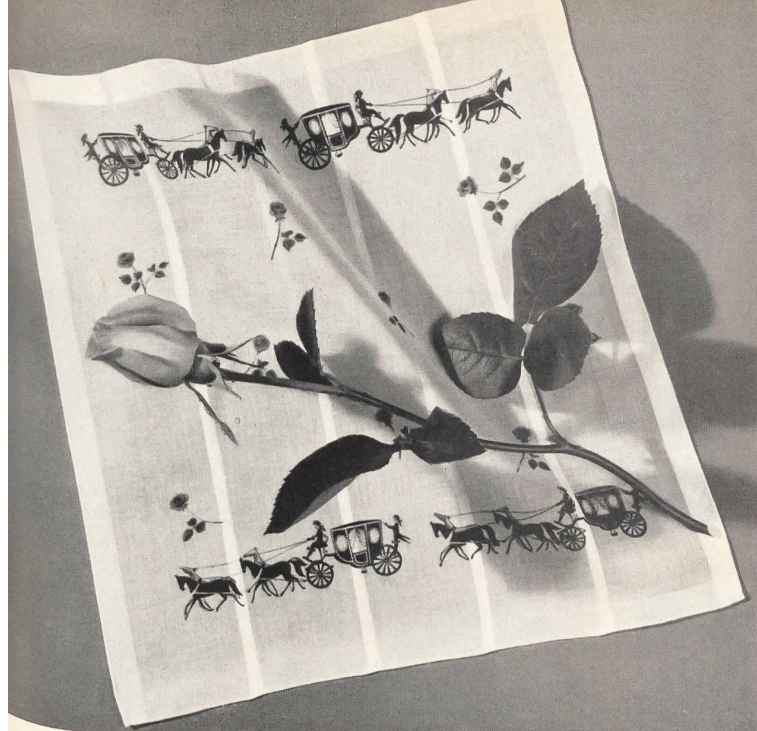
STOFFEL S. A., SAINT-GALL

Les possibilités de renouvellement des créateurs de petits mouchoirs imprimés semblent inépuisables. Dans la collection de cette maison, on note particulièrement une façon nouvelle de traiter les sujets traditionnels, comme la scène folklorique représentée ici; on remarque aussi, entre autres tendances, une inspiration égyptienne et sud-américaine qui — par le dessin et le coloris — produit des mouchoirs d'un aspect nettement exotique.