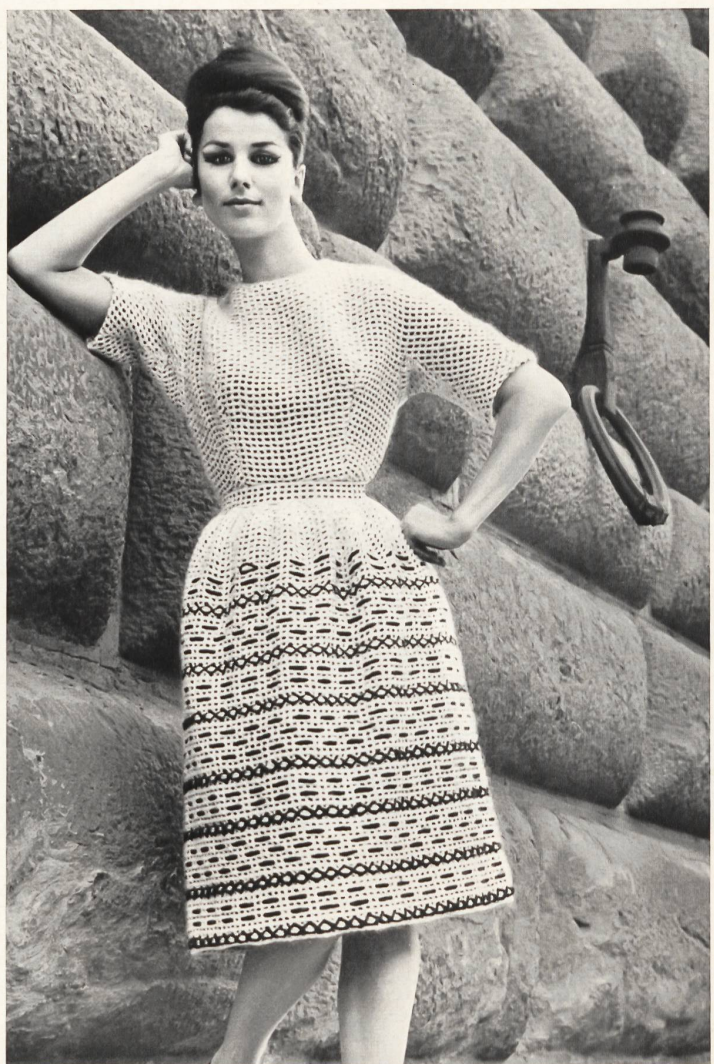
Robe rose pâle, garnie de rubans de velours Pale pink dress trimmed with velvet ribbons Vestido color de rosa pálido, adornado con cintas de terciopelo Modèle Bertoli, Milan