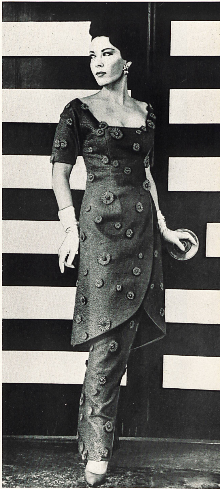
FORSTER WILLI & CO., SAINT-GALL Tissu brodé avec applications de broderie Embroidered fabric with appliquéd flowers Modèle Travilla, Los Angeles