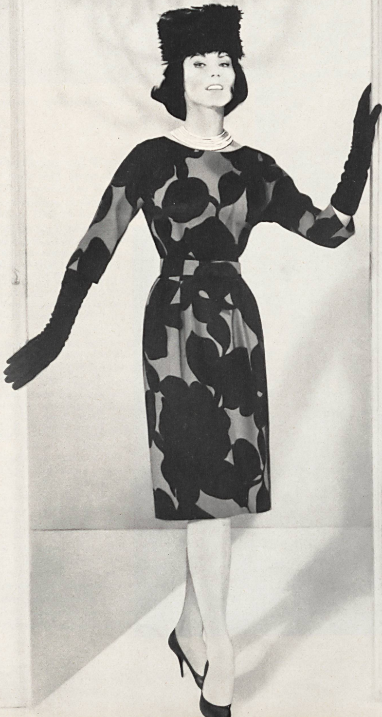
L. ABRAHAM & CO. SILKS LTD., ZURICH « Charlus » lainage imprimé « Charlus » printed wool fabric Modèle Helga, Los Angeles

ihm vollends bei, wenn er seine Kollegen in Kalifornien als « Kleiderzeichner » und « Fabrikanten » in einem bezeichnet. Jedem Einzelnen sind gewisse Kniffe eigen, das kam wieder sehr deutlich während der letzten Vorführungen der Ferien- und Frühjahrsmode zum Ausdruck. Es war bei diesen Gelegenheiten eine Fülle von faszinierenden Modellen aus bewundernswerten Geweben zu sehen, die den Grossisten zu Preisen von 29,75 bis zu mehreren Tausenden Dollars angeboten wurden;