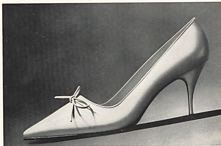
Bally Madeleine - La nouvelle ligne fusée

Die Chelsea Boots seien noch hervorgehoben, die eleganten Stadtbottinen, deren Schnitt mit der modernen engen Hose harmoniert, auch noch die geflochtenen Mo-