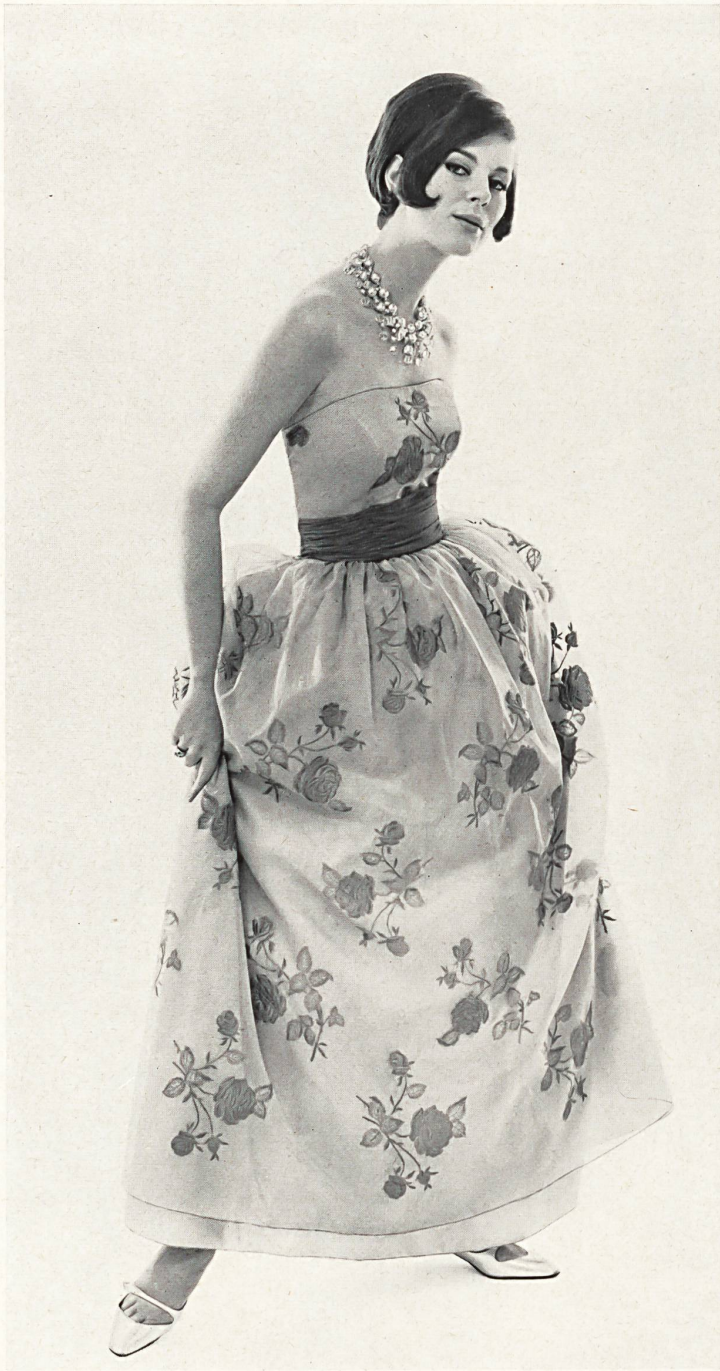
FORSTER WILLI & CO., SAINT-GALL

Soie brodée Embroidered silk Modèle Ricci Michaels Ltd., Londres