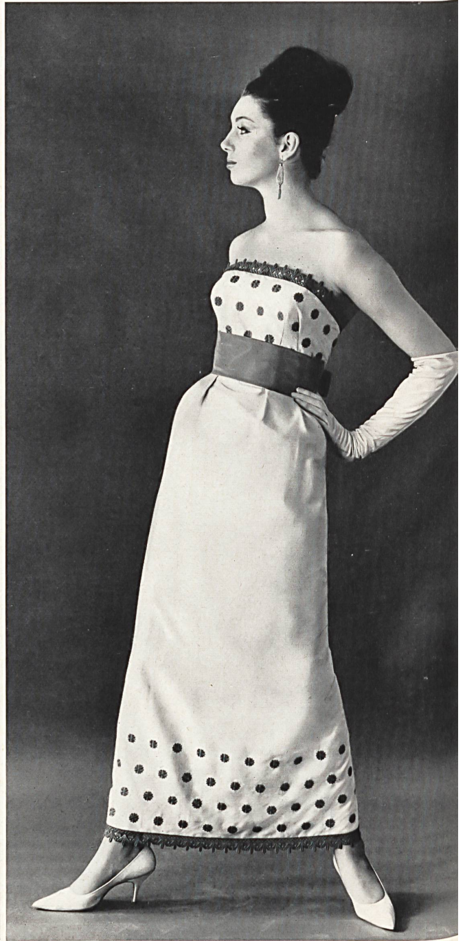
FORSTER WILLI & CO., SAINT-GALL

Soie brodée Embroidered silk Modèle Ricci Michaels Ltd., Londres