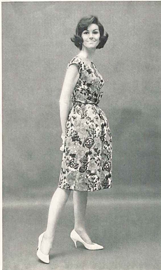
4 « Nelo », J.G. NEF & CO. S. A., HERISAU Ottoman de coton Cotton ottoman Modèle de Mollie Parnis, Parnis-Livingston Inc., New York

Swiss Fabric and Embroidery Center, New York