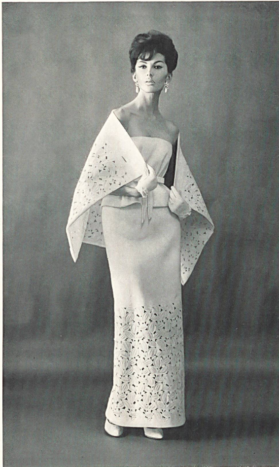
1 FORSTER WILLI & CO., SAINT-GALL Broderie découpée sur piqué de coton blanc Cut out embroidery on white cotton piqué Modèle Arnold Scaasi, New York