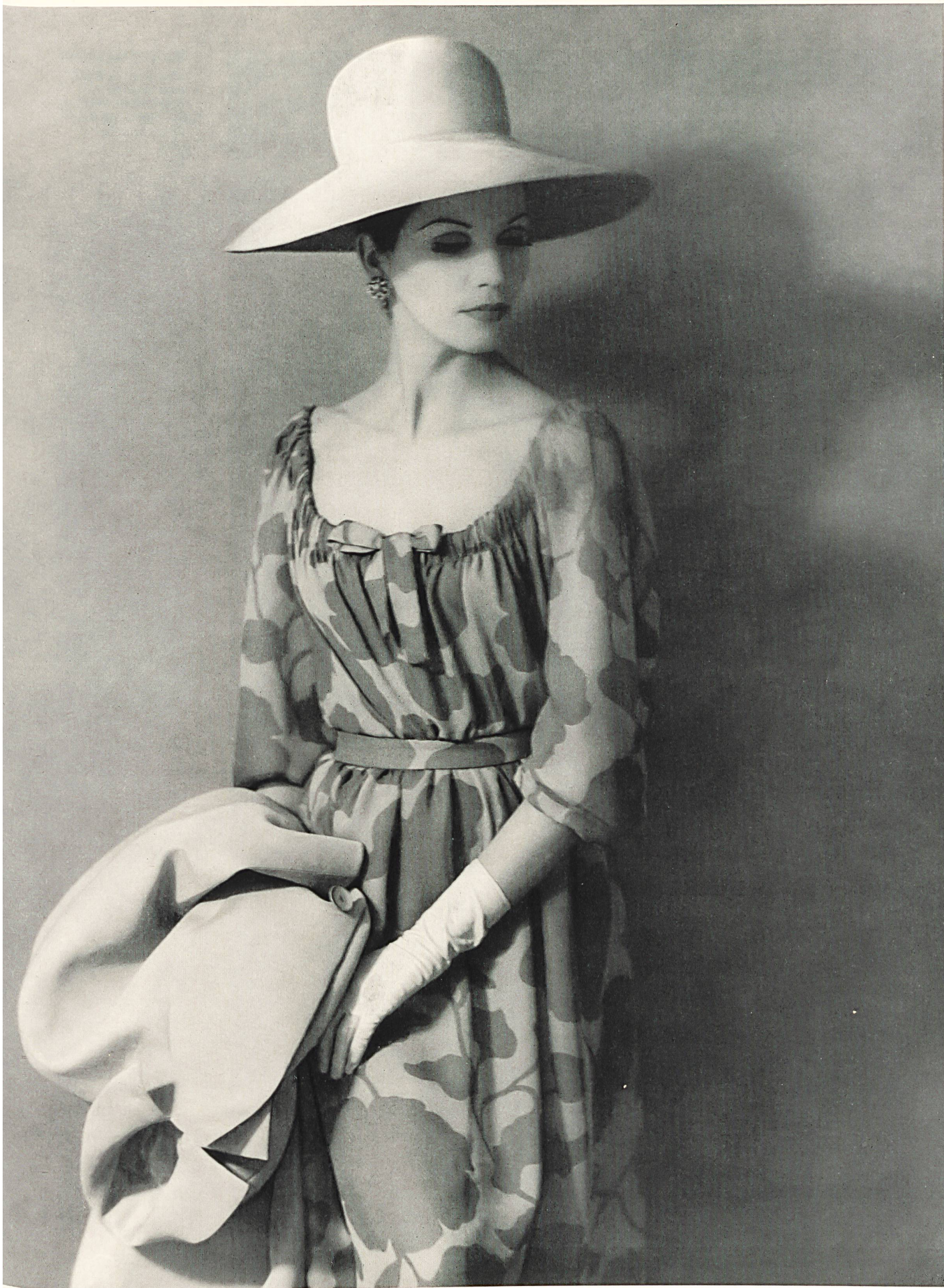
GUY LAROCHE Robe de cocktail en mousseline « Edéa » imprimée et manteau en « Gazar » de L. Abraham & Cie, Soieries S. A., Zurich