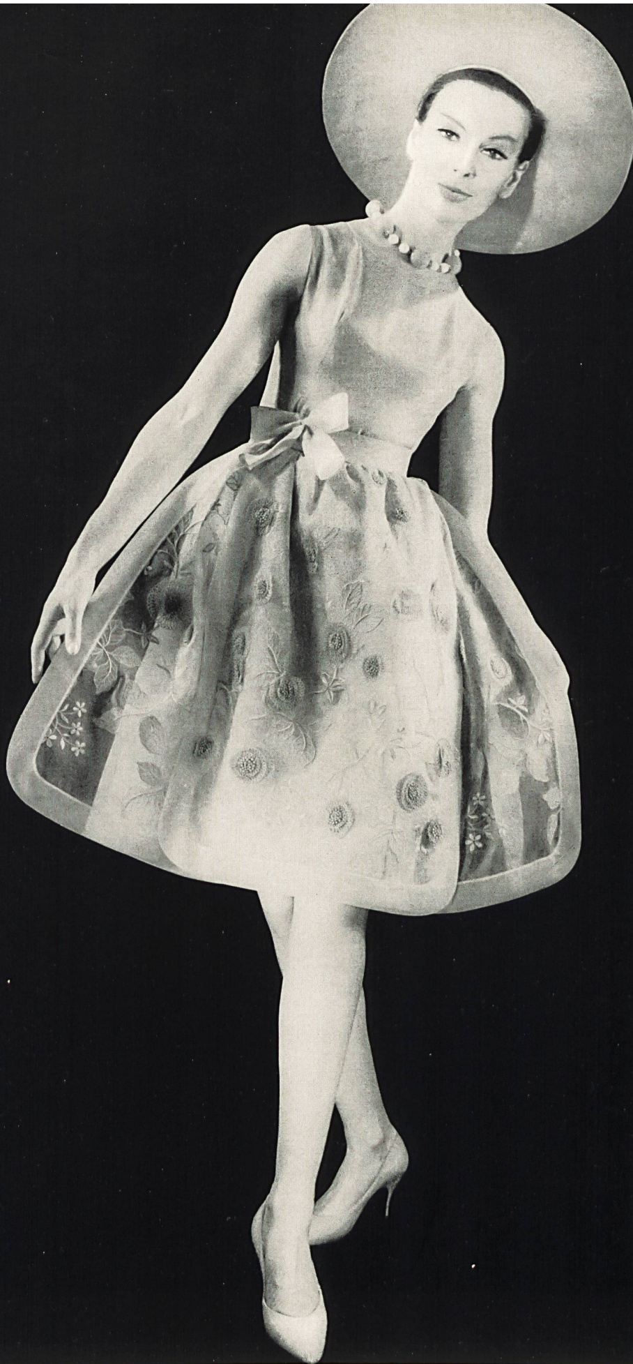
FERRERAS Organdi de soie brodé couleur avec applications de motifs de guipure de Union S. A., Saint-Gall Grossiste à Paris : Robert Burg & Cie