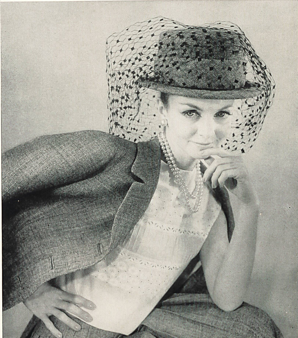
CARVEN Broderie « Nelo » sur « Minicare » Belrosa de J. G. Nef & Co. S. A., Hérisau Grossiste à Paris : Robert Burg & Cie