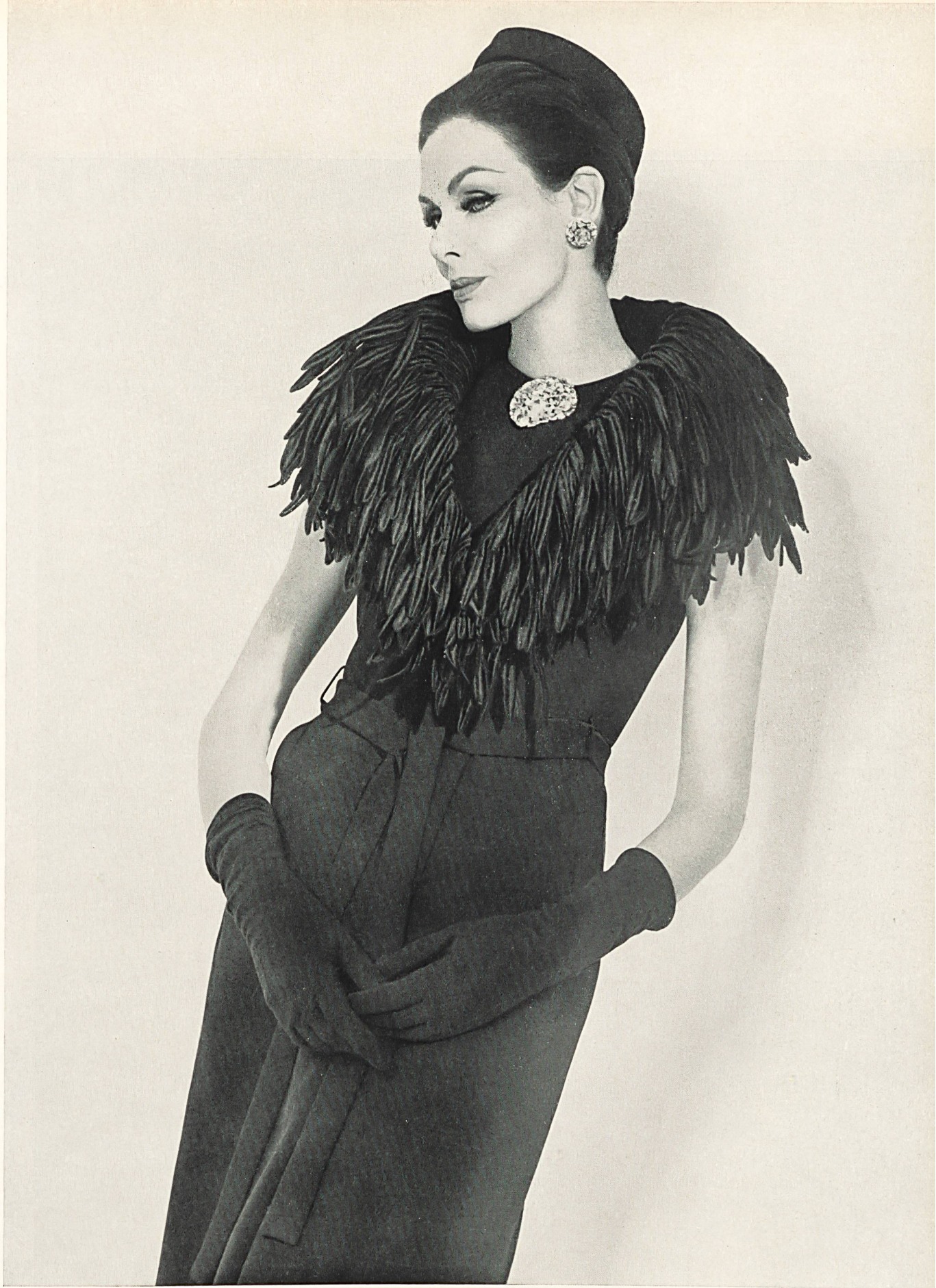
CHRISTIAN DIOR Franges brodées de Forster Willi & Co., Saint-Gall