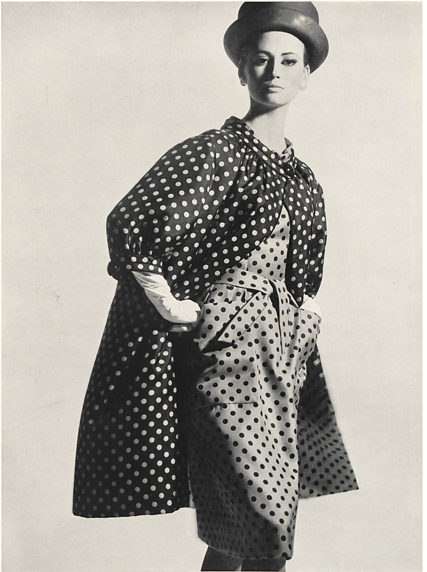
JEANNE LANVIN Twill « Doucine » imprimé de L. Abraham & Cie, Soieries S. A., Zurich