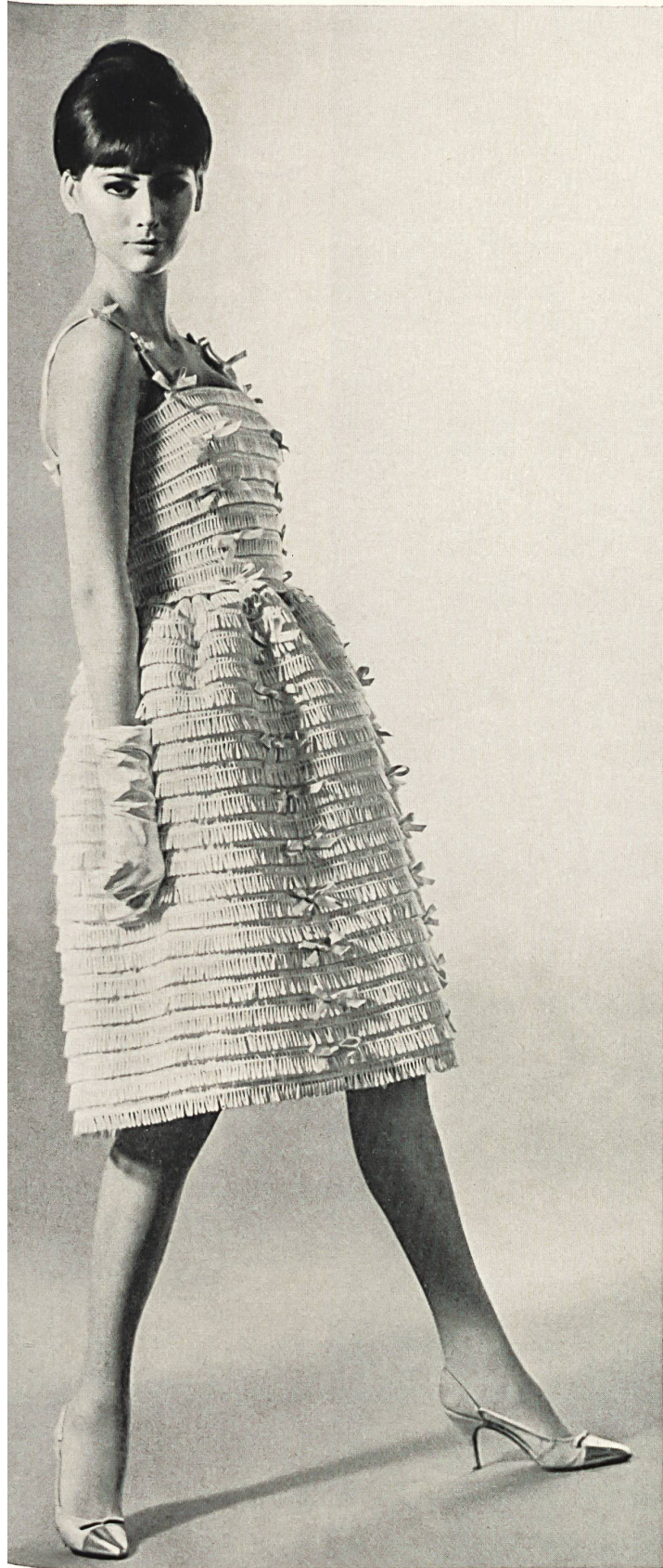
GUY LAROCHE Organdi avec guipure de Forster Willi & Co., Saint-Gall Grossiste à Paris : Robert Burg & Cie