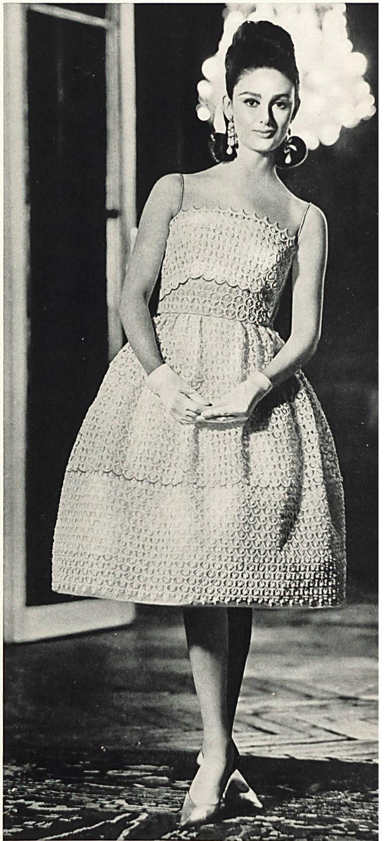
CARVEN Volant de guipure de Forster Willi & Co., Saint-Gall Grossiste à Paris : Robert Burg & Cie