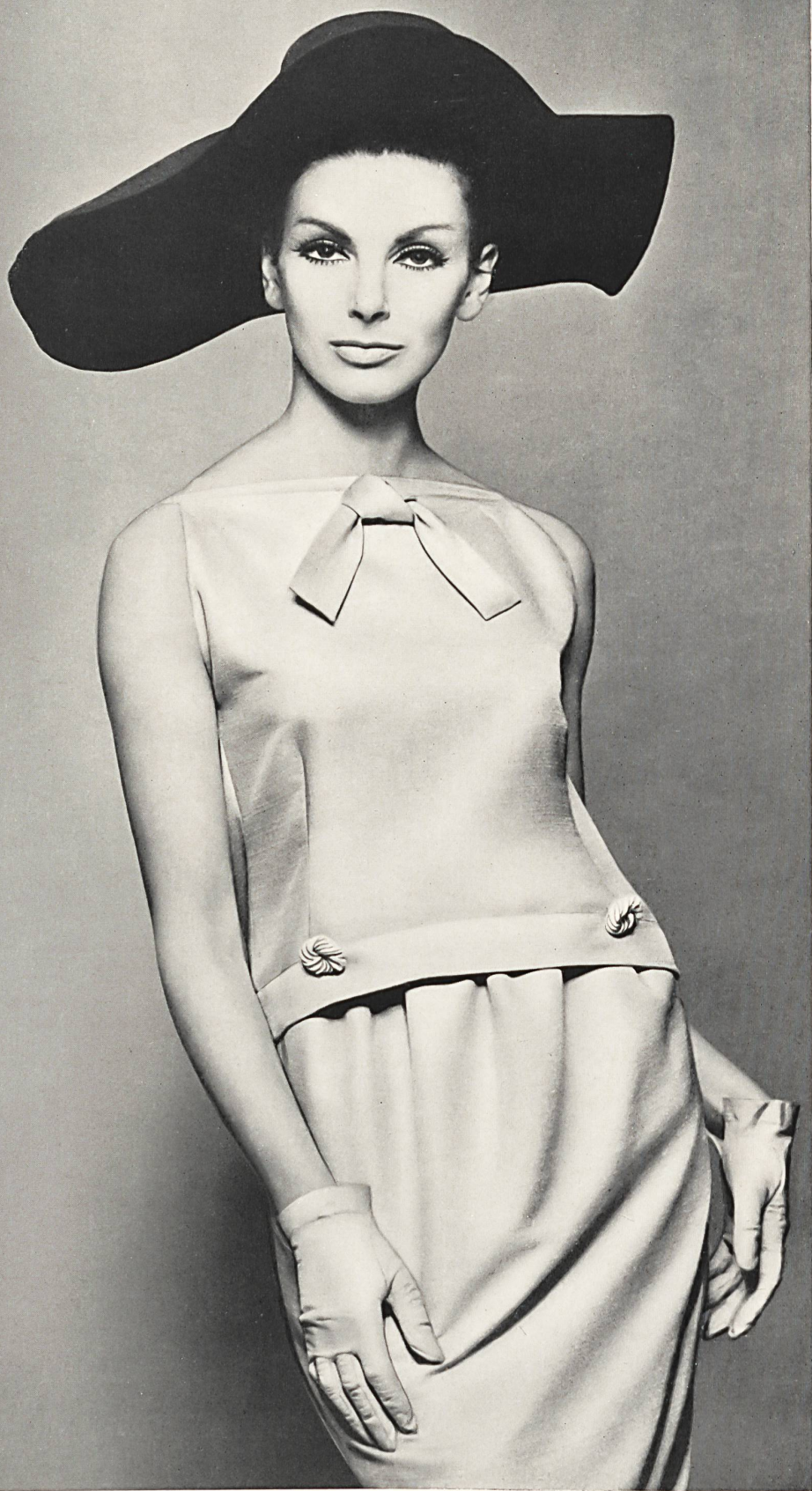
PIERRE CARDIN Shantung « Favorite » pure soie de Robt. Schwarzenbach & Co., Thalwil