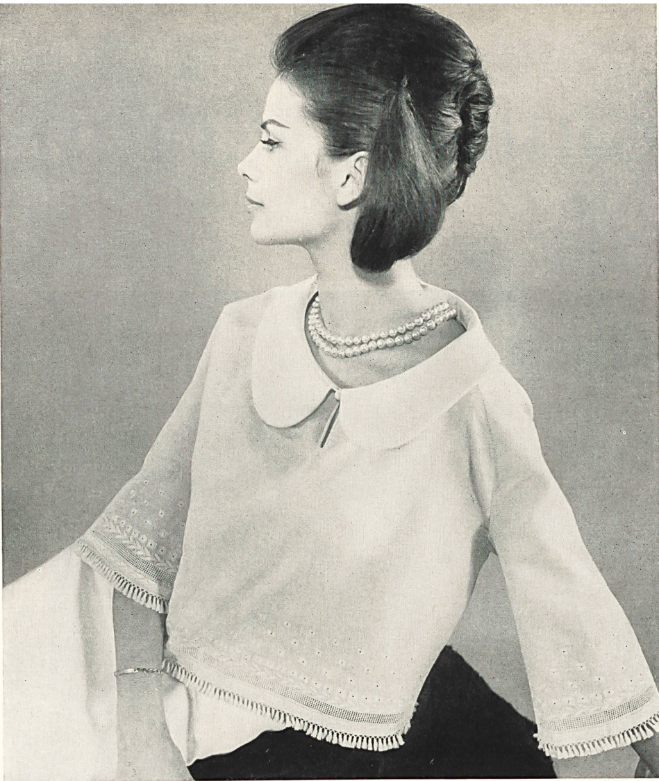
CARVEN Broderie « Nelo » sur « Minicare » Belrosa de J. G. Nef & Co. S. A., Hérisau Grossiste à Paris : Robert Burg & Cie