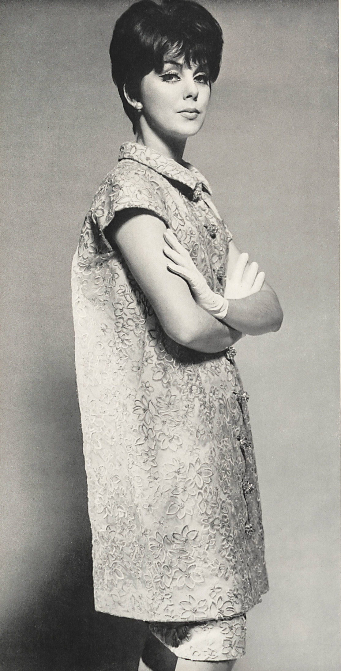
BALENCIAGA Photo Rév