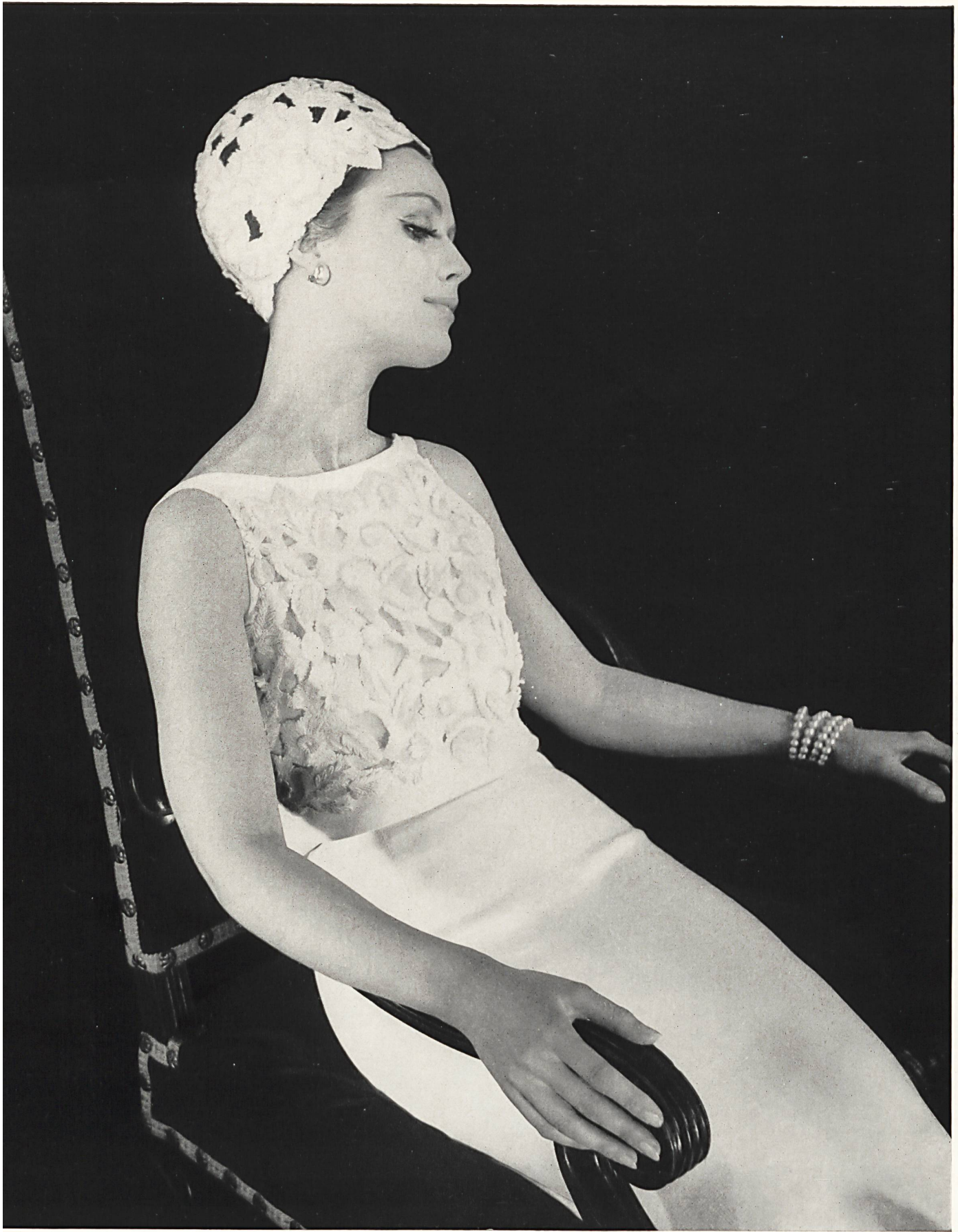
PIERRE BALMAIN Dentelles de guipure ficelle de Jacob Rohner S. A. Rebstein / Saint-Gall