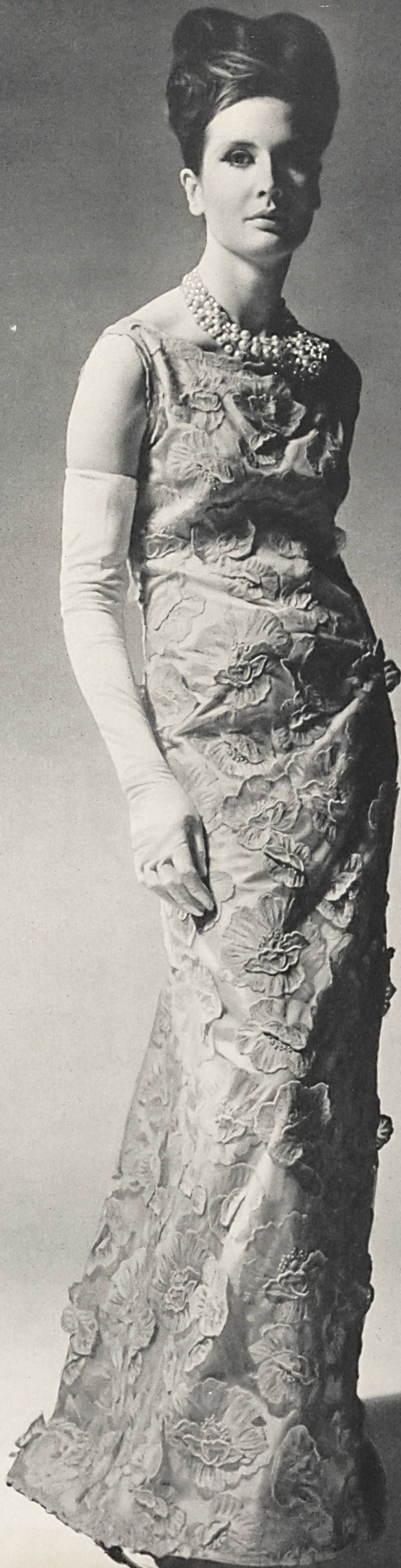
BALENCIAGA Photo Rév