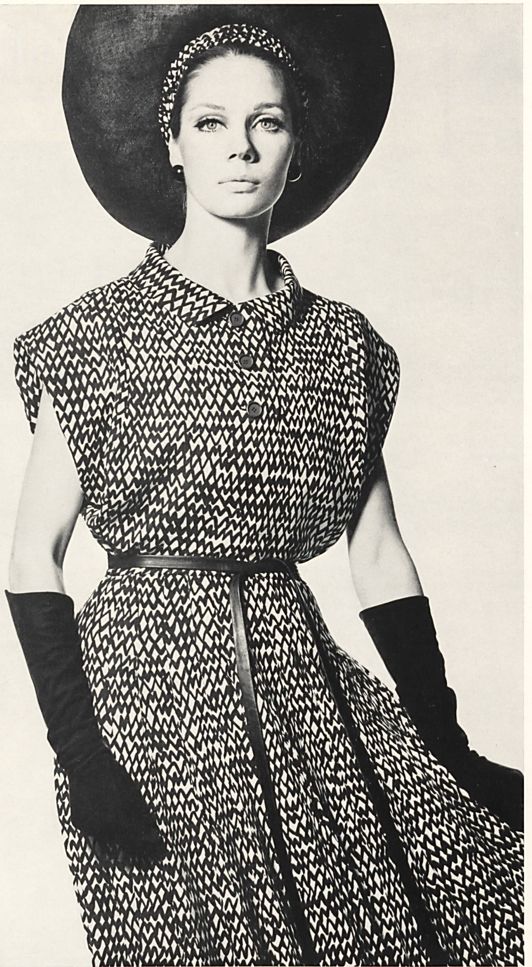
CHRISTIAN DIOR Crêpe « Caroline » imprimé de L. Abraham & Cie, Soieries S. A., Zurich