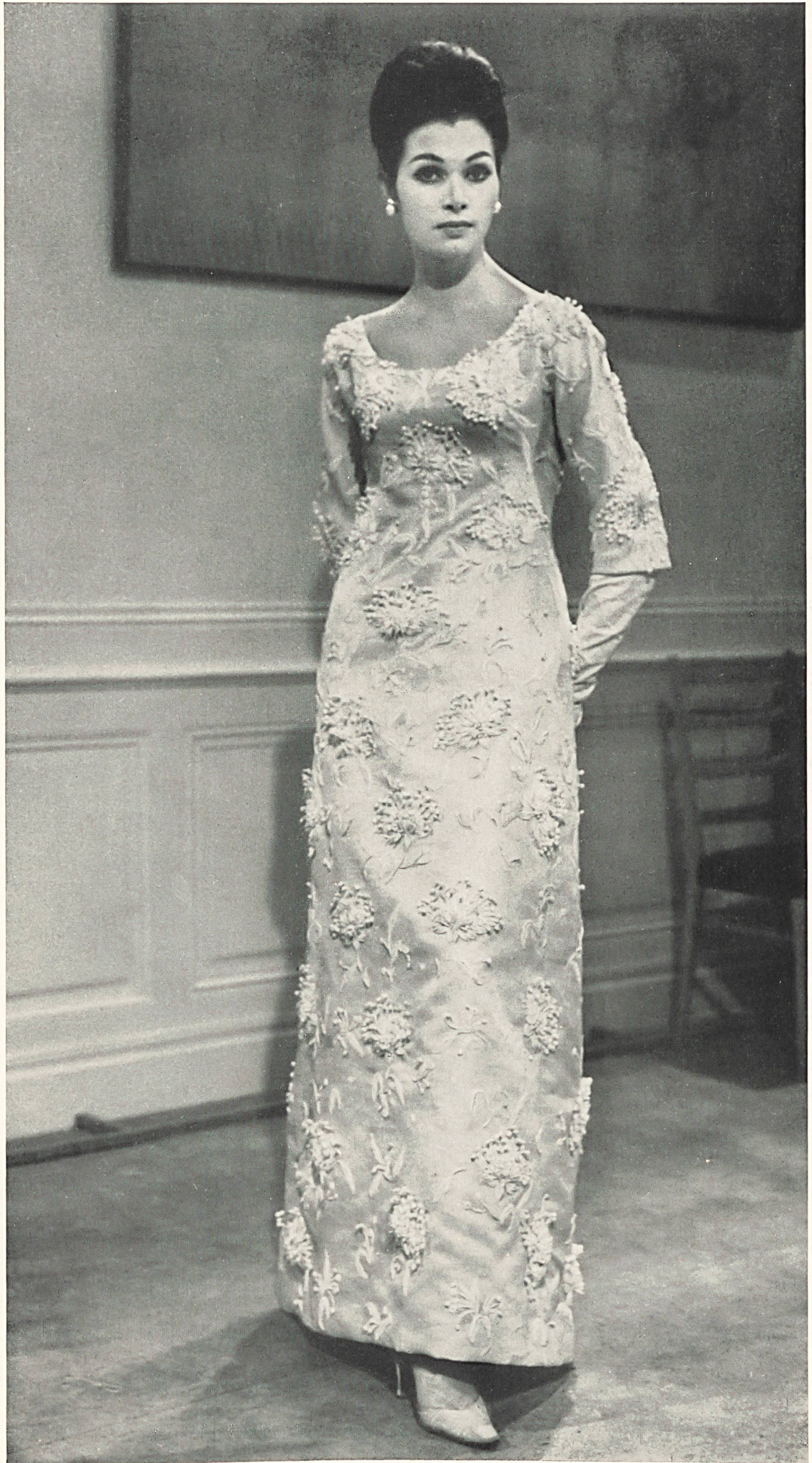
YVES SAINT-LAURENT