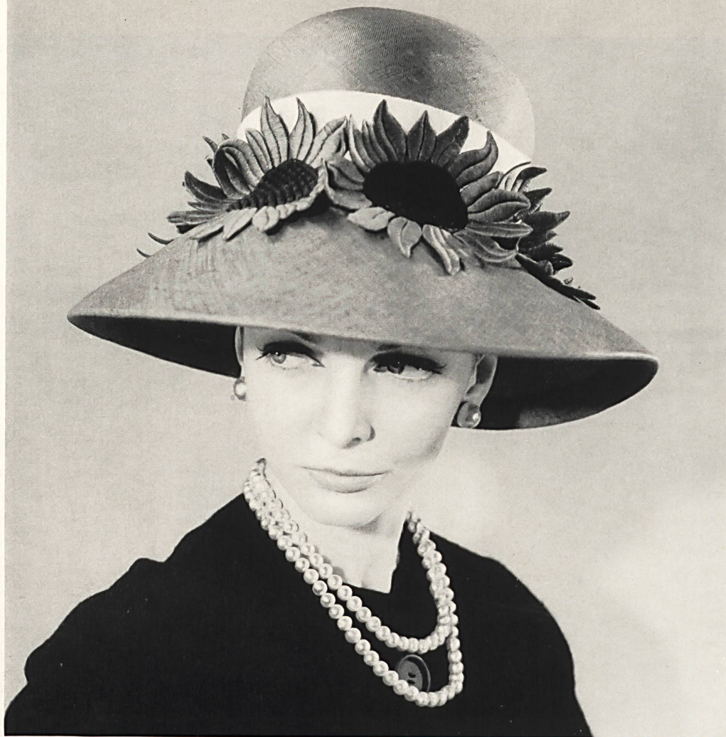
JEANNE LANVIN (DEVAUX) Motifs brodés deux couleurs de Union S. A., Saint-Gall Grossiste à Paris : Robert Burg &