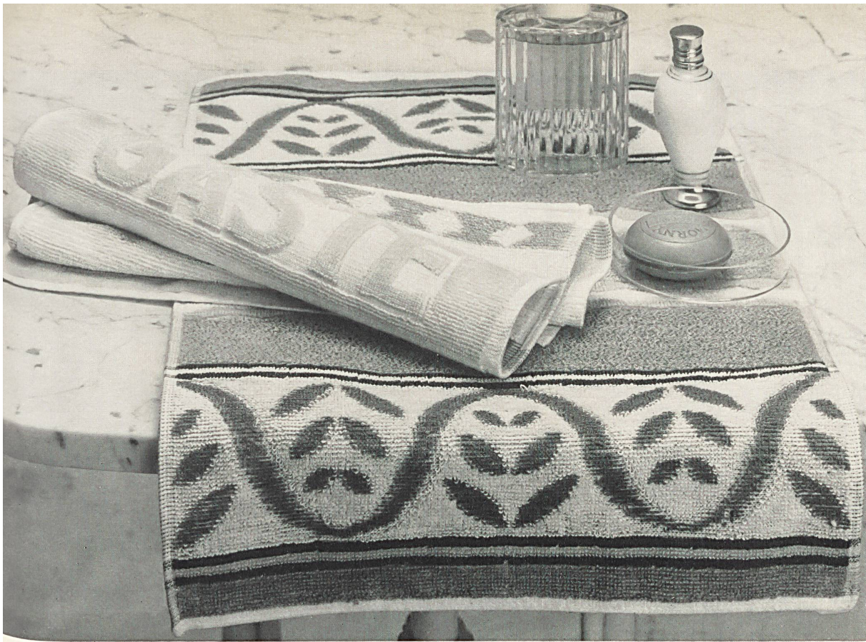
Jeu de linges-éponges en coton pour invités, avec inscription ad hoc en tissage jacquard Set of cotton guest towels, with Jacquard weave lettering Juego de toallas de felpa, de algodón, para los huéspedes, con inscripciones ad hoc en textura jacquard Baumwoll-Frottiertücher-Garnitur für die Gäste, mit entsprechender, eingewobener Jacquard-Auf- schrift