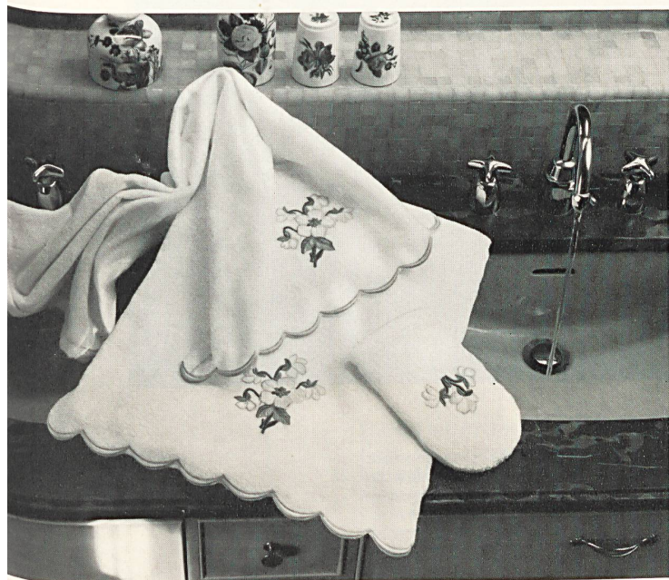
Boîte à serviettes Kleenex, serviette de toilette et serviette pour invités brodées ton sur ton — Kleenex case, self-toned embroidered face towel and bath towel — Caja para servilletas Kleenex, toallas corrientes y toallitas para huéspedes, bordado del mismo color que el fondo — Kleenex Schachtel, Handtuch und Gästetuch mit Stickerei Ton auf Ton