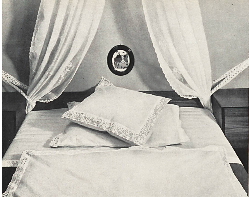
MAX SANDHERR A.G., BERNECK Rideaux en mousseline de coton brodée Curtains in embroidered cotton muslin Cortinas de muselina de algodón bordada Vorhang aus besticktem Baumwoll-Mousseline