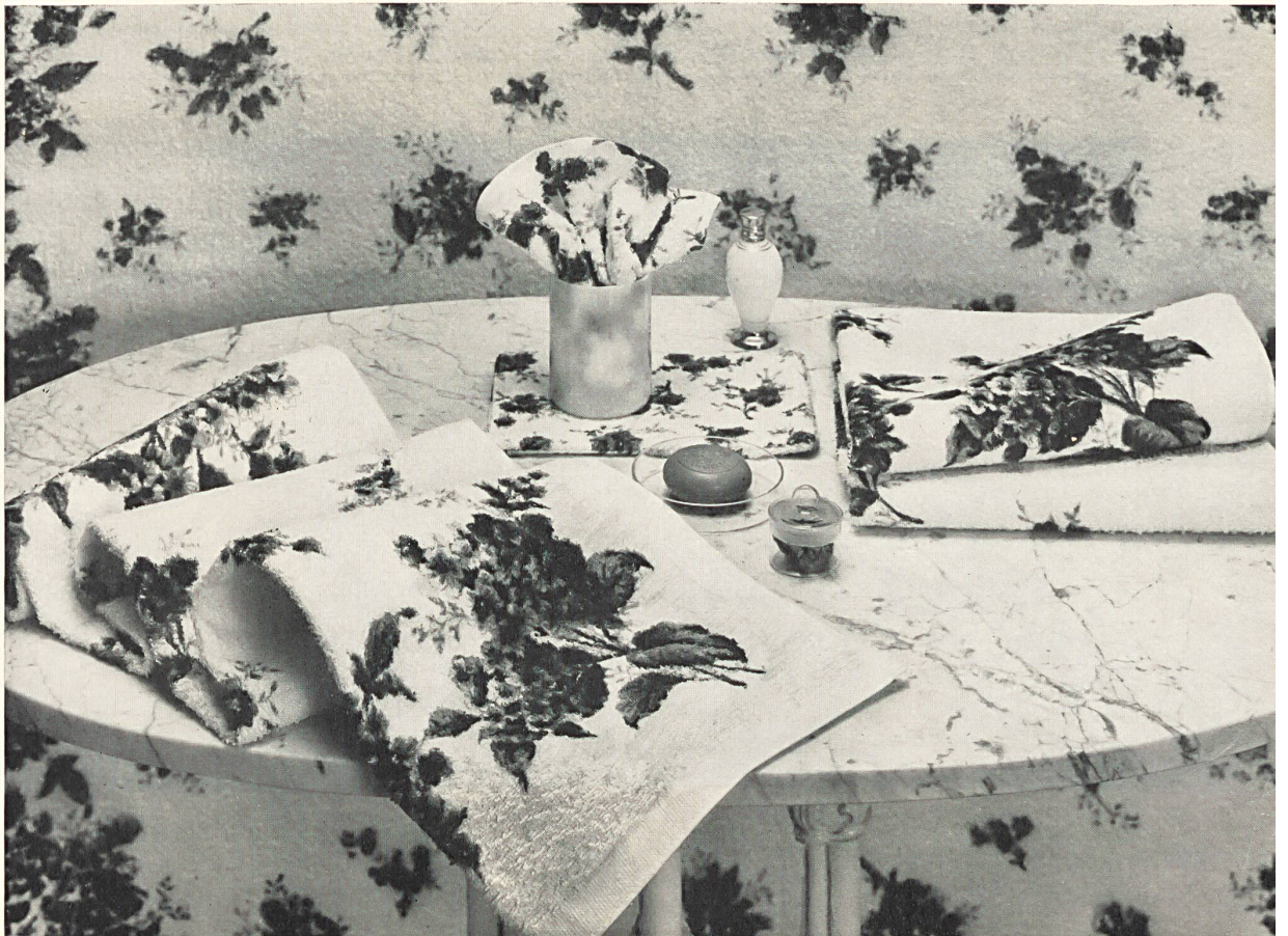
Un cadeau toujours apprécié ! Jeu complet de linges-éponges: tapis de bain, serviette, gant de toilette, serviette pour invités, etc. An ever popular gift ! A complete set of towels: bath-mat, towel, face-cloth globe, guest towel, etc. ¡ Un regalo siempre muy apreciado ! Juego completo de toallas de felpa: alfombra de baño, toalla, guante de baño, toallas para los huéspedes, etc. Ein netter Geschenkartikel ! Komplette Baumwoll-Frottiertücher-Garnitur mit Badematte, Hand- tuch, Gästetuch, Waschlapfen und Waschhandschuh