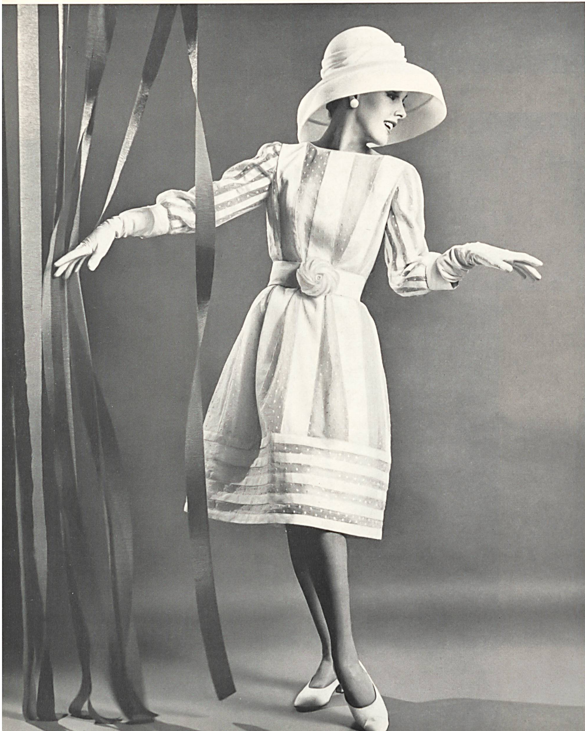
FORSTER WILLI & CO., SAINT-GALL White embroidered dotted organdy Organdi blanc brodé de pois Dress by Paul Whitney, Beverly Hills

Michael Novarese ist erst seit wenigen Jahren in Kalifornien, erntete aber trotzdem einen vorbehaltlosen Beifall bei der Kundschaft des ganzen Landes, die dem