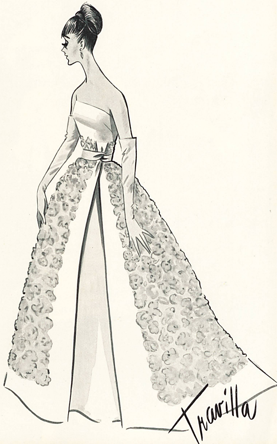
FORSTER WILLI & CO., SAINT-GALL Re-embroidered pink chenille lace Broderie chenille rose, rebrodée Dress styled and sketched by Travilla, Los Angeles